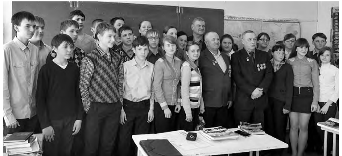
Фото на память с учащимися восьмых классов Марьяновской средней школы №1.

- Поездом мы ехали до Киева, где примкнули к комплексной экспедиции имени Курчатова, - рассказал он свою историю. - Дальше - Чернобыль. Кругом пустые дома без окон и дверей. Нас поселили в интернате, где когда-то проживали дети. И на следующее утро нас повезли прямо в эпицентр - на четвертый аварийный энергоблок, где шло сооружение объекта «Укрытие». Занимались строительством, а также уборкой стройматериала, который на грузовиках вывозили в могильник. Когда могильники заполнялись - их бетонировали. На работу едешь, кажется, сил полно, а как возвращаешься - усталость с ног валит, клонит в сон и еще в горле першит. Но все без исключения добросовестно выполняли свои обязанности, за спины никто не прятался. Возраст у нас был уже зрелый, дома ждали жены и дети. Получается, это был наш второй долг Родине после службы в армии.