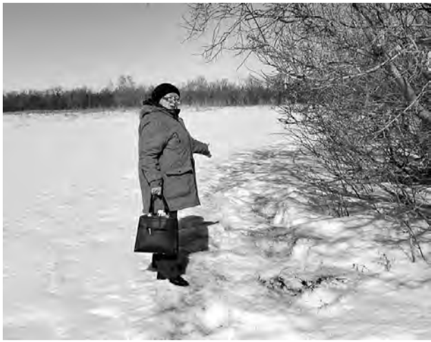
К электричке жители Охровки зимой ходят по натоптанной тропке.