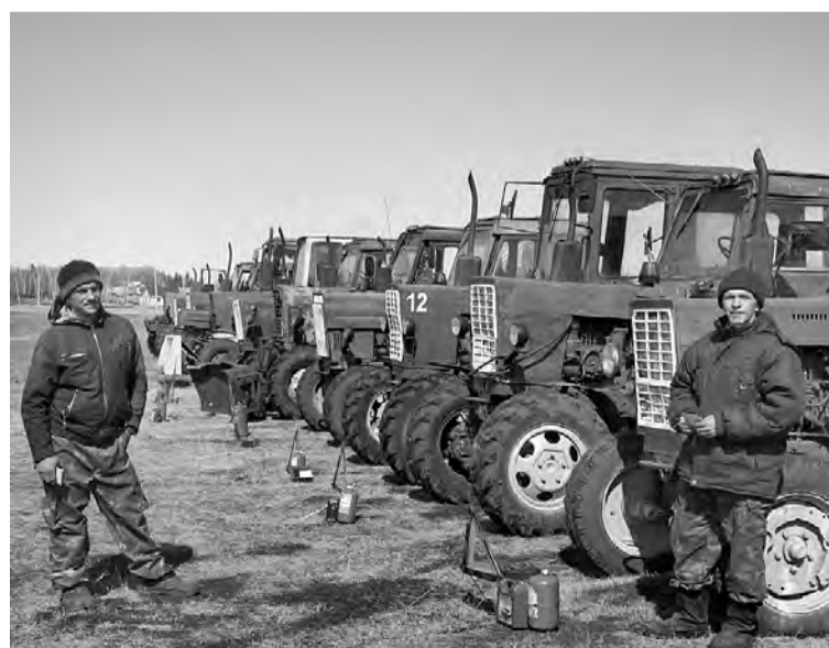
Трактора на линии готовности.