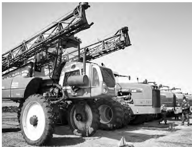
Вот такой современной импортной техникой располагает ЗАО «Знамя».