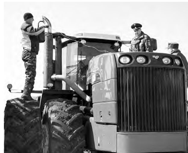
Проверка на загрязнение окружающей среды.