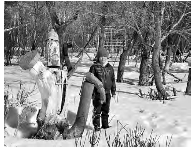
Чтобы поиграть на детской площадке местные ребята ждут теплых деньков.