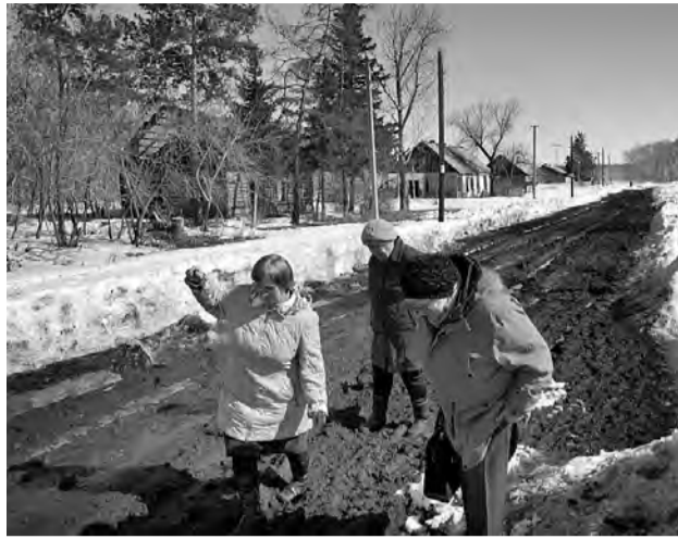
Бездорожье - не единственная проблема охровцев.