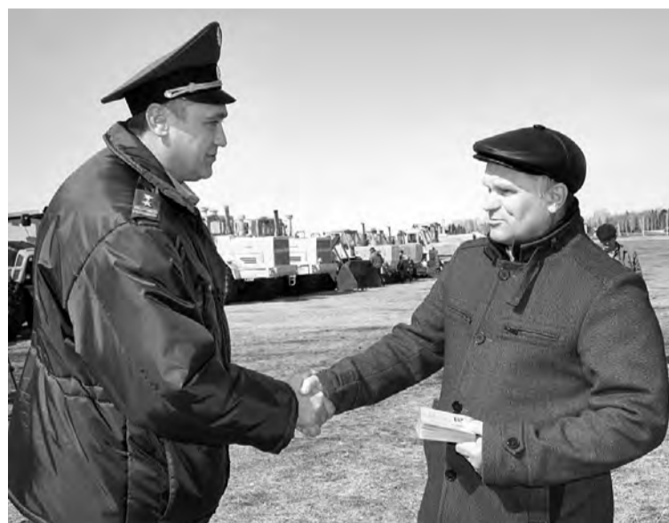
Вручение свидетельств о прохождении техосмотра.