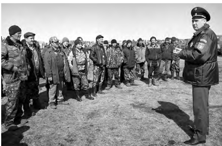
Инструктаж с механизаторами перед осмотром техники.

- Я думаю, что побывав в этом хозяйстве, что сделал и я с большим желанием, многие специалисты возьмут за основу, как надо готовить технику и сохранять ее. На дату проведения этого семинара, 14 апреля, готовность тракторов к весенне-полевым работам в регионе составляла 85-87 процентов. Но там, где имеются ремонтные цеха и этим делом занимаются и в зимнее время, она намного выше. Что мы и наблюдали в этом сельхозпредприятии. В целом в агропромышленном комплексе региона все еще фиксируется высокий процент техники, срок эксплуатации которой более десяти лет. Даже несмотря на то, что аграрии в последние годы заметно проводят ее обновление. Только в прошлом году это было сделано на 2,8 млрд. рублей. Уже в первом квартале текущего года техники приобрели на 386 млн. рублей, и этот процесс активно продолжается.