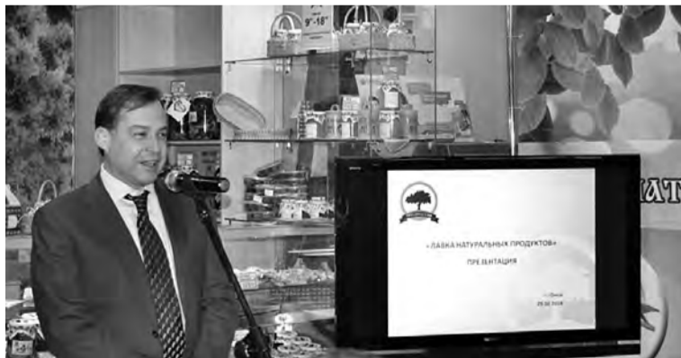
На открытии магазина министр экономики региона Александр Третьяков.

Сейчас мощности завода позволяют выращивать до 50 тонн рыбы и 500-700 килограмм икры. В ближайших планах, учитывая те задачи, которые стоят перед регионом по импортозамещению, на «Бородино» планируется запуск второй очереди производства. Но, как подчеркнул министр, завод интересен