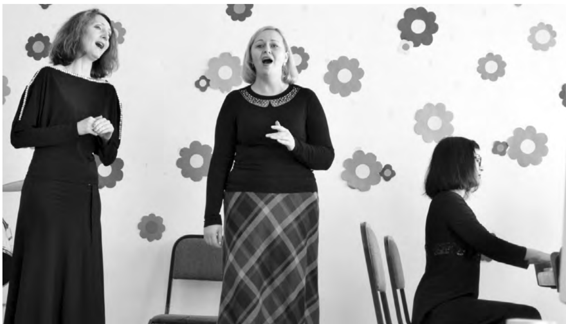
Каждый концерт в Марьяновской школе искусств имени А. М. Черкунова проходит с особой теплотой.