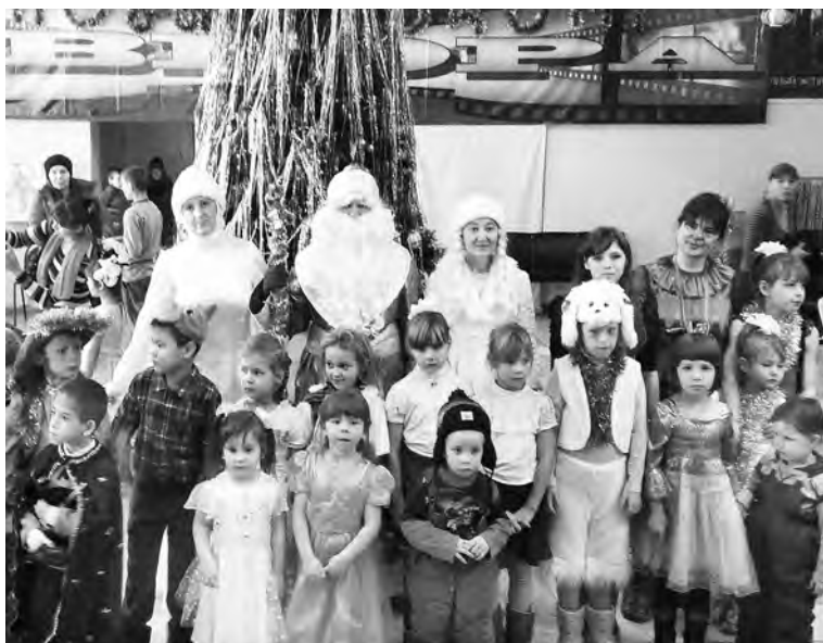
Фрагмент благотворительного новогоднего праздника.

Новый год - это самый долгожданный и радостный праздник, время волшебства и исполнения желаний.