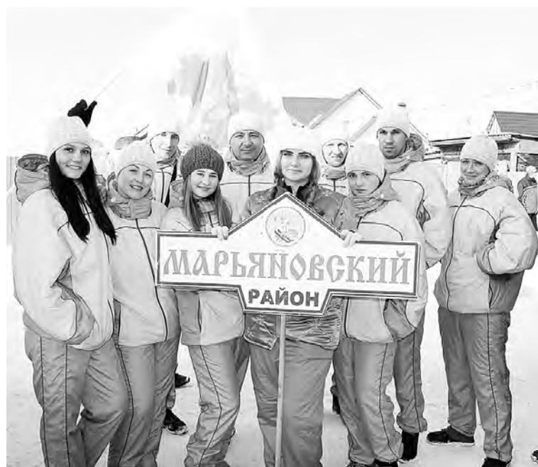
Сборная представлена на областных спартакиадах в единой форме.

- Кстати, а какие-либо новинки в укреплении спортивной базы появились в минувшем году?