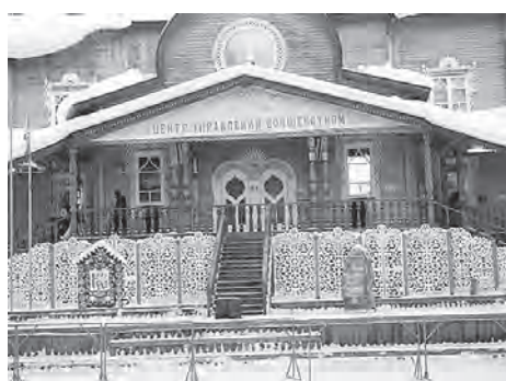
Вотчина главного волшебника страны в Великом Устюге.