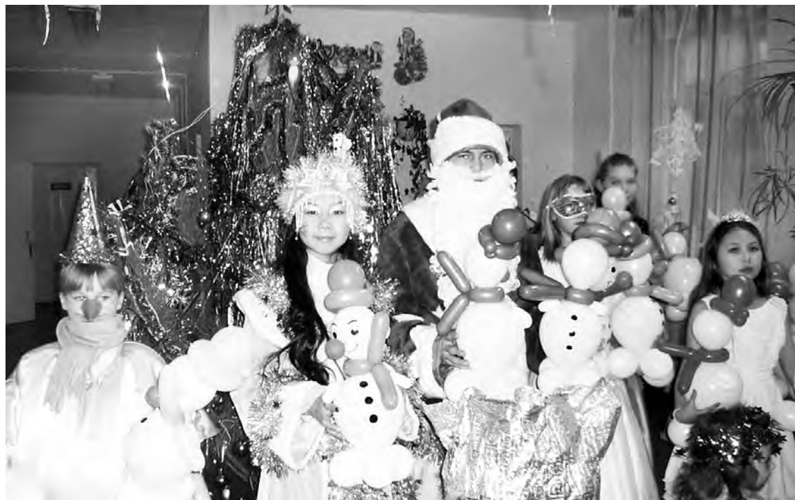
Праздник для детей в Большой Роце.

Ну а изюминкой зимних чудес в ЦДТ, разумеется, являлись новогодние балы и утренники. Их было множество. Один из них состоялся в Боголюбовском детском саду. Подготовили и провели его ребята из детского объединения «Созвучие». Король, Шут, злая Колдунья, Дед Мороз и Снегурочка представили перед детьми настоящую