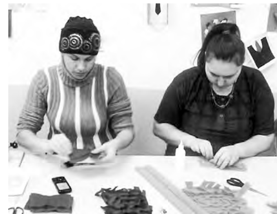
Мастер-класс по свит-дизайну для родителей.

новогоднюю сказку. Они пели и плясали, играли и творили чудеса.