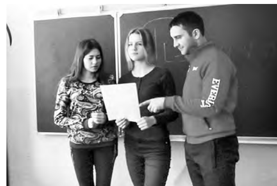
Фрагменты профессионального общения молодых педагогов-мужчин со старшеклассниками.

уклоном. К примеру, в декабре в Березовской, Кара-Терекской, Орловской, Марьяновских №2 и №3, Пикетинской, Шараповской школах для обучающихся 8 – 11 классов проведены открытые внеклассные занятия, целью ко-