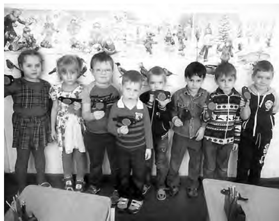
Признание малышек в любви к пернатым.