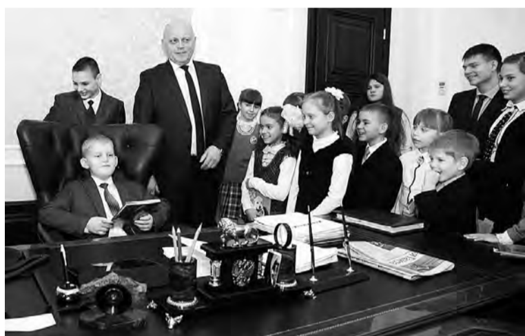
Самые проворные школьники могли попробовать себя в кресле главы региона.