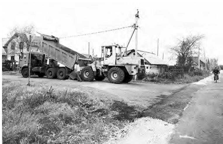
В течение нынешнего осеннего сезона дорожная техника поработала на разных улицах райцентра.

Много работы по благоустройству ежегодно делается и силами