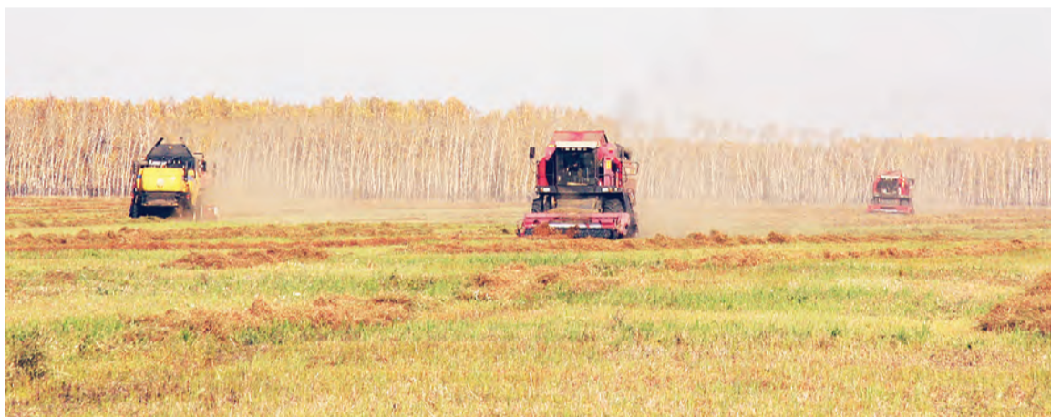
Оперативно провели знаменцы обмолот льна, который вырастили на 600 гектарах.

[ В тему ] Согласно оперативным данным управления сельского хозяйства, на 16 октября в районе обмолочено 93,1 процента уборочной площади. Намолочено 120153 тонны зерна при средней урожайности 20,6 центнера с гектара.