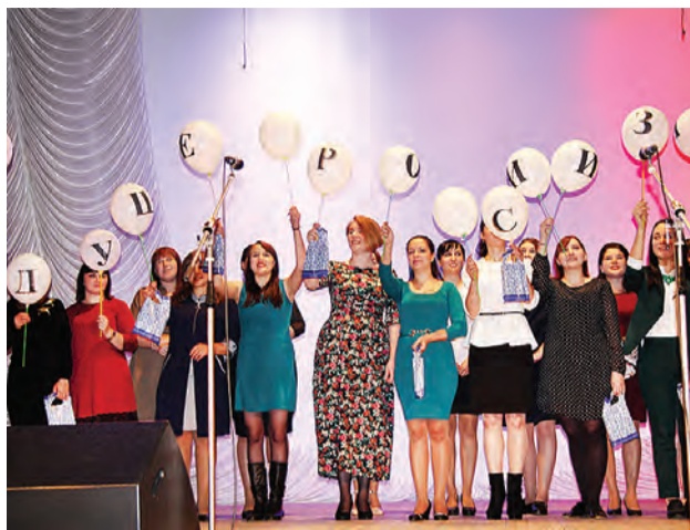
«Будущее России за нами» - так считает молодое пополнение сферы образования района.