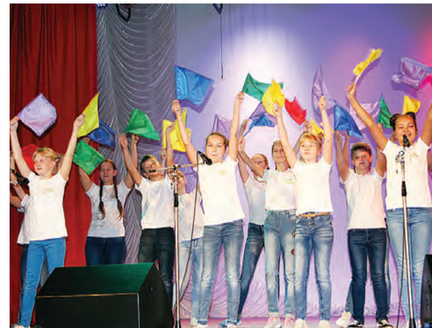
Яркую музыкальную программу подарили педагогам лучшие творческие коллективы.