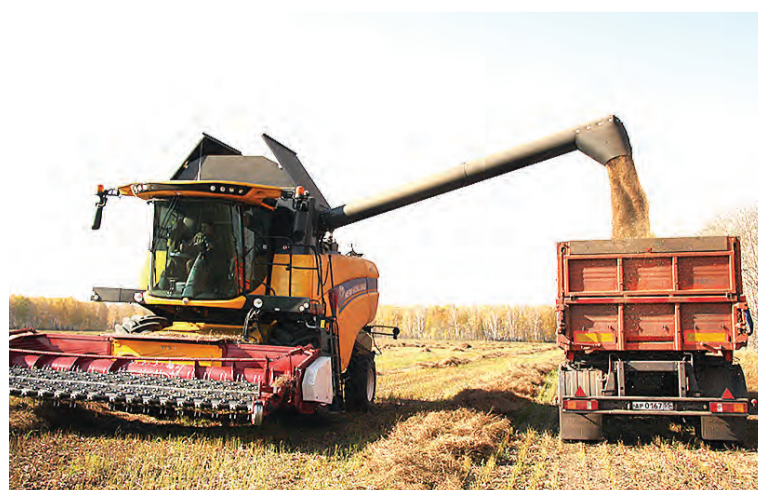
Урожай выгружается из нового комбайна, приобретенного к жатве.