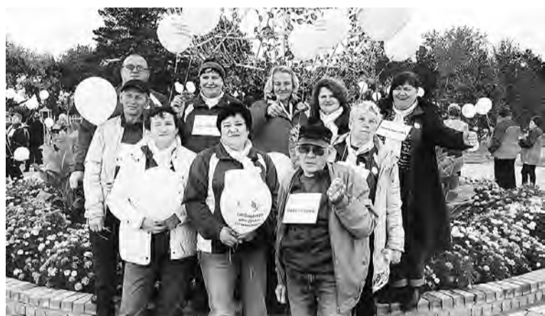
Участники марьяновской команды на спартакиаде в Шербакуле.