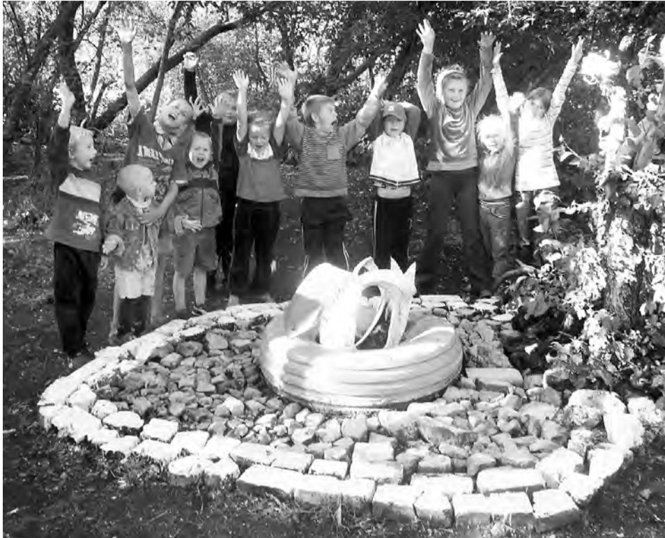
И был летний отдых веселым.