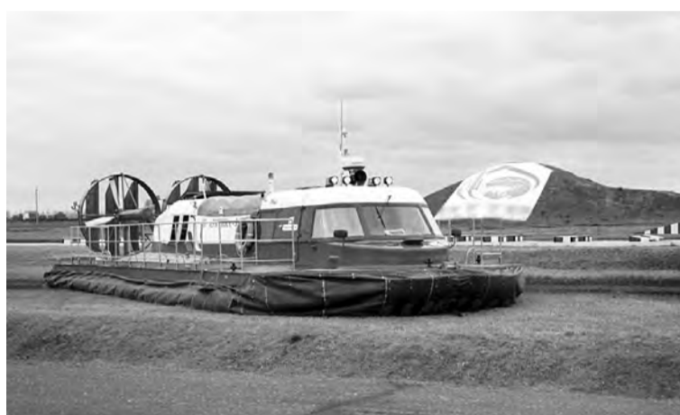
Экспозиция разместилась на 17 тыс. кв. м внутреннего павильона областного Экспоцентра, а также на открытой площадке.

российских предприятий представили на выставке свои разработки и продукцию для Крайнего Севера.