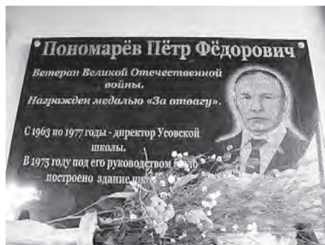
Так выглядит мемориальная доска.