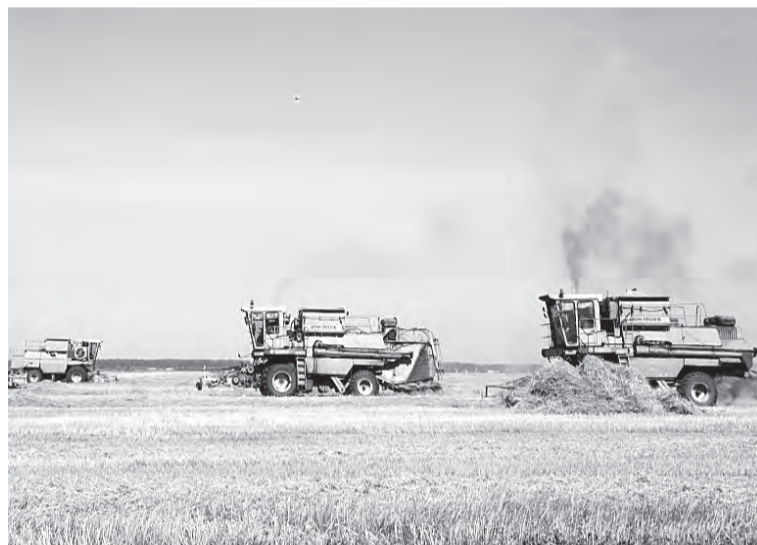
Обмолот ведут одиннадцать «Донами».