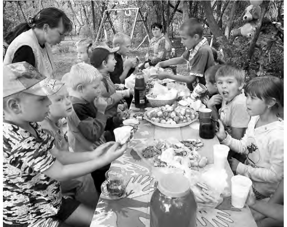
Пикники на свежем воздухе - сюрпризы от родителей.