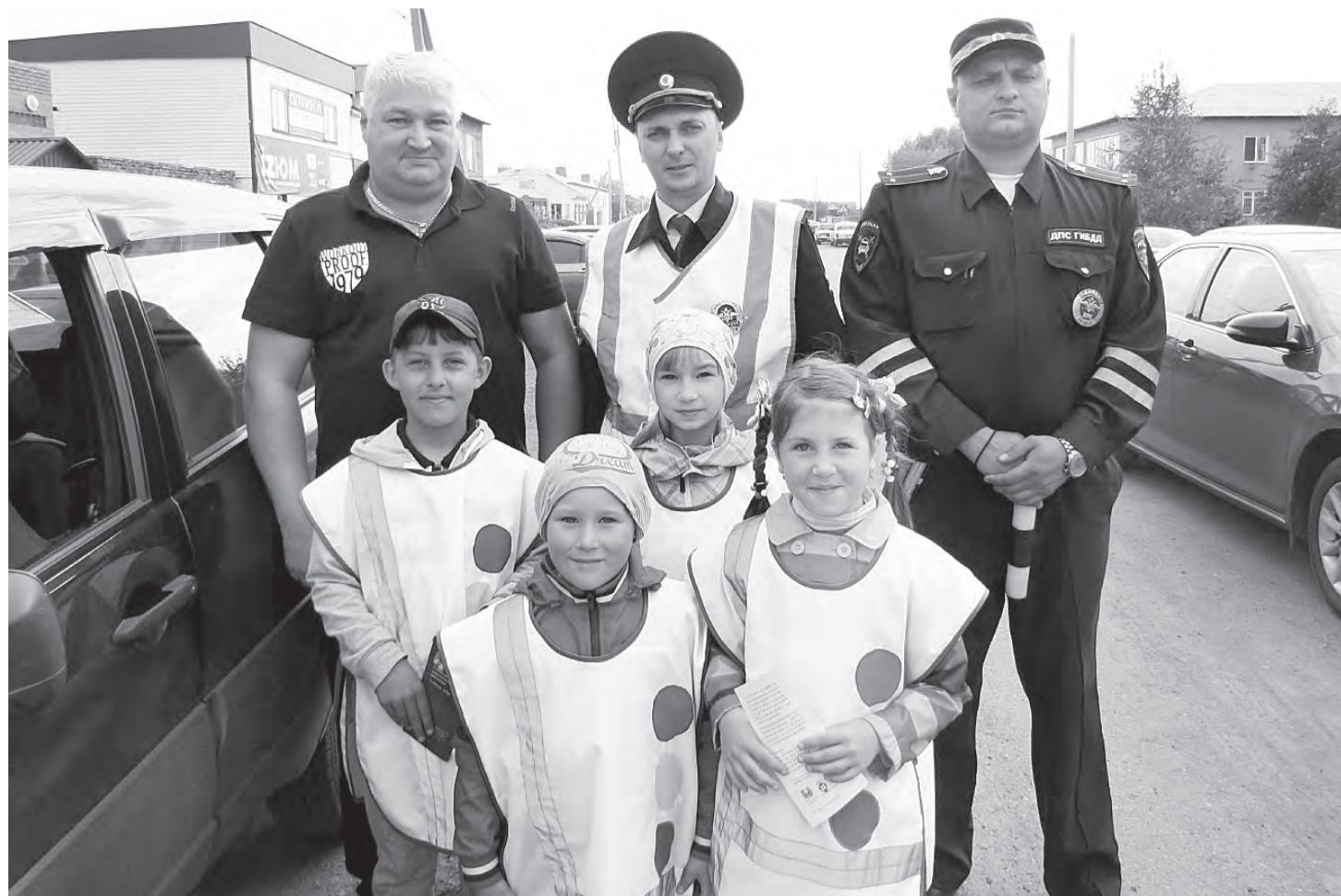
Совместный дорожный патруль сотрудников ОГИБДД и марьяновских ребят.