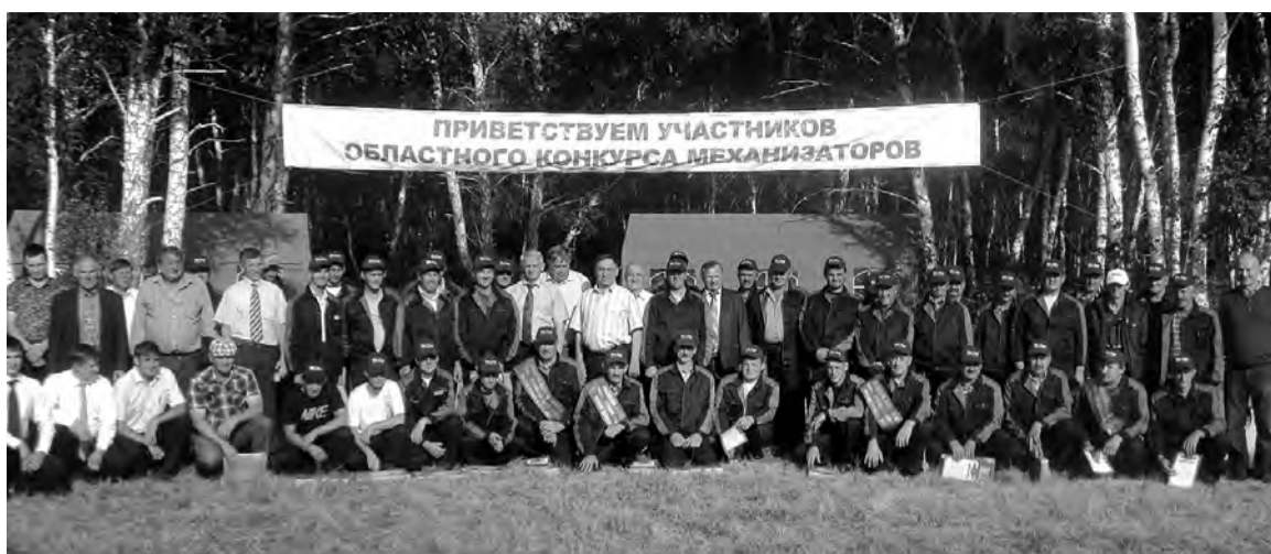
Коллективное фото на память об участии в конкурсе профессионального мастерства.