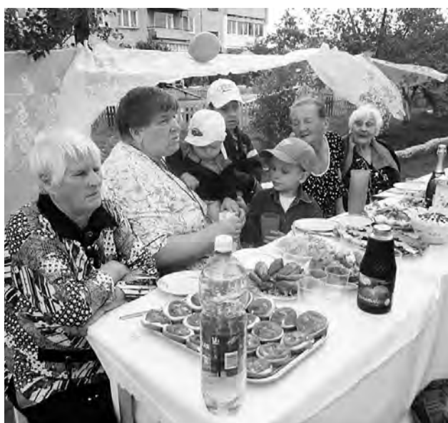
Вкусными блюдами собственного приготовления в этот день порадовала соседней каждая хозяйка.