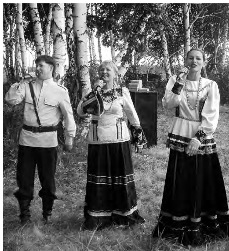
Настроение поднимали артисты Таврического района.