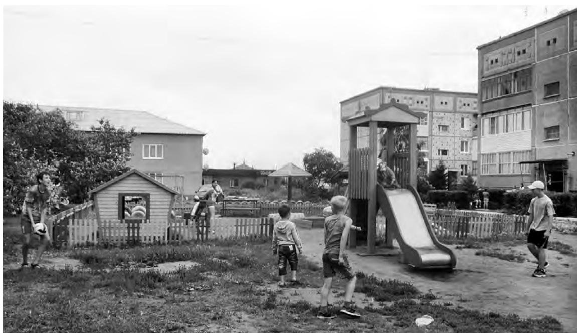
Детскую площадку обустроили всем двором, на ней всегда многолюдно.