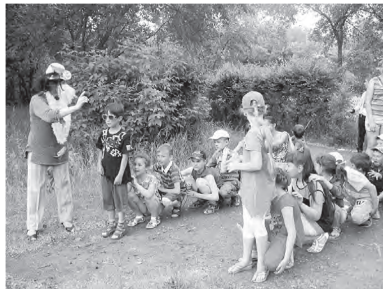
Игры на свежем воздухе и приятны, и полезны.

Наибольший интерес у юных марьяновцев и их родителей вызвала выставка – викторина «В гостях у сказки», где дети искали ответы на вопросы «Из какой я сказки?» и «Узнай сказку?», а затем рисовали люби-