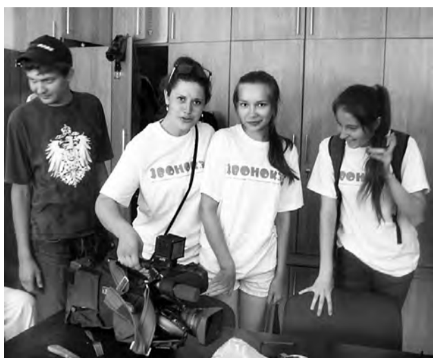
Ох и тяжела съемочная камера телевизионного оператора.