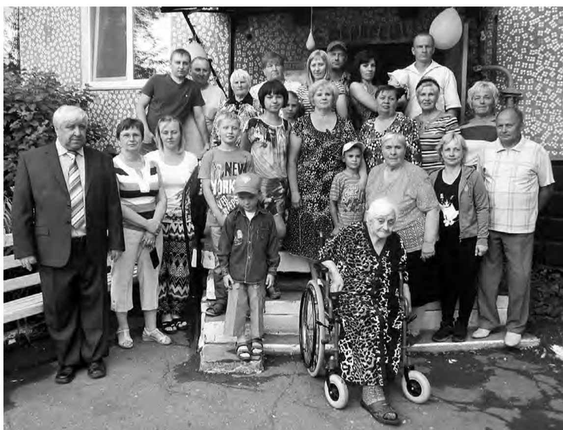
Общие заботы сплотили жителей дома №56.

За годы менялись жильцы дома, кто-то переехал в другое жилье, кто-то уехал из посел-