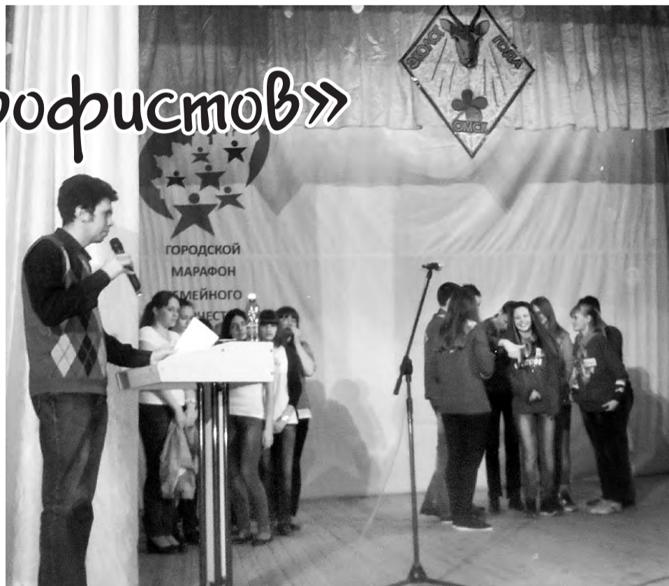
Состязания юных экологов (справа участники из Степнинской школы).