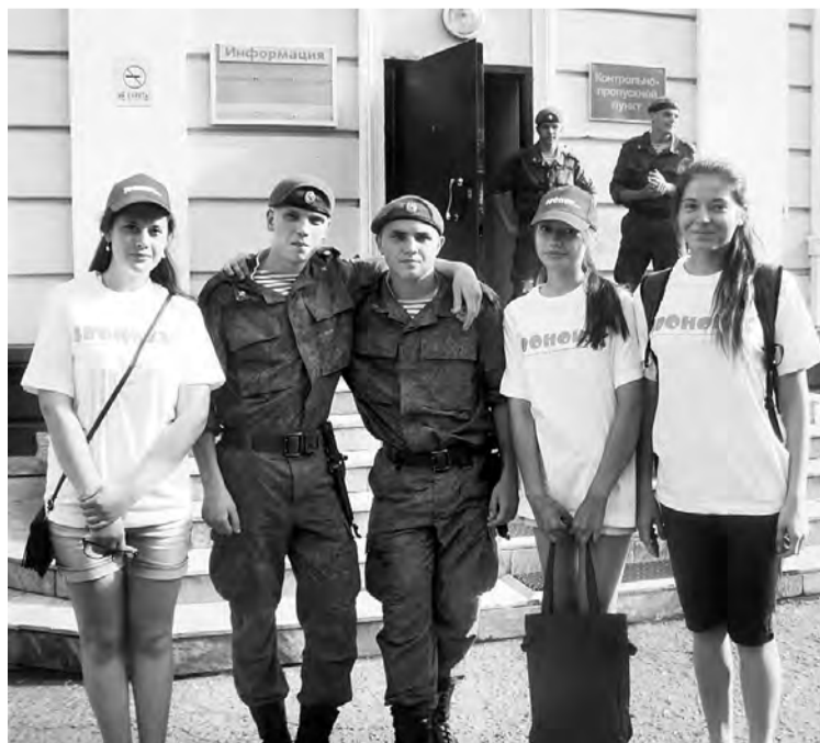
Было время и с кадетами пообщаться...