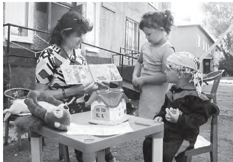
Любят книги приобщают в библиотеке малышей.