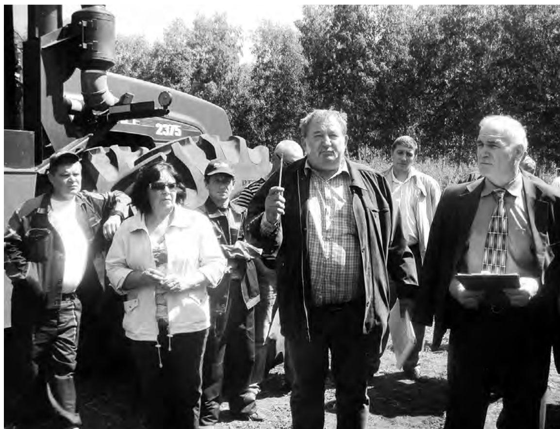
Состязания механизаторов оценивала компетентная судейская бригада.