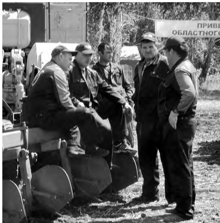
Обмен мнениями и опытом в перерыве между этапами конкурса.