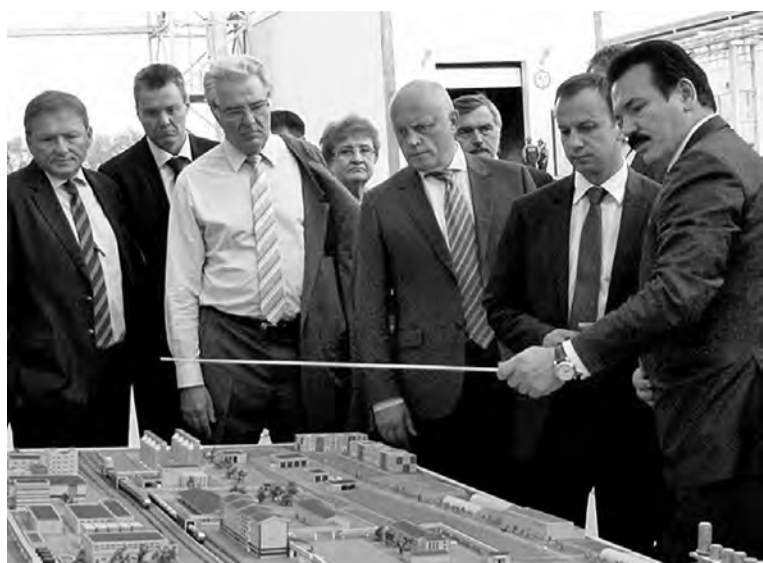
Проект обеспечит дополнительные рабочие места и налоги в бюджет.

- Сегодня мы делаем акцент и выдвигаем в качестве приоритета развития АПК глубокую переработку зерновых ресурсов и создание комбикормового производства. Это действительно один из приоритетных, важных шагов на пути реализации нашей новой программы, в том числе программы импортозамещения.