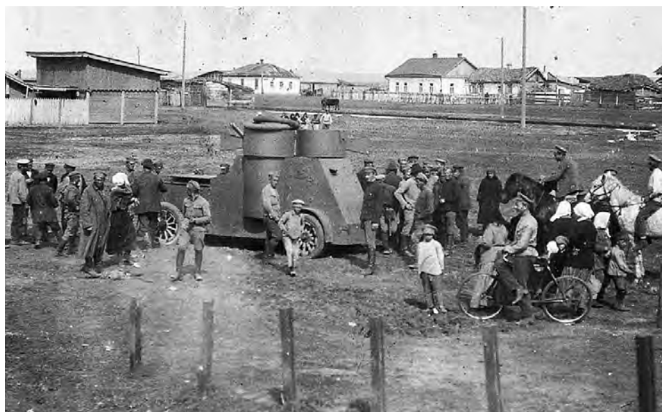
Броневик «Питерец» на ст. Мариановка.