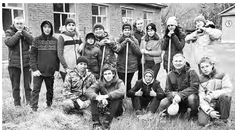
На уборку территории лагеря степнинские школьники откликнулись дважды, заверив что и отдыхать в него приедут обязательно.

Во-первых, в целях безопасности произведен монтаж новой пожарной сигнализации и установлено видеонаблюдение. В разделе крупных ремонтных работ - пищеблок и душевые, приобретенные красивый, современный вид, крыша культурно-досугового центра, в приобретениях - промышленный холодильник, кровати, матрасы, тумбочки, постельные принадлежности, в благоустройстве - частичная замена изгороди.