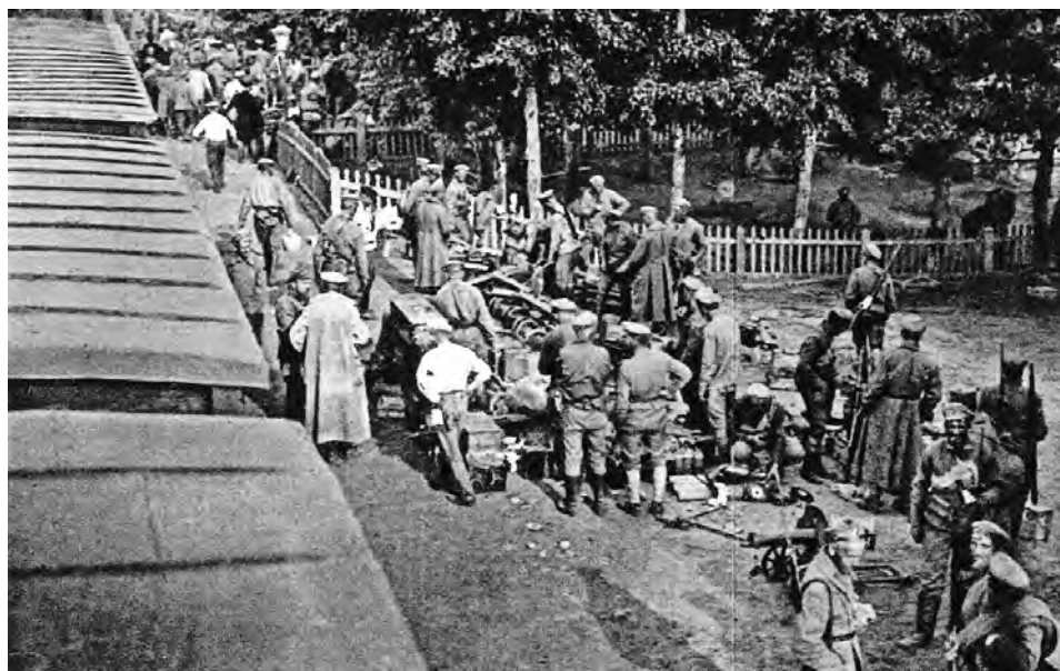
Чехи на ст. Мариановка. 6 июня 1918 г.