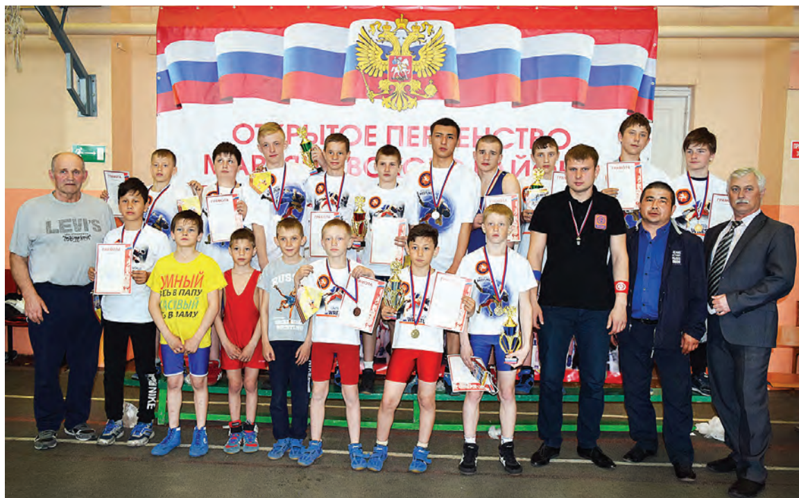
Копилка марьяновских борцов пополнилась новыми победами и призами.

Особенно «жарко» в зале было, конечно же, во время финальных поединков. Бурными овациями и радостными возгласами болельщиков сопровождалась большая и