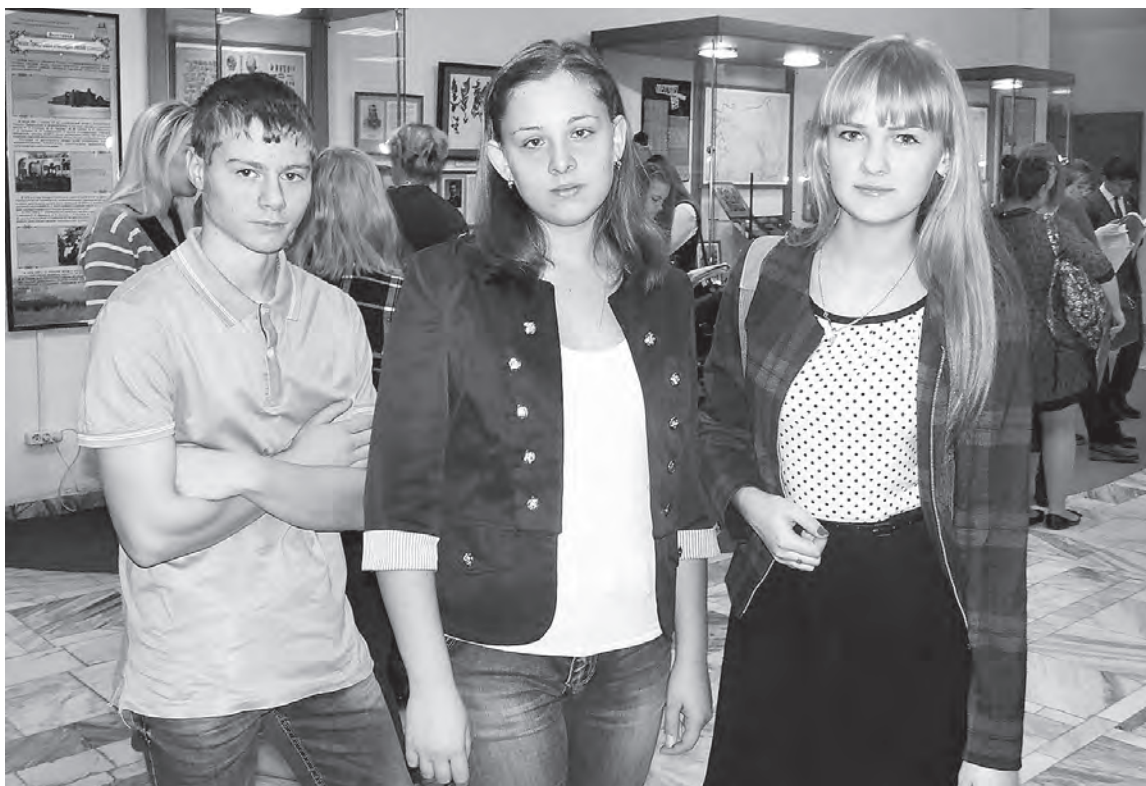
Степнинские ребята – участники регионального слета юнкоров.

образовательными практиками – как правильно говорить, как уметь сопоставлять различные факты, очень понравились методики по произношению, ведь журналисты должны не только грамотно писать, но и грамотно говорить. Интересно было услышать мнения студентов Омской гуманитарной академии об их профессиональном выборе, их первых журналистских шагах. По итогам общения был сделан вывод, что журналист должен очень ответственно относиться к выпускаемым материалам, ведь случается, что от пера зависит судьба человека. Как правило, он не только сообщает информацию, но и пытается помочь людям. Интересно было познакомиться и с журналистскими практиками. Например,