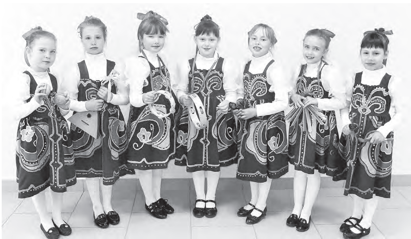
Детский фольклорный ансамбль районного Дома культуры.