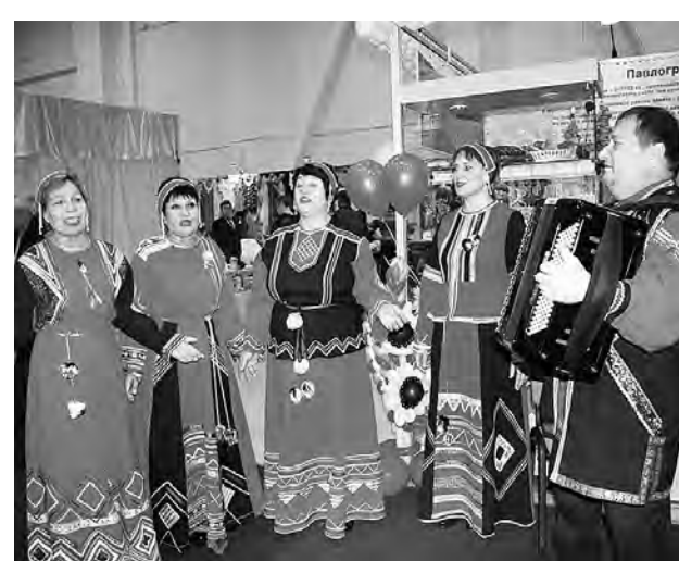
Радовали выступлениями на выставке творческие коллективы.