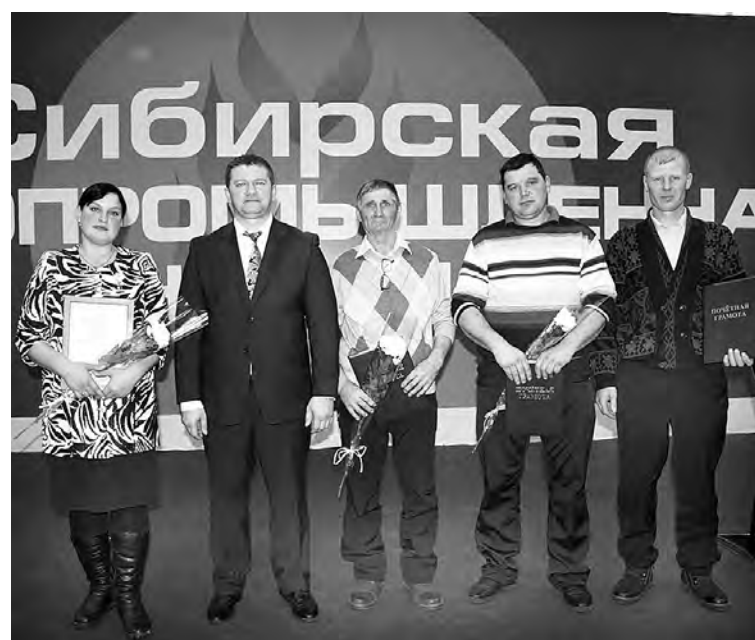
Победители из Марьяновского района с министром агропрома Максимом Чекусовым.