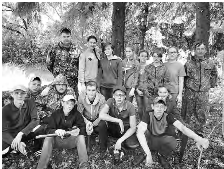
В Москаленской школе успешно функционирует клуб «Патриот».

В новом учебном году клуб продолжил свою работу. На его общем собрании было принято решение о проведении акции «Большая перемена», цель которой заключается в