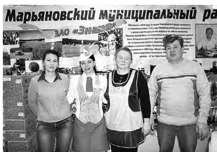
Участники марьяновской делегации, реализовывавшие продукцию на ярмарке.