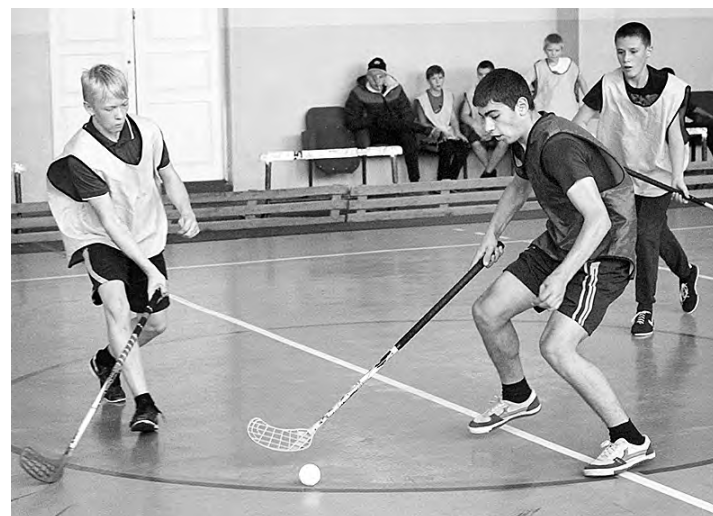
Фрагмент игры во флорбол.