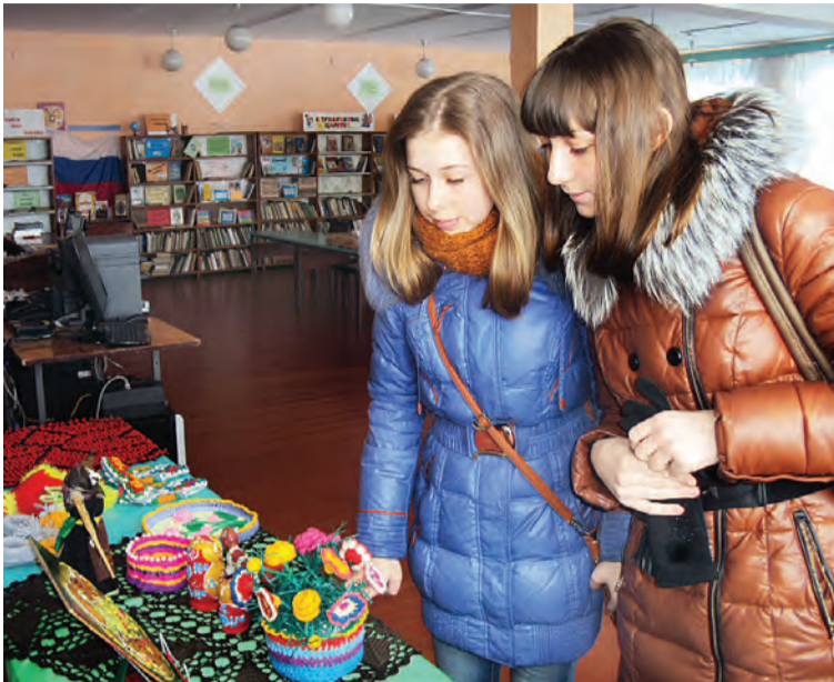
Фрагмент выставки в Боголюбовской библиотеке.