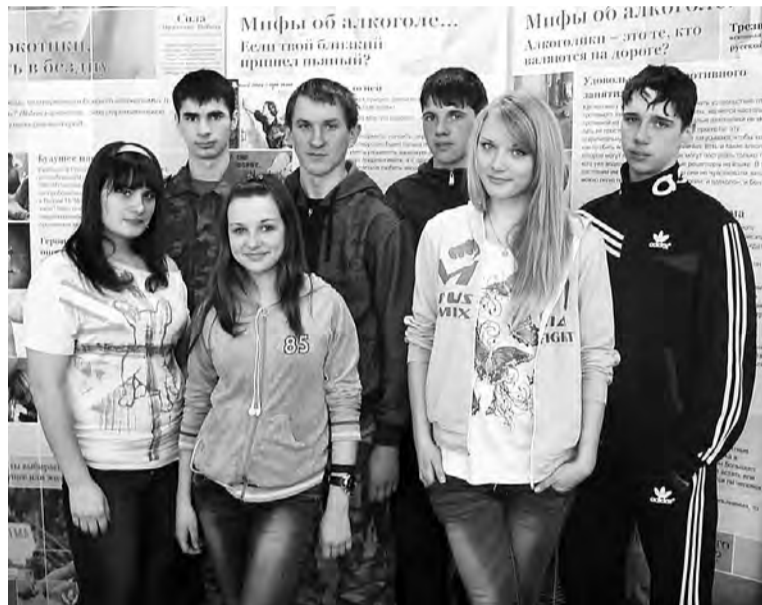
Инициативная группа профессионального училища №16, проходящая обучение в мастер-классе на тему «За жизнь и трезвую Сибирь!».