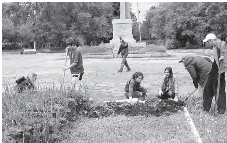
Прополку клумбы осуществляют бригады подростков, трудоустроенных на сезонные общественные работы при Центре детского творчества и Марьяновской средней школе №1.

Материалы, представленные на конкурс, не возвращаются и не рецензируются. Справки по телефонам: (3812) 51-09-63.