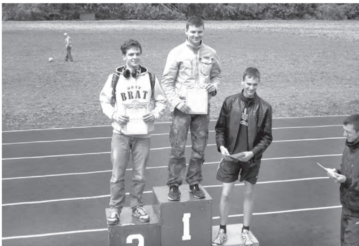
Весь пьедестал - марьяновский.