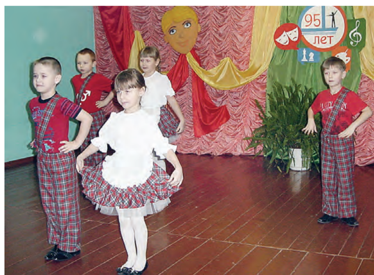
Участников форума приветствуют воспитанники студии «Мальшюк» из ЦДТ.