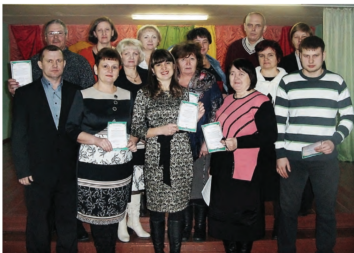
Все те, кто делились опытом.