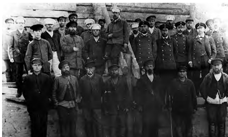
Инженеры, техники и подрядчики, все, кто руководил строительством железной дороги.