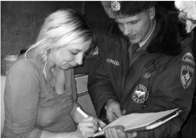
Во время подворного обхода и обучения граждан мерам пожарной безопасности.