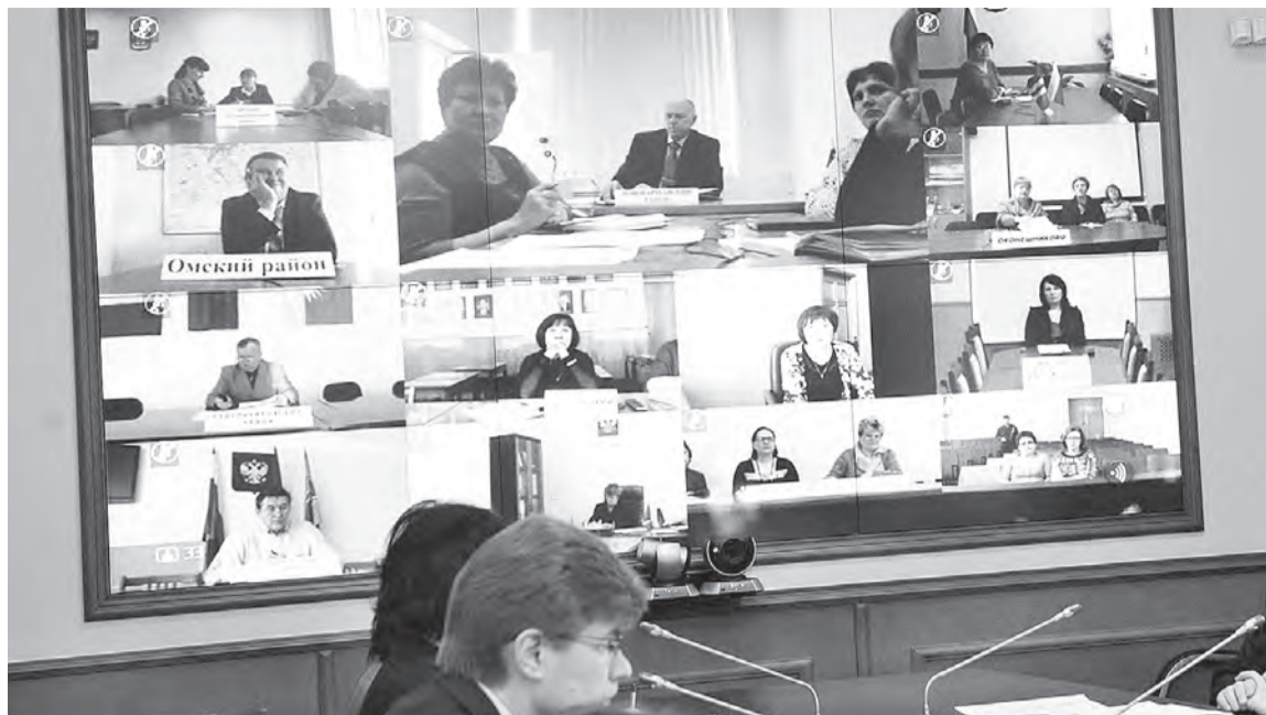
Министр экономики Сергей Высоцкий провел совещание в режиме он-лайн.