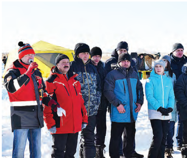
Соревновательный дух участникам поднял известный автогонщик Александр Фабрициус.