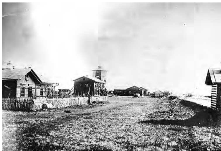
Общий вид станции Мариановка, 1896 г.