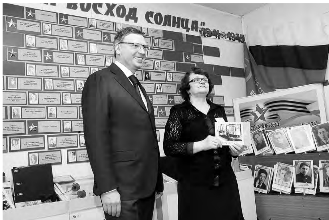
Уровень зарплат работников бюджетной сферы региона находится на особом контроле.

Александр Бурков добился для Омской области дополнительной федеральной дотации.