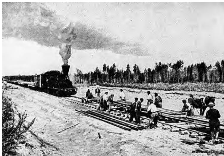
Рабочие на строительстве Транссибирской магистрали.

В 1903 году (115 лет назад) в деревне Михайловка на средства жителей построено специальное школьное здание. Об этом написано в книге «Справочные сведения о переселенческих поселках». Надо сказать, что тогда Михайловка по числу жителей была примерно равна соседней Боголюбовке, в которой школу в наемном помещении открыли в 1901-