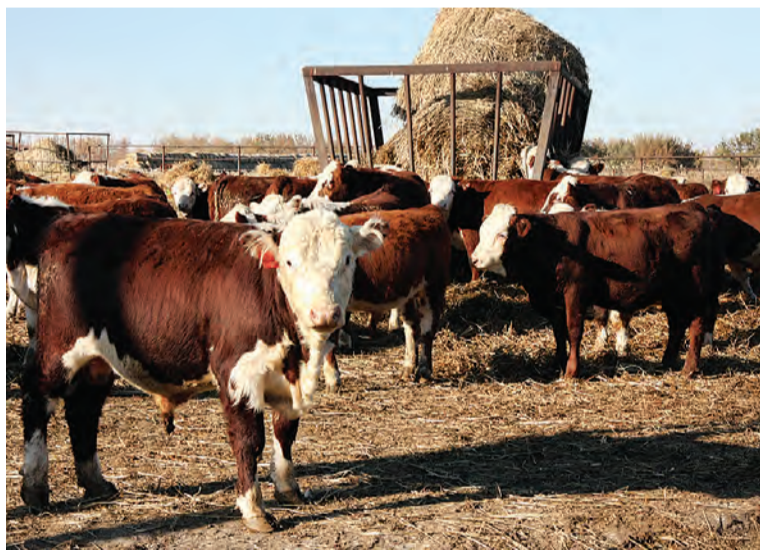
Права реализовывать племенной скот герефордской породы удалось в текущем году ООО «Дружба».