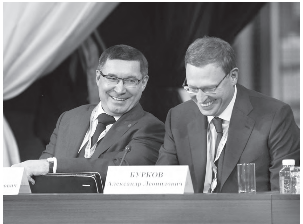
Губернатор Тюменской области Владимир Якушев (слева) и врио Губернатора Омской области Александр Бурков.

– Хочу поблагодарить Нурсултана Абишевича за большой вклад в проведение международных встреч в Астане по Сирии. Во многом благодаря этим переговорам появилась возможность для скорейшего разрешения кризиса в Сирии, достижения самими сирийцами запуска процесса мирного урегулирования, – подчеркнул Владимир Путин.