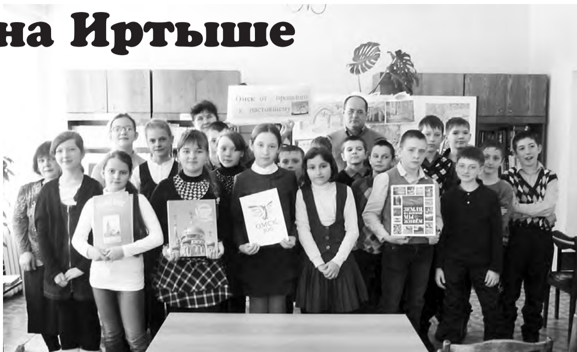
Участники мероприятия, проведенного в Детской библиотеке в честь юбилея Омска.