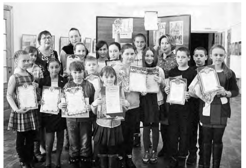
Это их работы украсили выставку, посвященную 300-летию Омска.