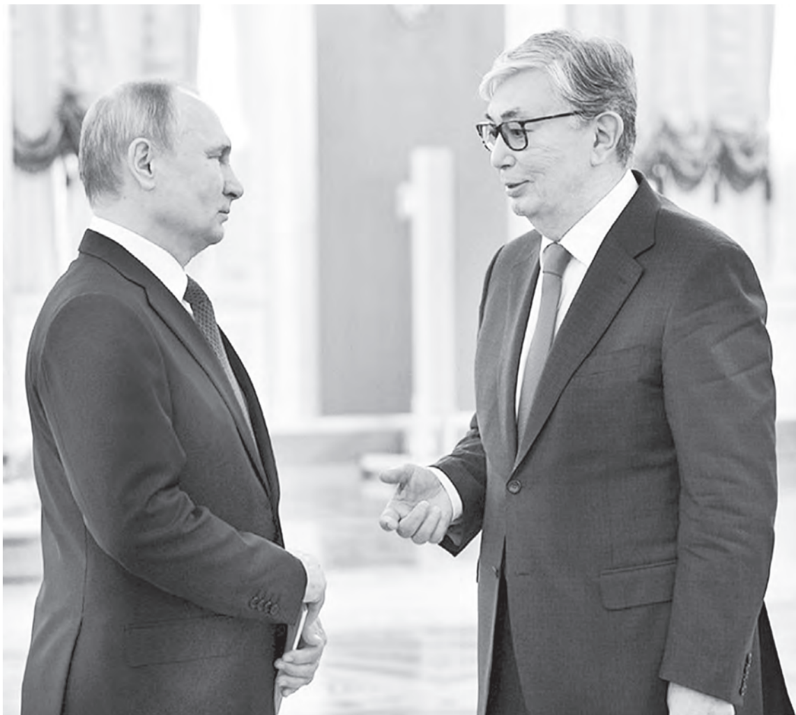
Проведение форума в Омске Владимир Путин и Касым-Жомарт Токаев обсуждали накануне в ходе переговоров о развитии сотрудничества.

Первую панельную сессию, посвященную приграничной торговле с учетом евразийского акцента, курировало Минэкономразвития России. На второй сессии обсудили кооперационные связи в сфере промышленности и технологий. Со стороны Омской области свой опыт в сфере цифровизации нефтепеле-