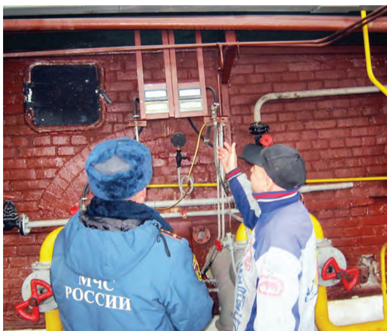
В эти дни в районе проходит акция «Отопление».

ным конструкциям здания (стенам, перегородкам);