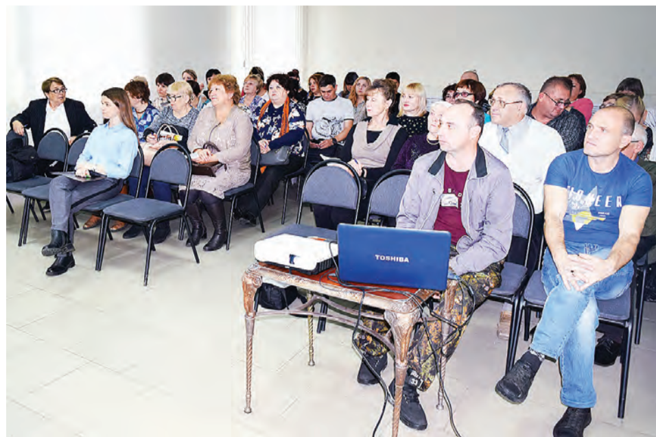
В семинаре приняли участие представители пяти районов области.