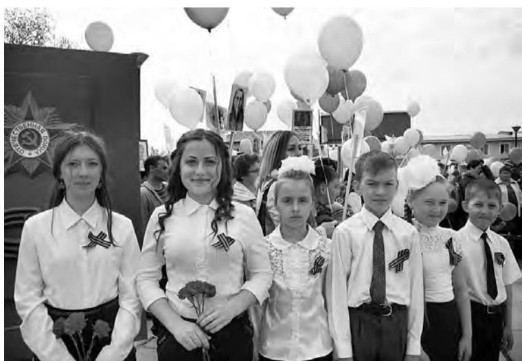
Марьяновка. 9 мая.

Почти 300 тысяч наших земляков ушли на фронт. 152 тысячи омичей героически погибли и навечно занесены в Книгу Памяти. На берегах Иртыша было сформировано 6 стрелковых, две кавалерийские дивизии, добровольческая стрелковая бригада, отдельная морская стрелковая бригада и другие воинские части. Они защищали Москву, насмерть стояли у стен Сталинграда и Севастополя, героически сражались в Курской битве, освобождали Украину, Белоруссию, Прибалтику, брали Берлин. За мужество и героизм на фронтах войны тысячи воинов-омичей награждены высокими правительственными наградами. 172 наших земляка стали Героями Советского Союза и полными кавалерами ордена Славы.