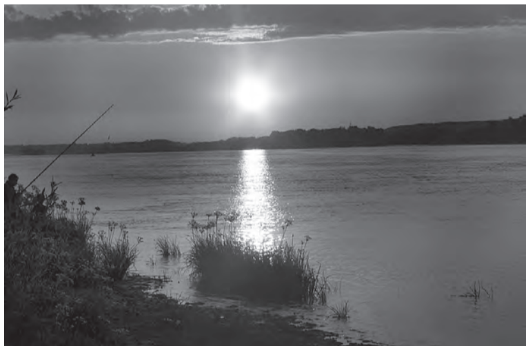
Закат на Старице Иртыша.