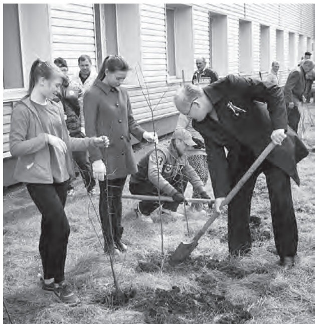
На аллее Победы организаторы и гости турнира высадили 140 диких яблонь.