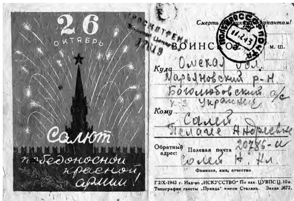
Так выглядела внешняя сторона стандартного письма красноармейца.