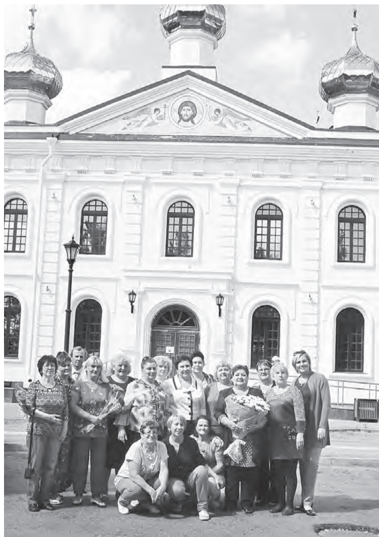
Они представляли Марьяновский район на областном фестивале ретро-шлягера.

Омской области был приурочен областной фестиваль ретро-шлягера «В ритмах нашей юности», который прошел в минувшую субботу на сцене Областного дома ветеранов. Участие в нем приняли 170 конкурсантов.