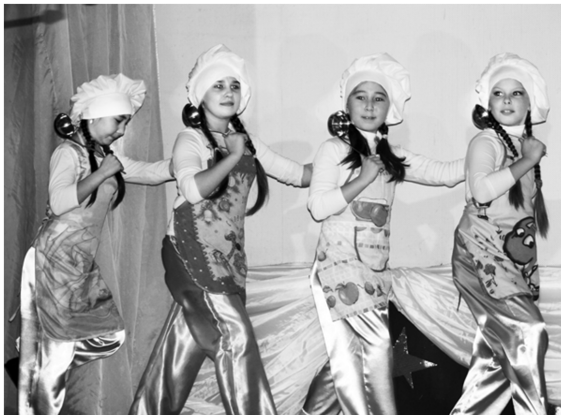
Ну очень веселые голенковские «поварята».