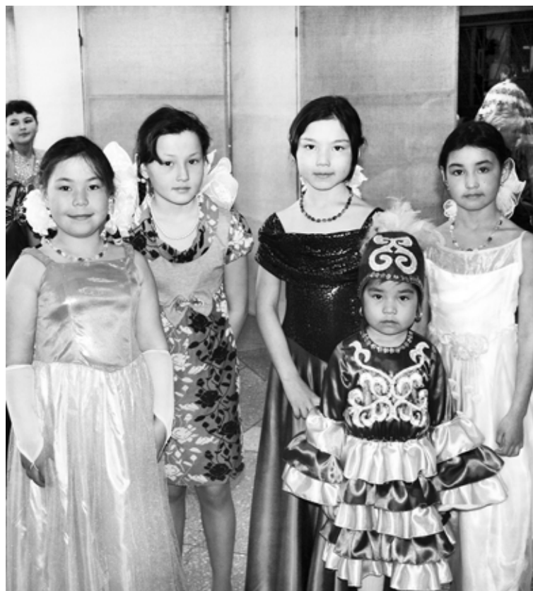
И красивы, и талантливы домбайские девчата.