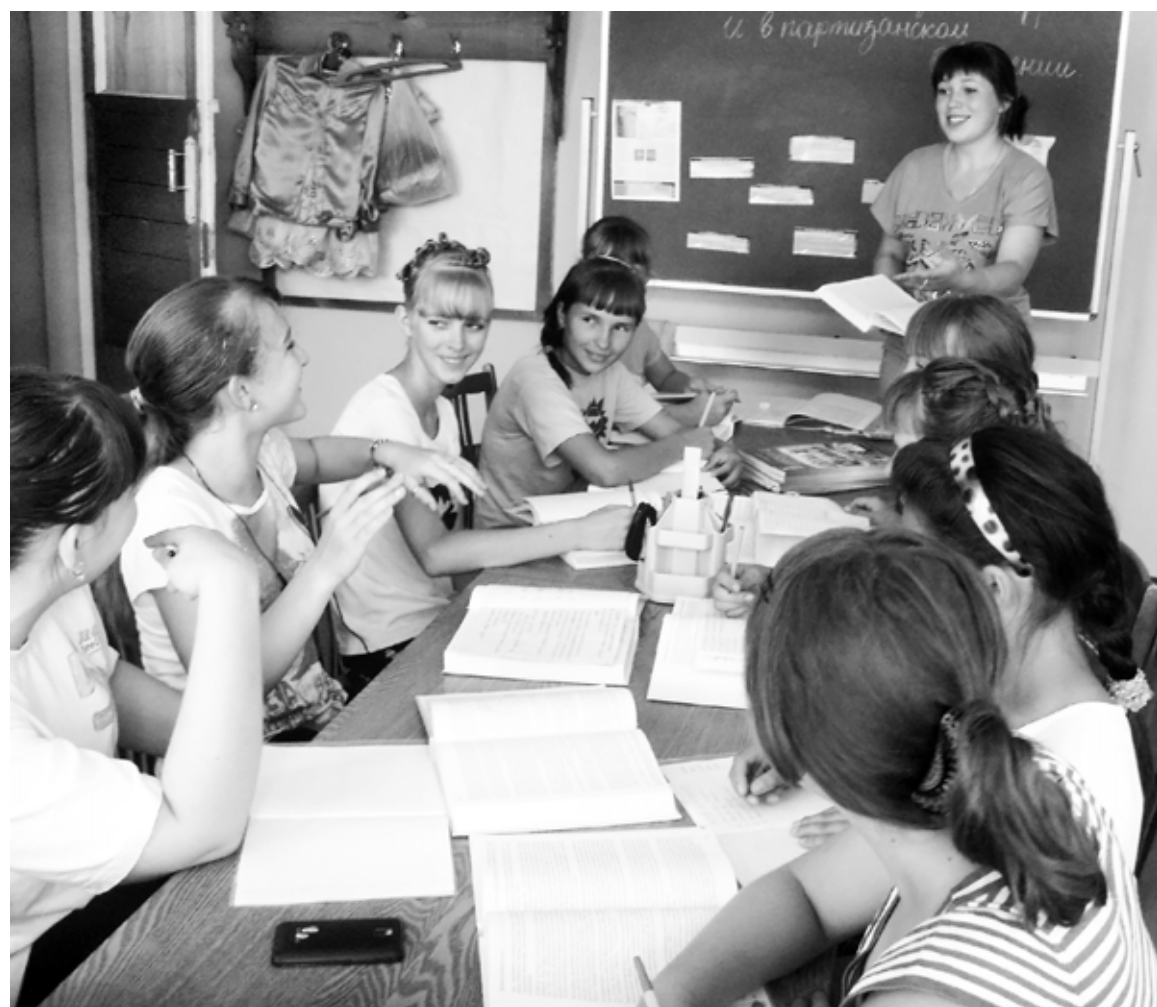
Занятие с детьми в Шараповском Центре немецкой культуры.