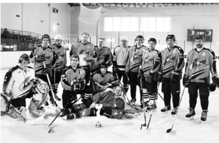
Они защищали честь Марьяновки.