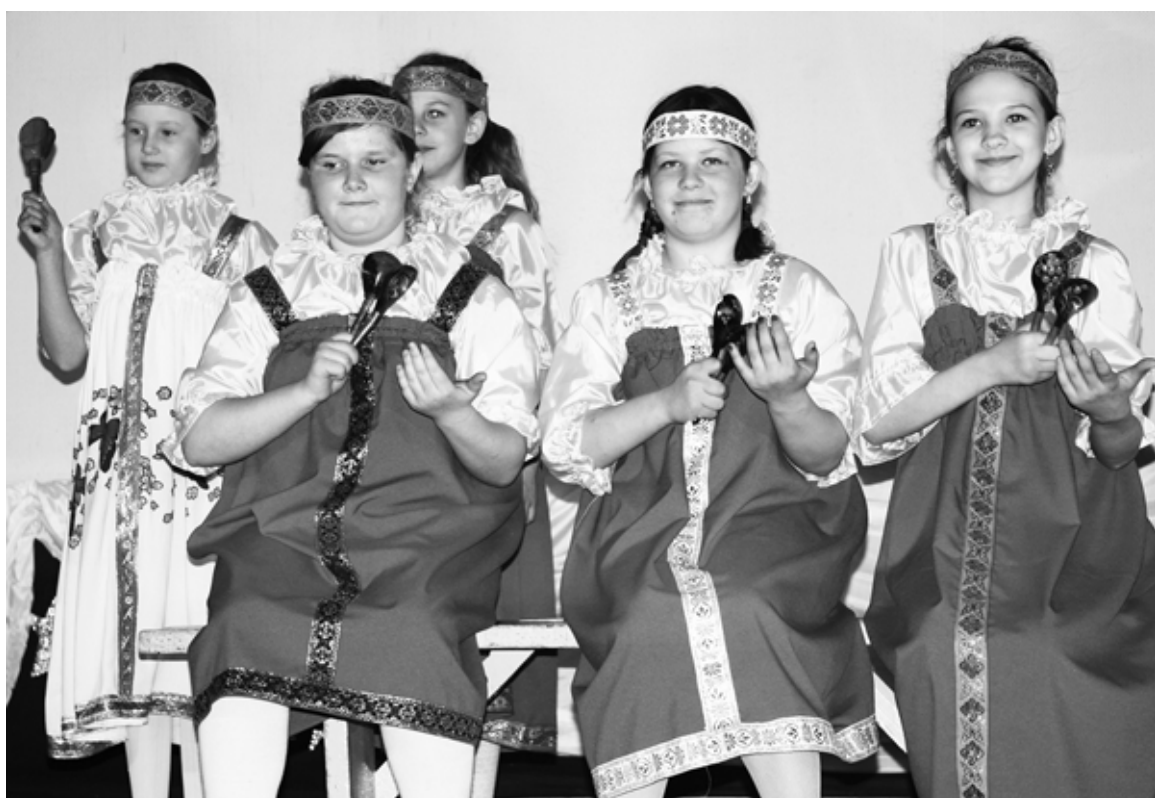
Ох, и славные «Потешки» из п. Москаленский.