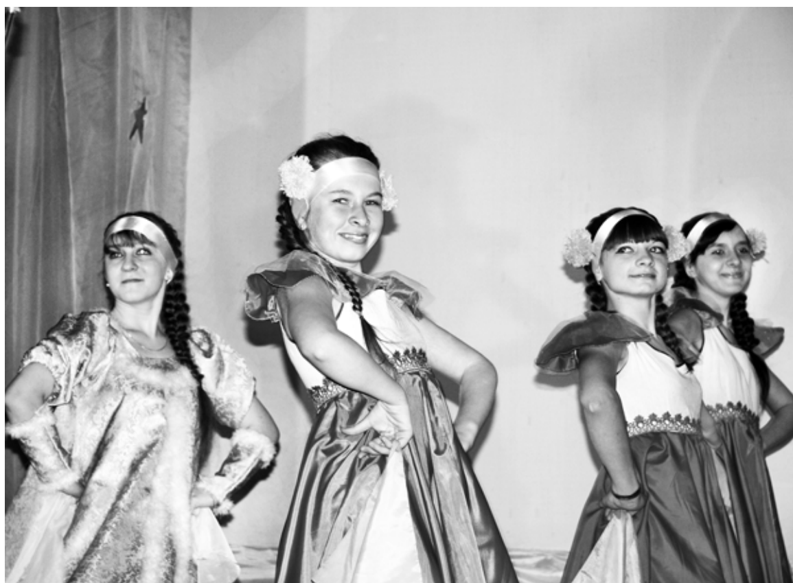
Лихо танцует шарповский «Престиж».