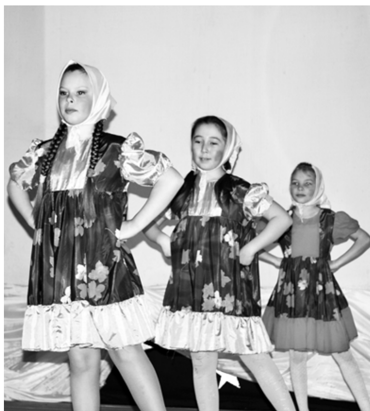
Они такие заводные, «Матрешки» из Голенков.