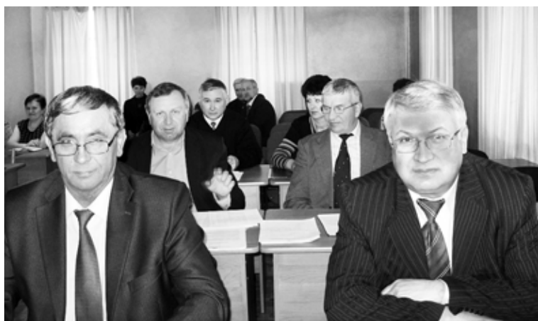
Идет очередное заседание Совета.

Работа Совета депутатов осуществляется на основании перспективного плана, который предусматривает нормотворческую деятельность по дальнейшему формированию и совершенствованию нормативно-правовой базы в области социальной, экономической, бюджетной политики и осуществление контрольных функций за исполнением органами местного самоуправления и их должностными лицами полномочий по решению вопросов местного значения.