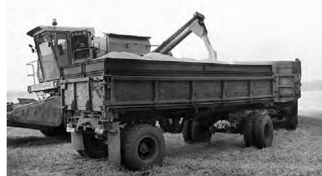
Сыпется пшеницы твердого сорта «Омский корунд».