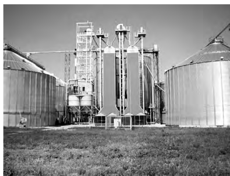
Запущенный в сентябре завод по переработке масличных культур в Таврическом районе открыл новые перспективы развития для аграриев области.

Определен перечень проектов в агропромышленном комплексе, направленных на решение задач импортозамещения, для того, чтобы обеспечить их максимальную поддержку, в том числе за счет федеральных ассигнований, объем которых Правительство России намерено значительно увеличить в самое ближайшее время. Единственное направление, по которому мы еще зависим от других регионов – это плодоовощная и фруктово-ягодная продукция. Основной канал ее поставки – Средняя Азия. Исключить сезонные перебои предполагается путем создания несколь-