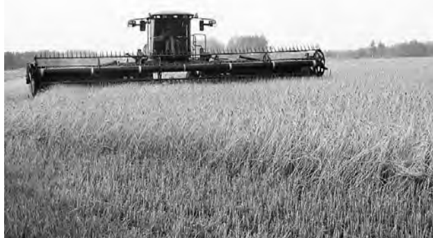
Ох и хороша в деле свальная жатка «Джон Дир»!