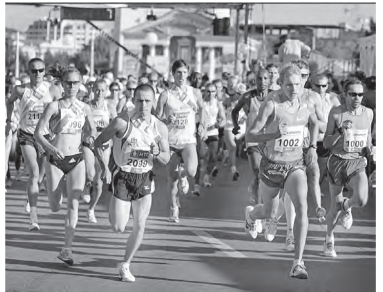
11 тысяч спортсменов из 16 стран и 19 регионов России вышли на старт XXV Сибирского международного марафона.

Следующий год и первая половина 2016 года завершают подготовительный период встречи 300-летнего юбилея города Омска. 3 сентября Председателем Правительства Российской Федерации Дмитрием Медведевым подписано распоряжение о внесении изменений в план основных мероприятий, связанных с подготовкой и проведением празднования 300-летия основания Омска. В рамках реализации распоряжения в 2015 году будет закончено строительство детских садов в микрорайоне «Кристалл-2» и по улице Мельничной. Введем в эксплуатацию школу на 550 мест в Пятом микрорайоне и крытый каток с искусственным льдом в Советском округе. Также будет продолжено строительство поликлиники по улице 70 лет Октября, реконструкция Городской детской клинической больницы №3.