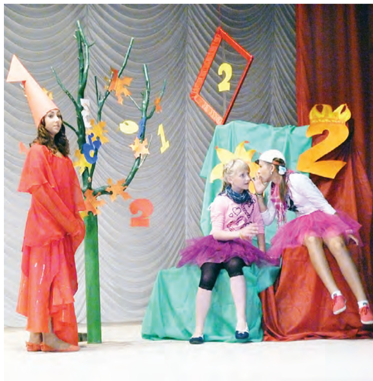
Юные артисты народного театра «Своя версия» в постановке «Королевство невиданных наук».