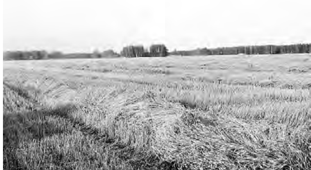
Пшеничные валки ждут обмолота.