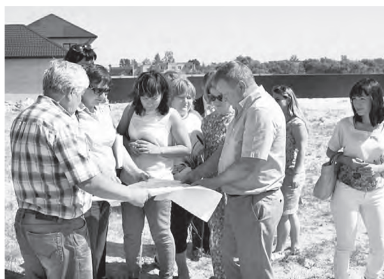
Вопросы бесплатного предоставления земельных участков многодетным семьям для жилищного строительства находятся на постоянном контроле Правительства области.

На постоянном контроле находятся вопросы бесплатного предоставления многодетным семьям земельных участков для жилищного строительства. В 2014 году разработан правовой механизм восстановления в очереди для получения земли в связи с утратой статуса многодетной семьи по возрастным критериям. Многодетным семьям уже бесплатно предоставлено в собственность более 1300 земельных участков, до конца года планируется предоставить еще порядка 100. В 2015 году очередь сократится не менее чем на 550 семей. При этом в Омске по-прежнему остается проблема обеспечения этих земельных участков инженерной инфраструктурой. Сегодня Правительством области совместно с администрацией города Омска принимаются меры для ее решения. Начато проектирование коммуникаций для пяти земельных массивов. В 2015 и 2016 годах на строительство инженерных сетей и сооружений планируется направить более 630 миллионов рублей из средств федерального и регионального бюджетов.