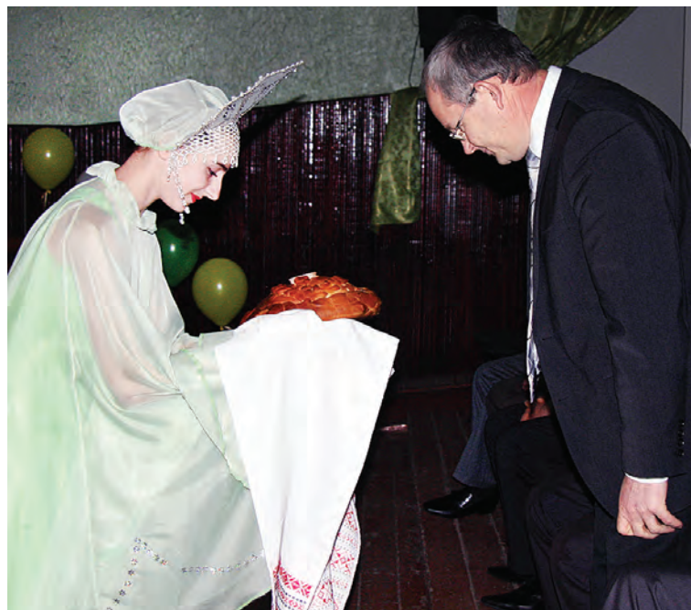
Поклонись хлебу русскому, поклонись до земли...