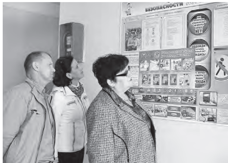
Большой интерес у гостей Конезаводской средней школы вызывает уголок по безопасности дорожного движения.

Жители Омской области смогут сообщить имеющуюся информацию о незаконном обороте наркотиков, либо получить консультации специалистов по телефону доверия УФСН России по Омской области 53-13-63, (официальный интернет-сайт www.gpk.omsk.ru). А также обратиться по вопросам лечения и реабилитации в БУЗОО «Наркологический диспансер» по телефонам 30-27-27, 53-94-83. Все звонки анонимны, телефоны работают в круглосуточном режиме.