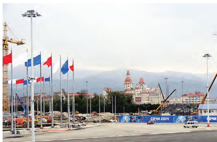
В Олимпийской деревне заканчиваются работы по благоустройству.