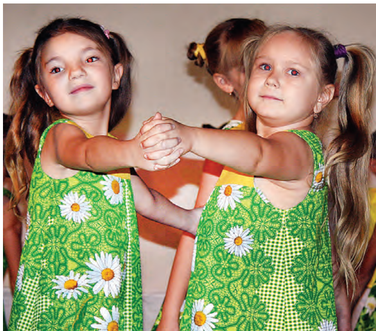
Самые лучшие поздравления - поздравления от детей.