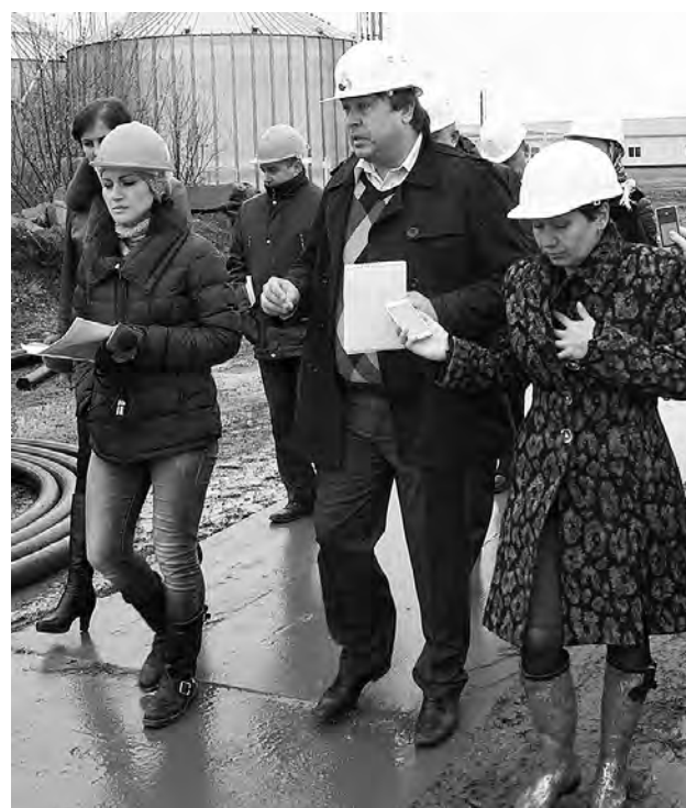
Журналисты на территории завода по переработке масличных культур.