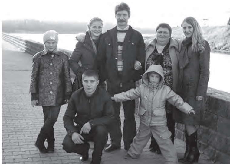
Семья Габеркорн из Шарাপовского поселения.

Низкий поклон всем матерям! Желаем вам гордиться своими детьми и видеть их ответную любовь и нежность. Будьте здоровы и счастливы!