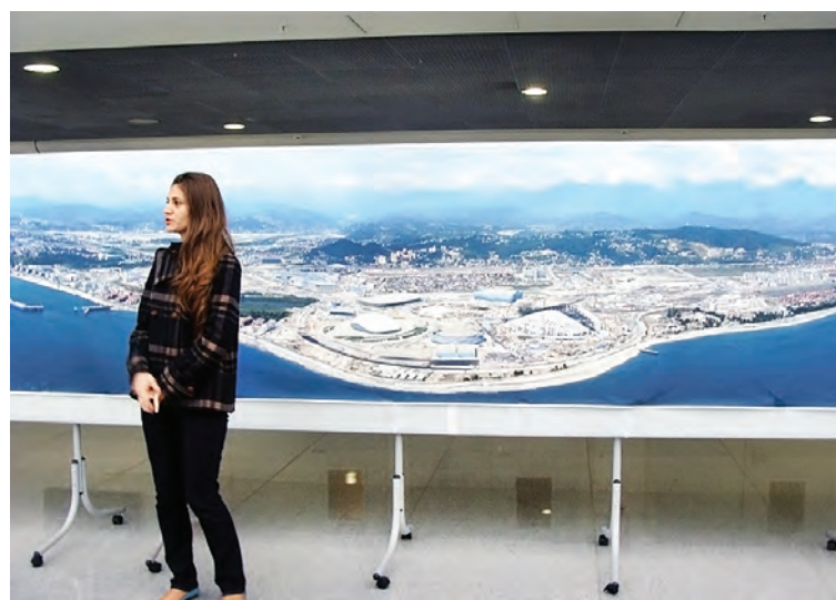
Так выглядит Олимпийский парк с высоты птичьего полета.