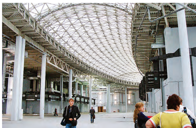
Аккредитованных на Игры журналистов примет крупнейший в мире медиацентр.