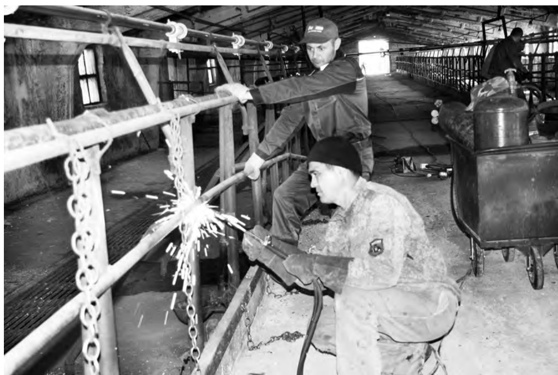
Фрагмент ремонтных работ в помещении дойного гурта.