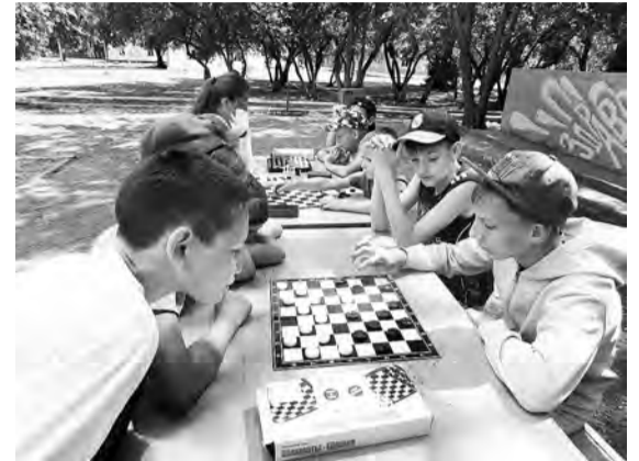
И за шашками было интересно посидеть...