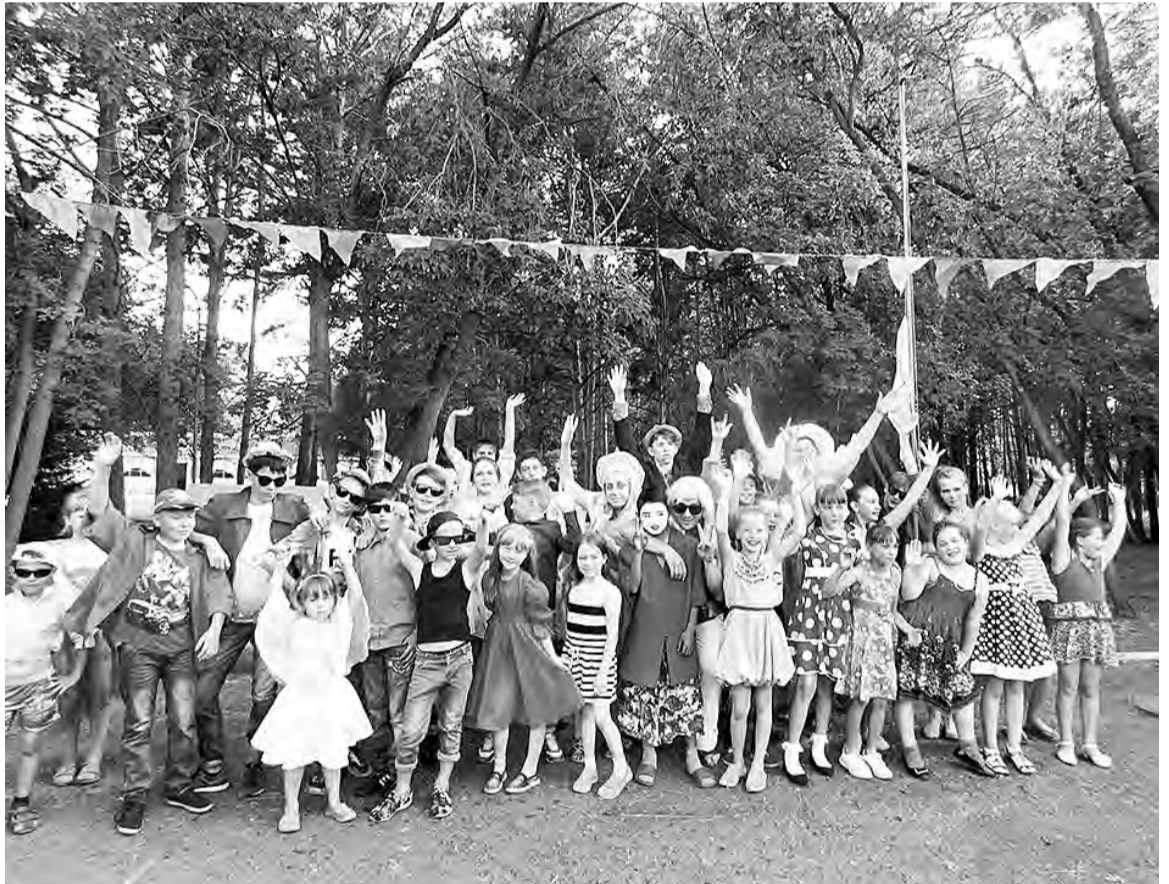
Как здорово здесь было отдыхать...