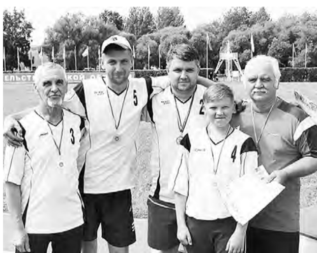
У дружной команды городошников второе место в области.