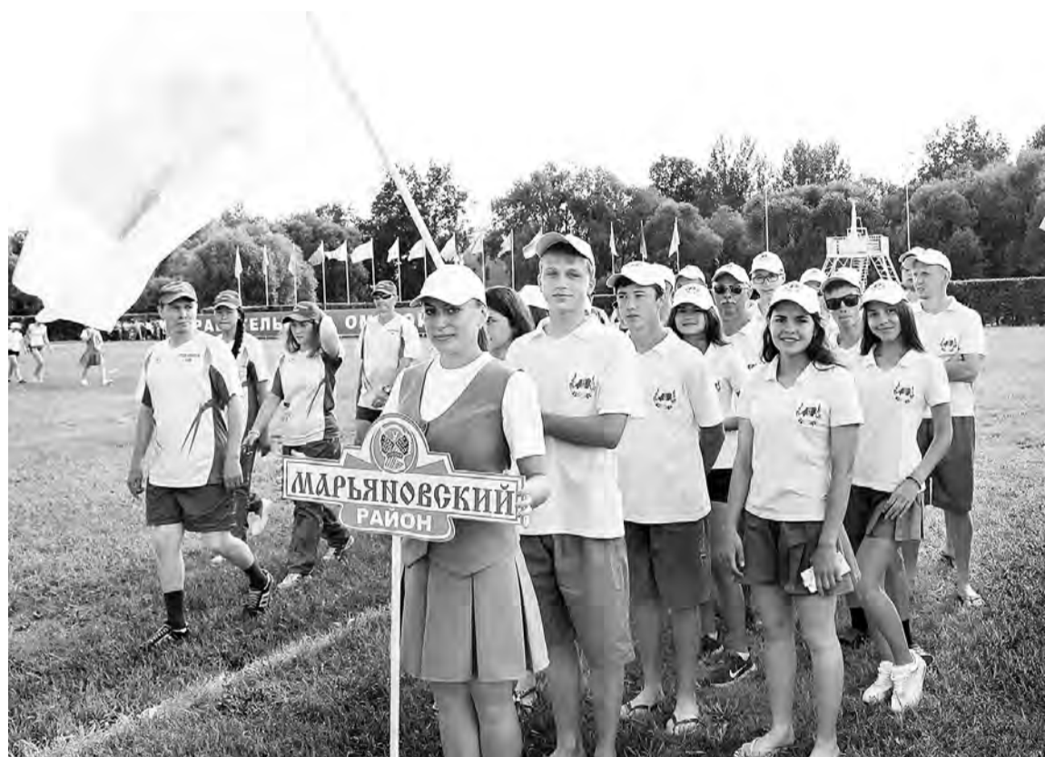
Сборная марьяновцев в момент открытия «Королевы спорта» в Нижней Омке.