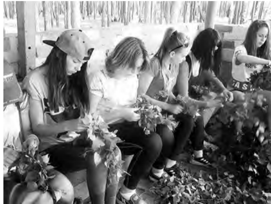
Мастер-класс по плетению веночков.