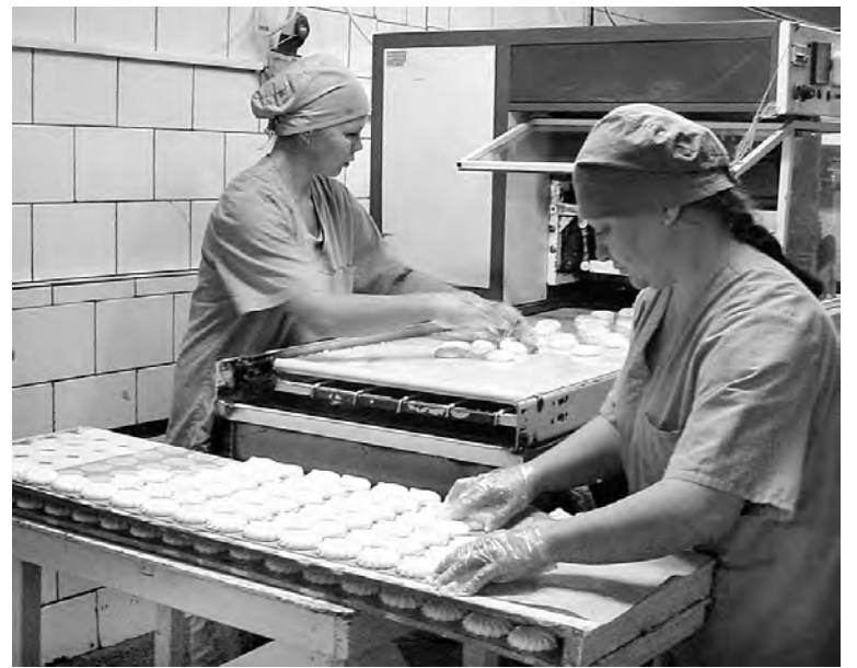
Линия глазировки зефира в действии.