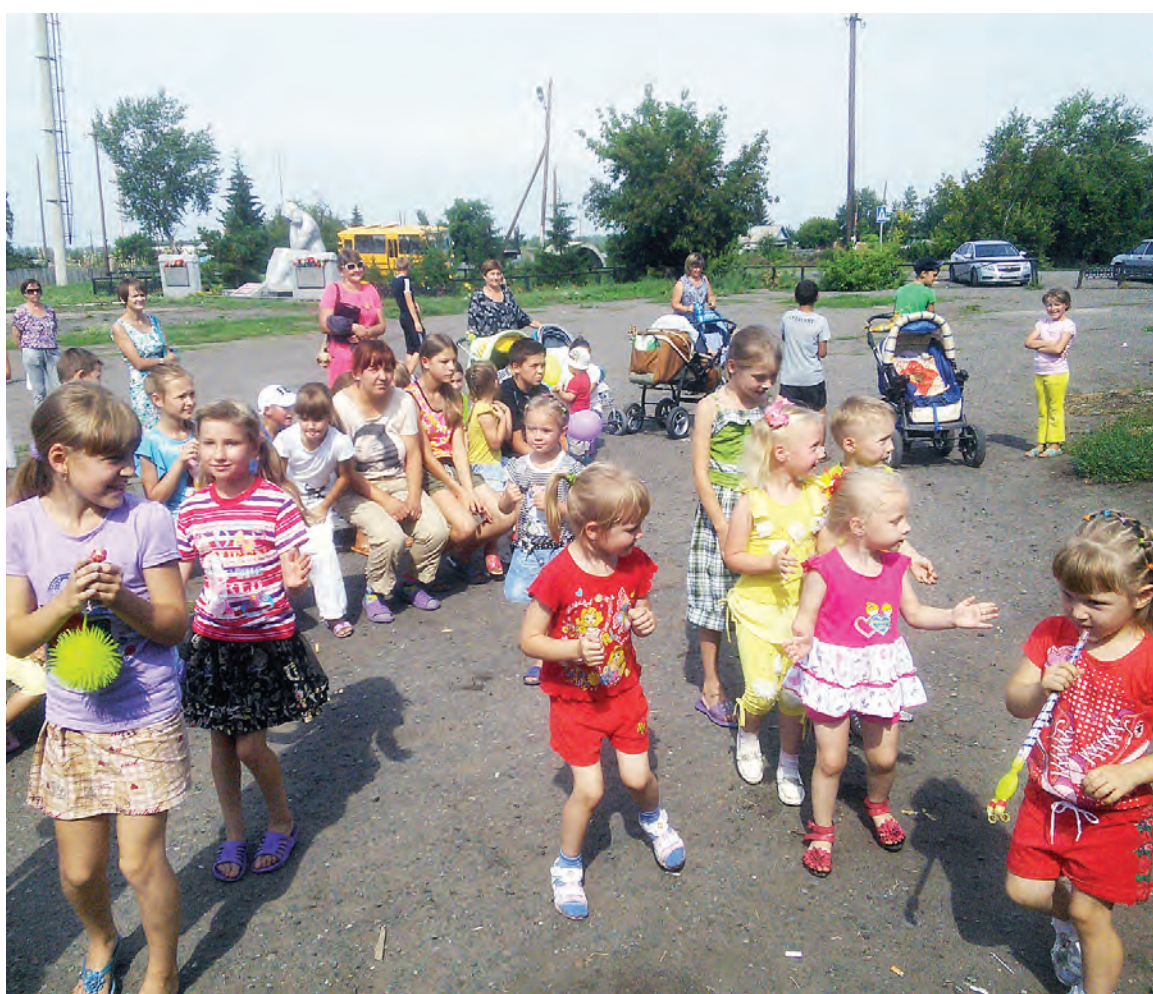
Игровая программа праздника для малышей.