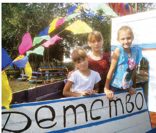
Девочки из Малой Степнинки приехали на открытие площадки.