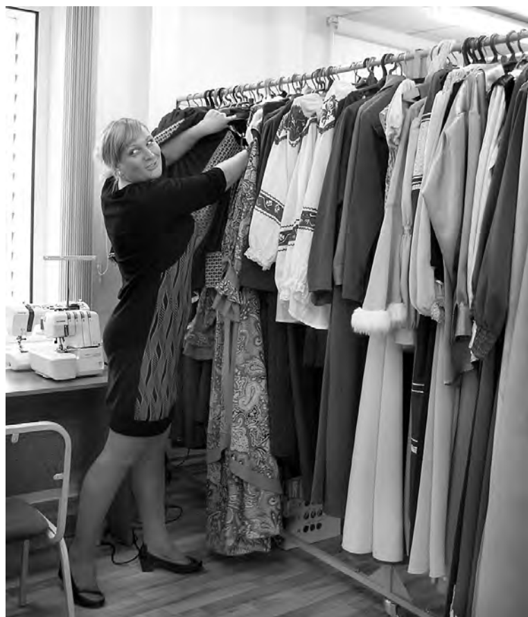
В костюмерной районного ДК.

клубов по интересам, ранее успешно функционировавших. К примеру, литературно-музыкальную гостиную для любителей романса, классической музыки. И это направление своих слушателей не растеряло. Для этого в Доме культуры предусмотрен малый зал, где будет заниматься народный театр «Романс». В таком клубе