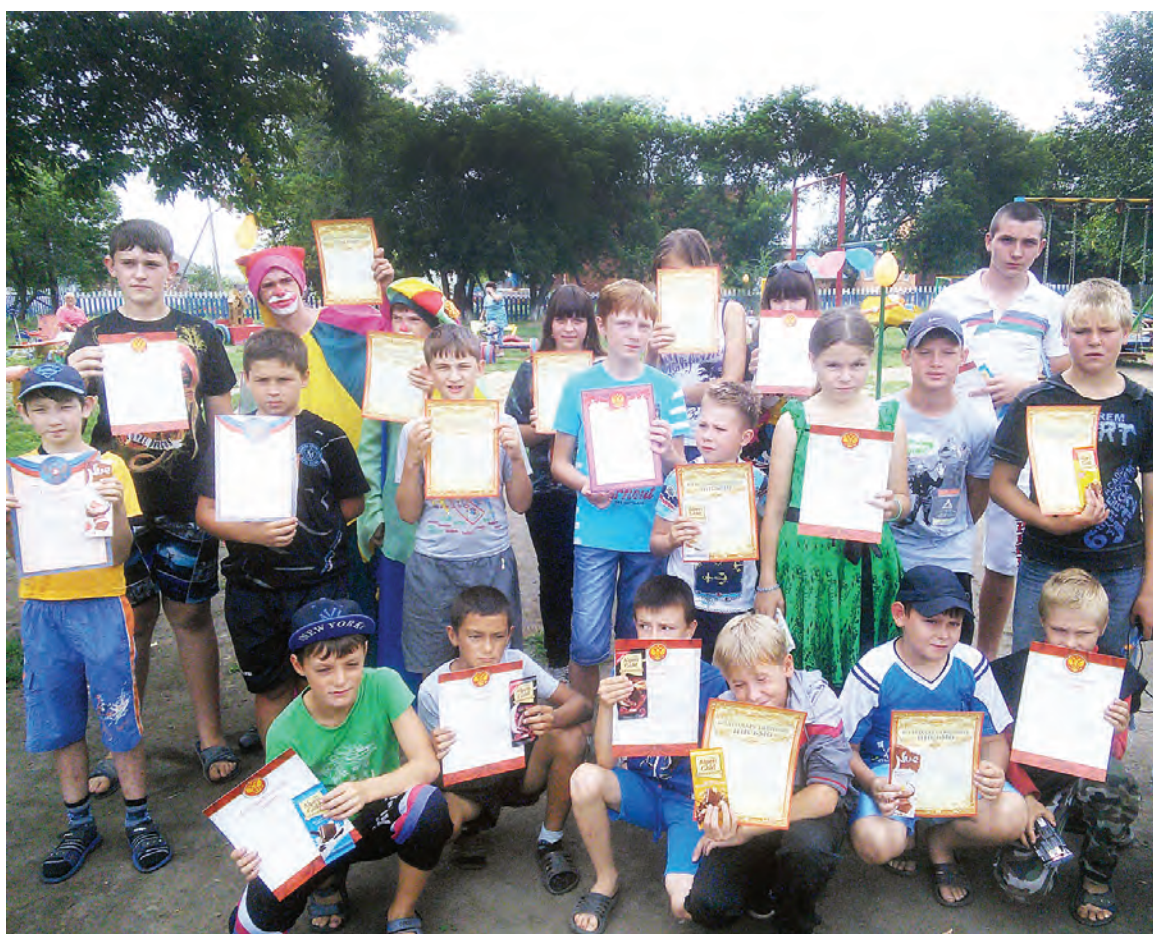
Юные участники строительства площадки получили награду за свой труд от главы поселения.