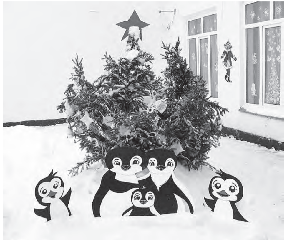
Фрагмент оформления территории Дома-интерната.

За участие в его подготовке и проведении отмечены Благодарственными письмами директор БСУСО «Марьяновский