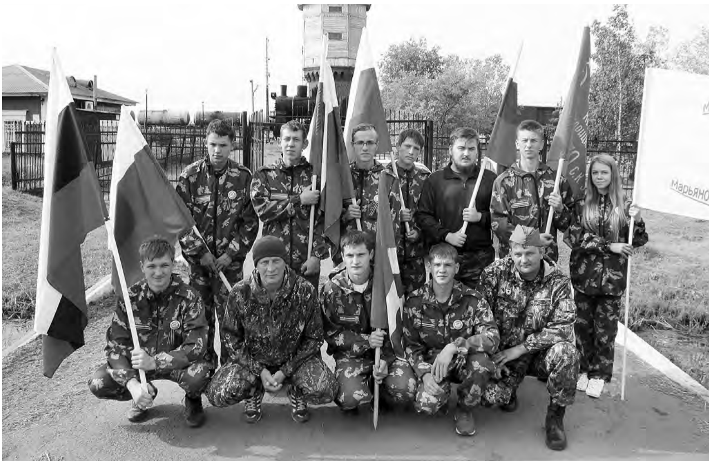
Активисты клуба «Патриот» из п. Москаленский.