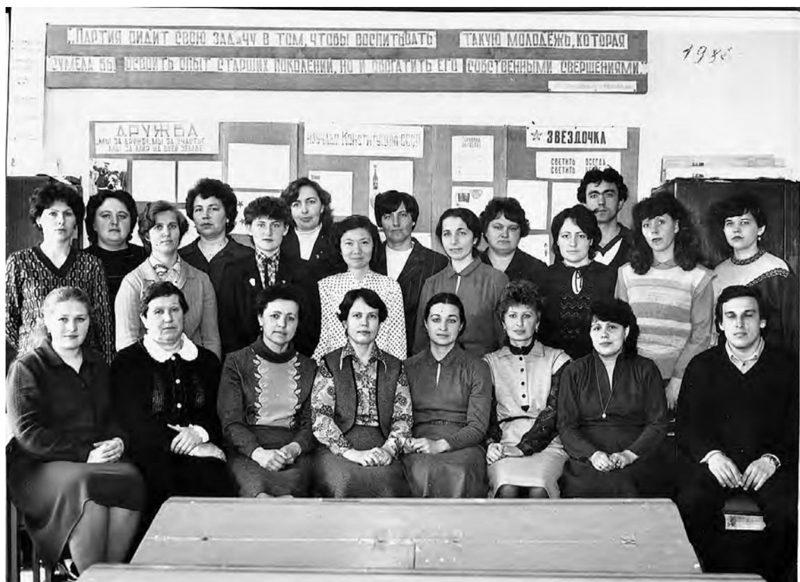
Педагогический коллектив школы в 1985-1986 учебном году.

Она – одна из ведущих школ района, за 40 лет выпустила более тысячи учащихся, из них 25