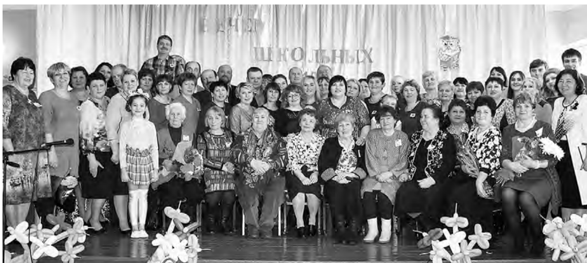
Участники юбилейного мероприятия в Марьяновской средней школе №2.