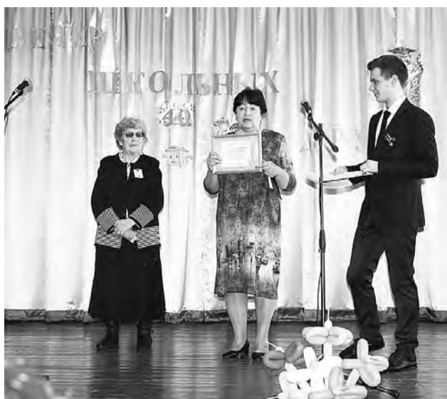
Школе вручен подарочный сертификат от комитета по образованию.