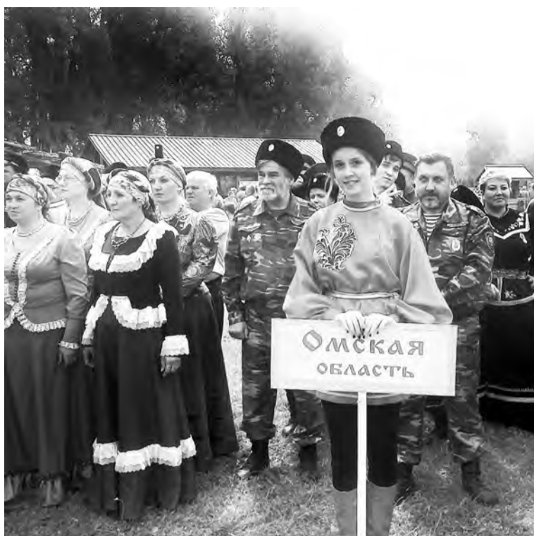
НА КОНКУРС: «ЛЕТО-2016»