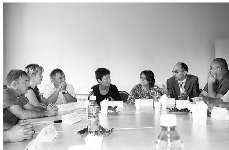
«Круглый стол» на тему реализующихся проектов краеведческой направленности.