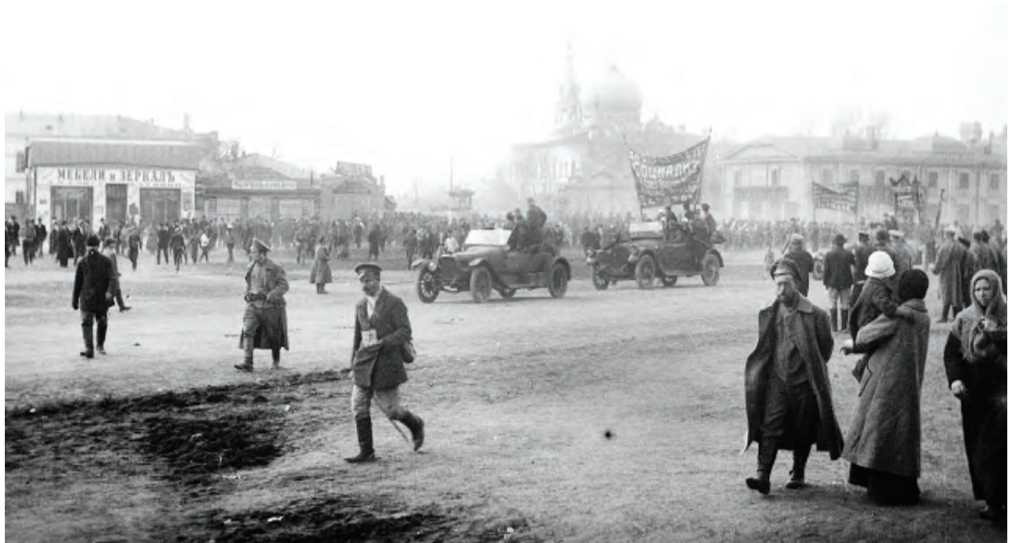
Празднование 1 мая 1918 г. Автомобильная рота на демонстрации.

В марте 1819 г. сибирским генерал-губернатором император Александр I назначил реформатора Михаила Михайловича Сперанского, который по распоряжению царя начал ревизию сибирских губерний, откуда в столицу постоянно шли жалобы на взяточничество и притеснения. Дважды генерал-губернатор побывал и в Омске. Комиссия во главе со Сперанским сделала вывод: срочно менять систему управления Сибирью.