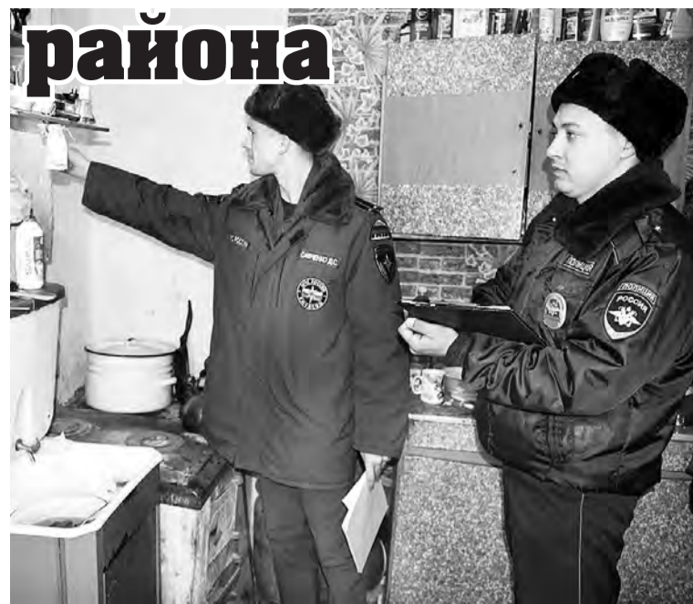
Идет месячник пожарной безопасности с проведением профилактических обследований и обходов жилого сектора.

На территории обслуживания ОГИБДД ОМВД России по Марьяновскому району зарегистрировано 18 дорожно-транспортных происшествий, в которых погибли два человека и получили ранения 27 участников дорожного движения, кроме того, 69 ДТП произошли с материальным ущербом.