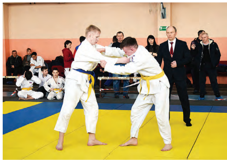
Спортивные турниры - ежегодная традиция в районе.