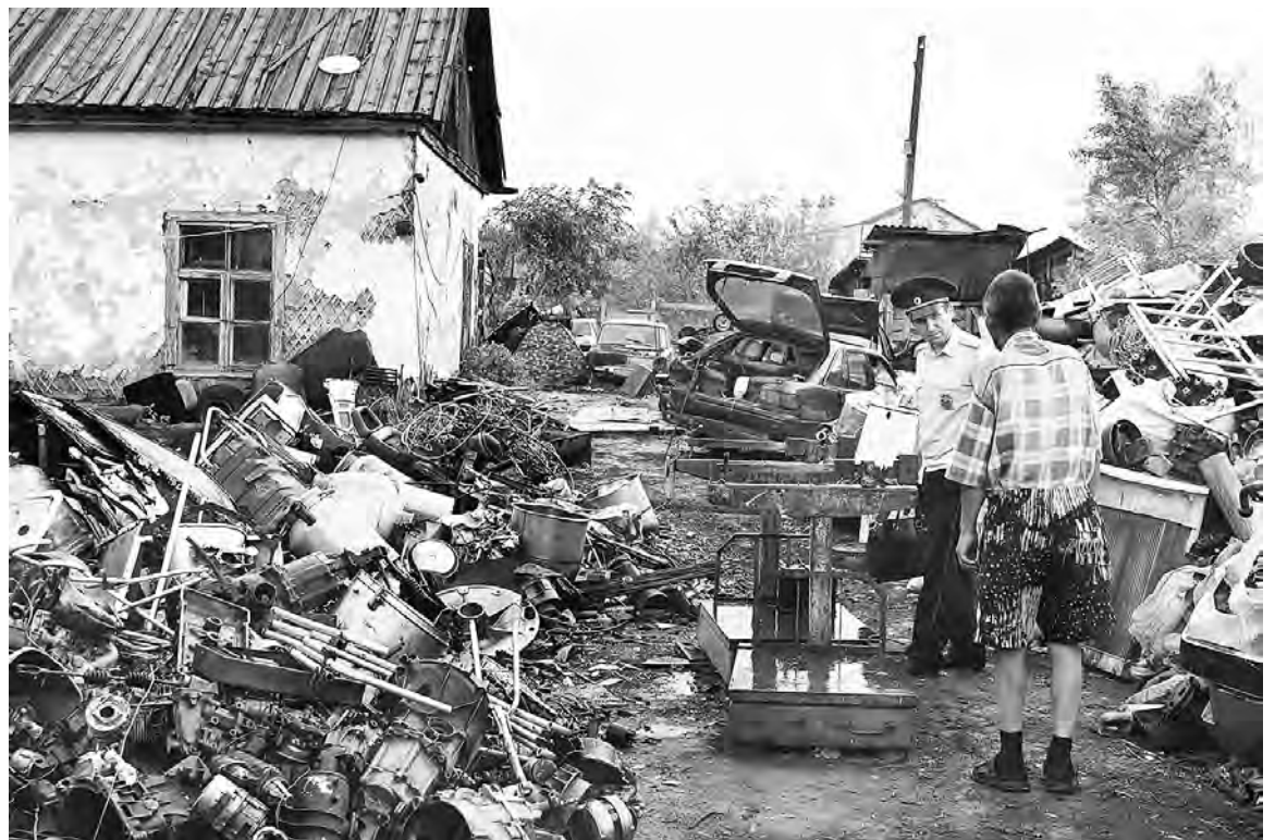
Такую картину увидели участники рейда.

В отношении лица, организовавшего нелегальный прием металла, полицейскими составлен протокол по статье 14.26 КоАП РФ «Нарушение правил обращения с ломом и отходами цветных и черных металлов и их отчуждения». Статья предусматривает наложение административного штрафа в размере от двух тысяч до двух тысяч пятисот рублей с конфискацией предметов административного правонарушения. Как выяснилось, гражданин ранее уже привлекался к ответственности по этой статье. Решением мирового суда Марьяновского района (судебный участок № 12) в мае этого года ему определено наказание в виде административного штрафа в две тысячи рублей.