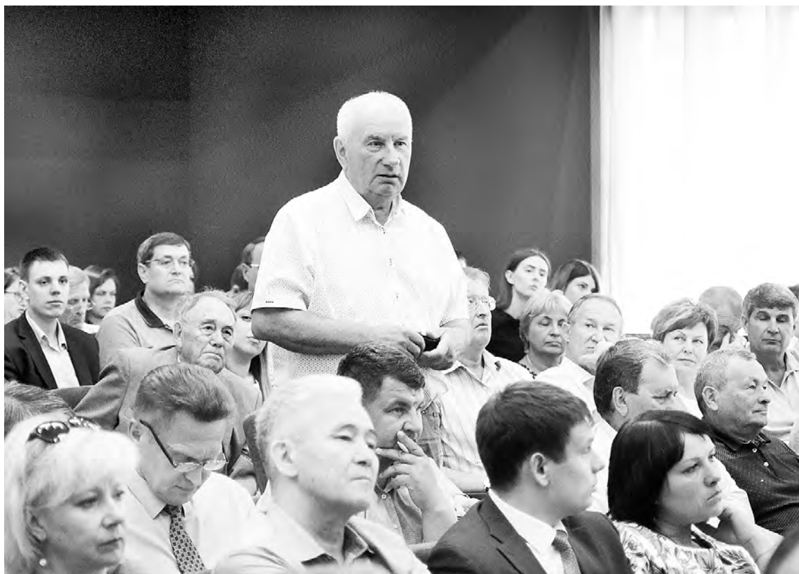
Теперь стратегия развития АПК рождается не в тиши кабинетов, а идет снизу, что называется, «от земли».

13 июля в Омске прошел Экспертный совет по развитию АПК.