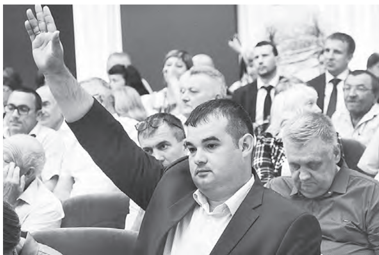
Каждый участник совещания мог высказать свою точку зрения.

Все эти факты свидетельствуют о том, что во время своих рабочих поездок в районы области Бурков не только знакомится с положением дел, но и быстро принимает решения в интересах жителей. И