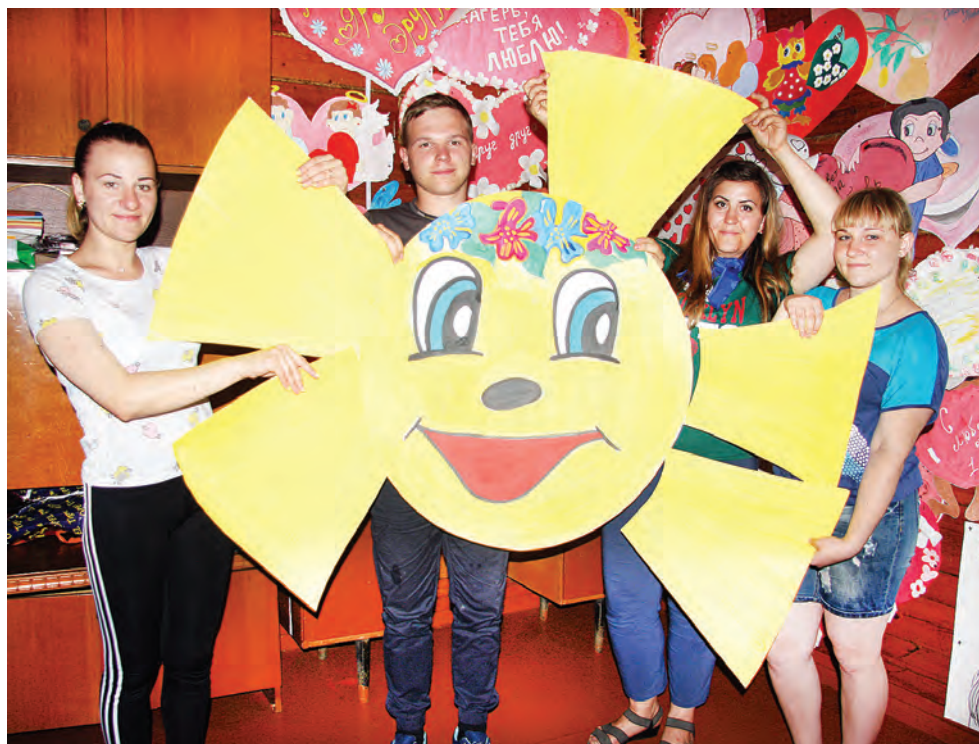
Вожатые дарят детям солнечную улыбку.

Полторы сотни ребяташек, большая часть которых из нашего района, а также из города Омска, Саргатского и Омского районов, отдыхают на первом сезоне в детском оздоровительном лагере имени И. С. Пономаренко.