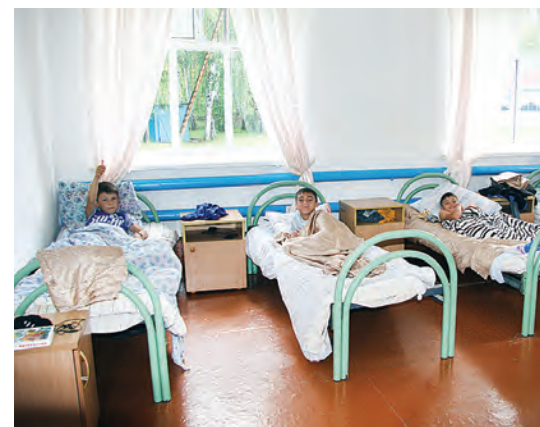
В корпусе новые кровати и тумбочки.