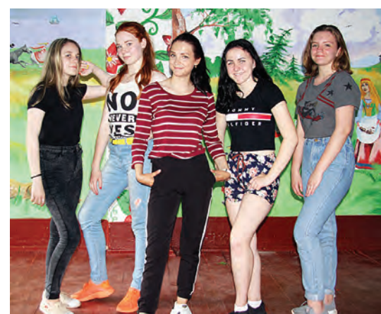
С удовольствием отдыхают в лагере девушки-старшеклассницы.