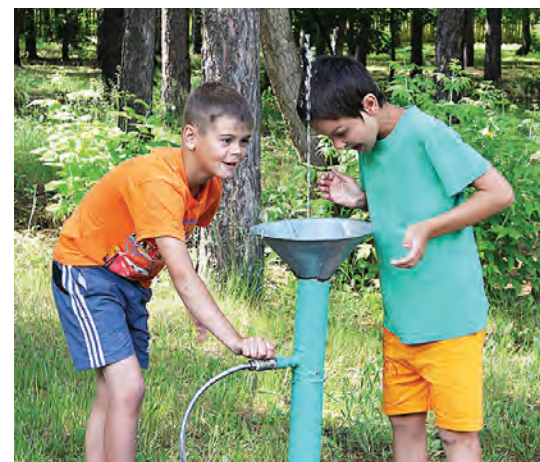
По всей территории установлены питьевые фонтанчики.