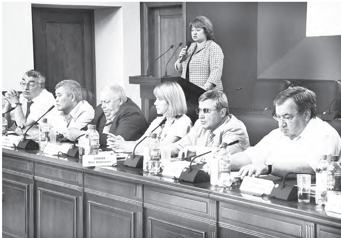
Участники Экспертного совета разработали рекомендации для включения в программу развития отрасли.

Практически вдвое выросли расходы на ремонт и реконструкцию сельских дорог — с 828 млн. до 1 млрд. 540 млн. Почти на треть по сравнению с прошлым годом увеличилось финансирование сель-