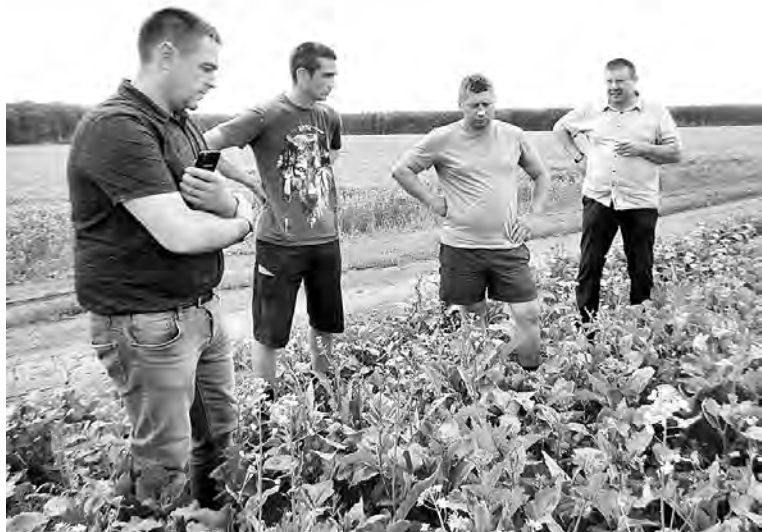
Главные агрономы сельхозорганизаций оценили состояние посевов в районе.