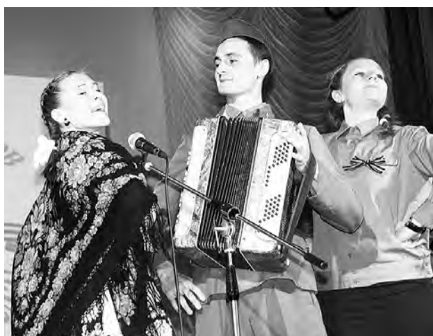
Играй, гальяночка моя...