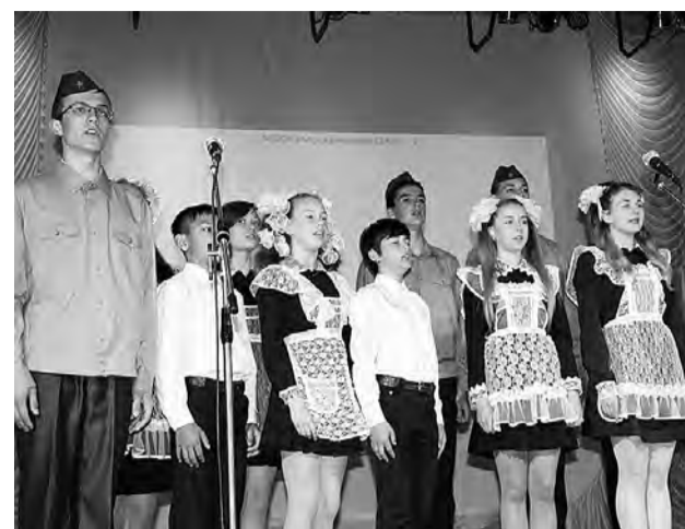
На сцене - Москаленская средняя школа.