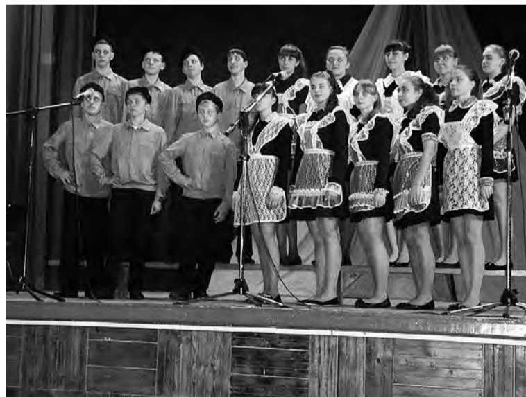
И звучали песни о Победе...