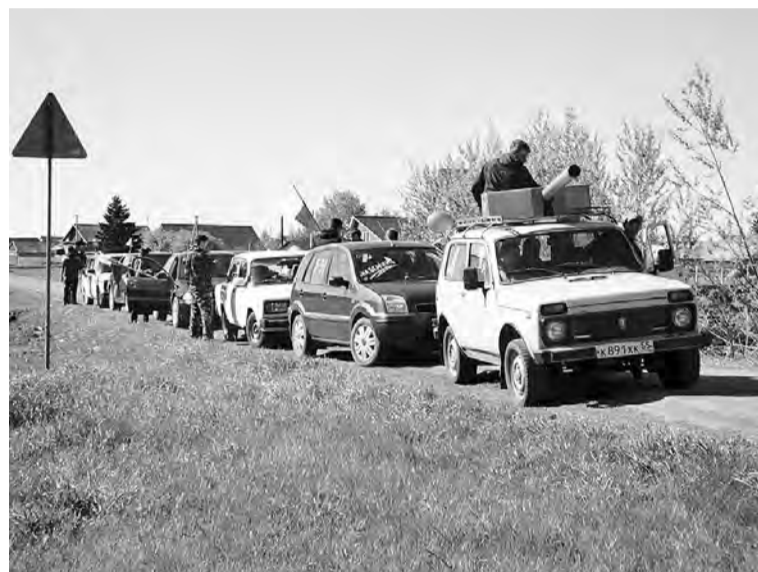
Патриотический автомотори по селу.