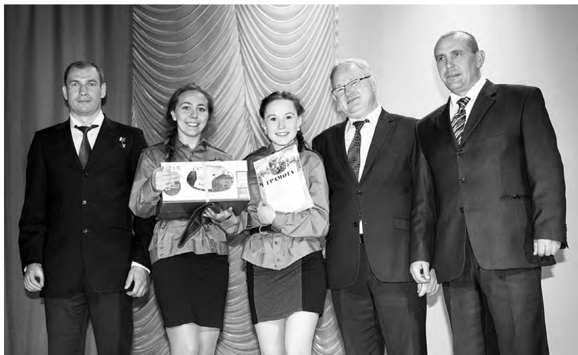
Момент награждения победителей конкурса.

Несмотря ни на какие неувязки, наши конкурсанты сумели передать зрителю эмоции и раскрыть сюжет. Не скрою, зрители плакали во время исполнения этой песни и без видеоряда.