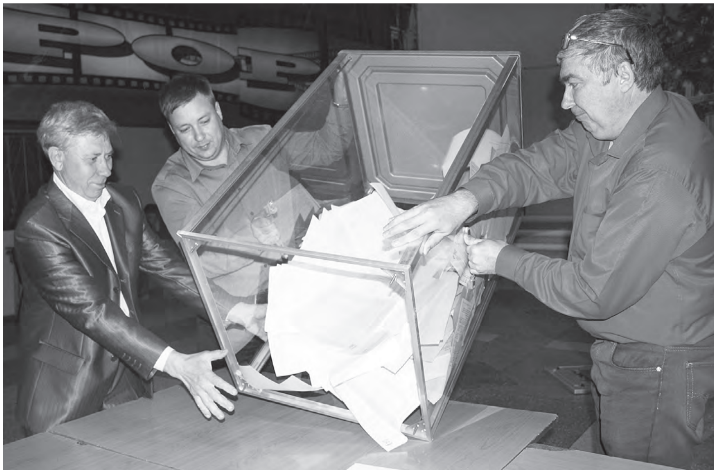
В 20 часов счетный участок в Марьяновке был закрыт. Впереди – подсчет голосов.