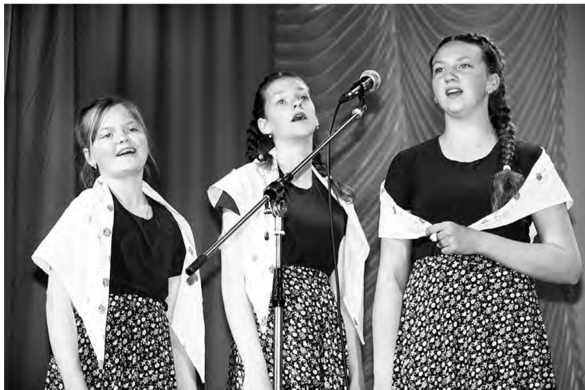
А закаты алые, алые, алые...