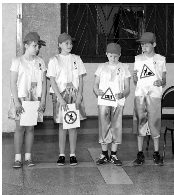
Задание на проверку правил дорожного движения.