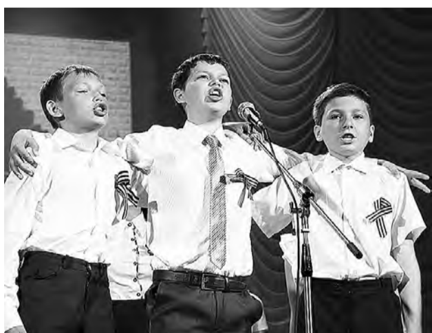
Три танкиста - три веселых друга.