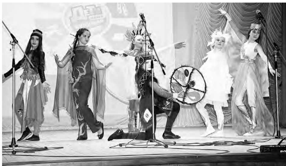
Образцовый театр моды из п. Конезаводский: показ новой коллекции.

Представлялись же на этих творческих форумах новые коллекции одежды: «Хозяйка медной горы», «Модная геометрия», «Четыре стихии». Последние две