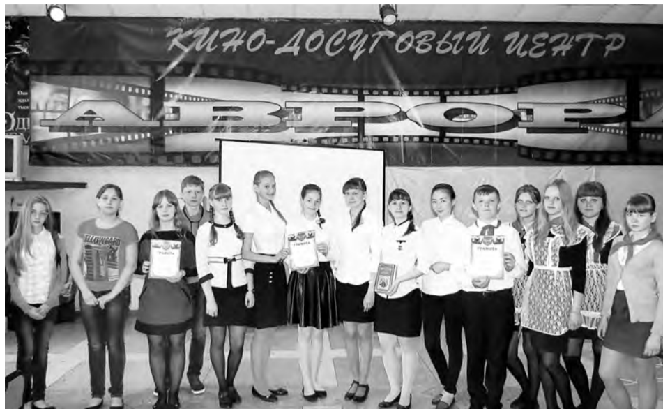
Учащиеся, которые очень хорошо знают историю города Омска.

Ждет Омск юбилей – 300 лет, И досрочно становится краше не только в словах.»