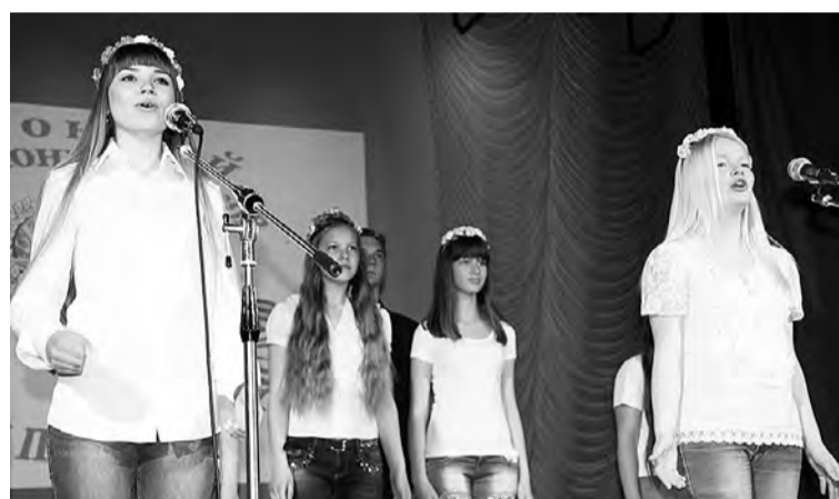
Девчата из села Степное.

На прошлой неделе сцена районного Дома культуры представляла участников районного конкурса хоров «Ликуй и пой, Победа!», посвященного ветеранам-участникам Великой Отечественной войны, а также локальных войн – славным защитникам Отечества.