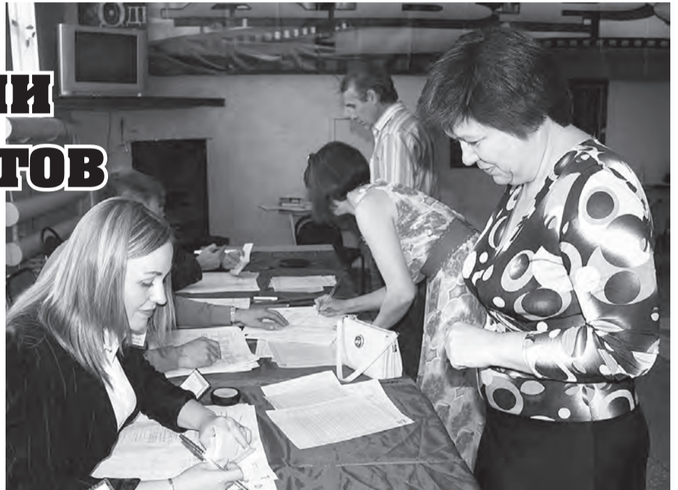
На счетные участки шли семьями.