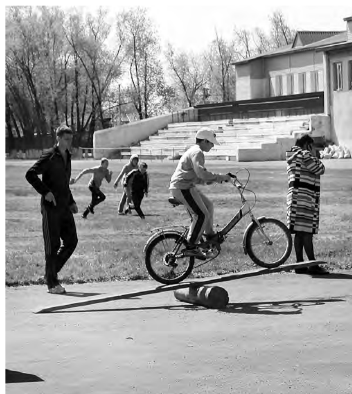
На одном из этапов фигурного вождения велосипеда.