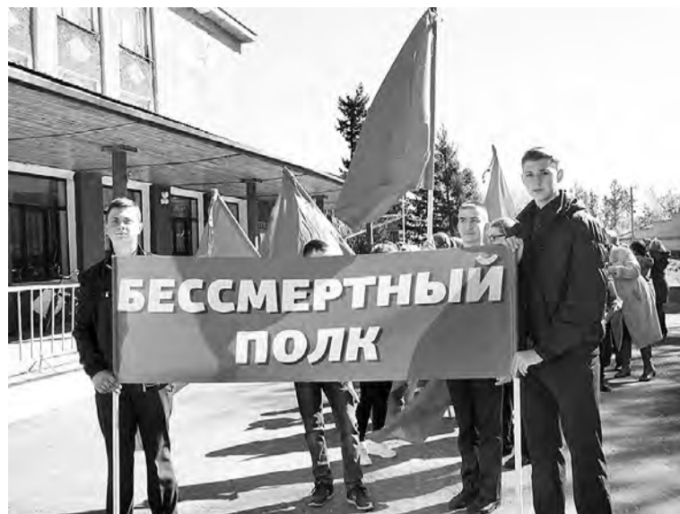
Акция Дня Победы в п. Москаленский.