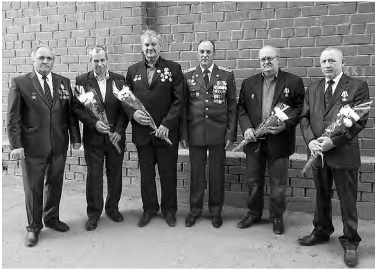
Награжденные марьяновские «чернобыльцы» с представителями областных ведомств.