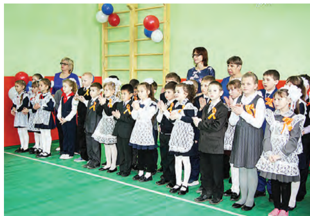
Такому приятному событию радуются и младшие школьники.