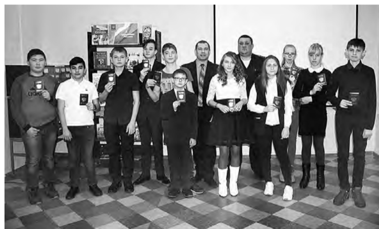
Торжественное событие прошло в рамках Дня Конституции.