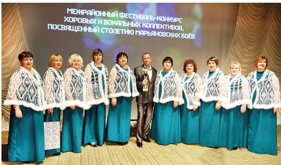
Вокальная группа «Сибиряночка» завоевала Гран-при фестиваля-конкурса.

Надо сказать, что участники фестиваля-конкурса творчески подошли к подготовке своих выступлений. Кадры документальной кинохроники, костюмы, оригинальная аранжировка - все это было использовано в арсенале, но главным, конечно, было яркое, выразительное исполнительское мастерство. И уж поверьте, никто