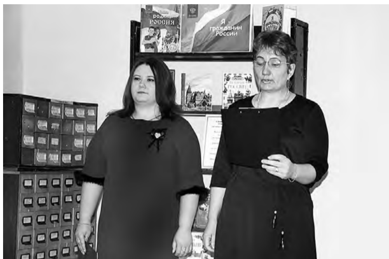
Программу подготовили и провели сотрудники Детской библиотеки.