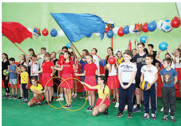
Первое спортивное мероприятие в обновленном спортзале.