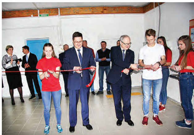
Фрагмент торжественного открытия с участием гостей и учащихся.