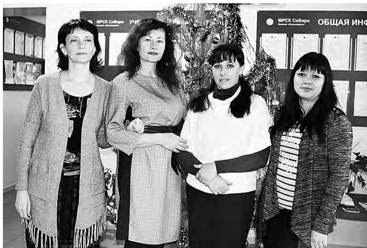
«Мозговой центр» районных электросетей – сотрудницы отдела инженерно-технического контроля.