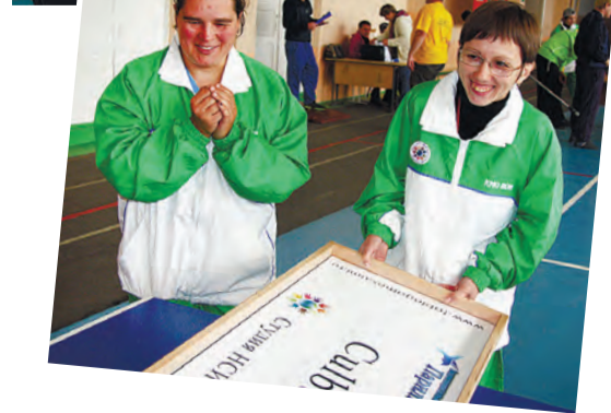
Фрагменты первого областного турнира по настольным спортивным играм.

Еще больше фотографий на нашем сайте gazeta-avangard.ru