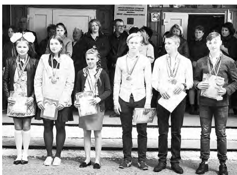
Лучшие спортсмены Москаленской средней школы минувшего учебного года.

Следует отметить, что по окончании учебного года, и тоже традиционно, в Москаленской школе определяют лучших спортсменов. В нынешнем в ней