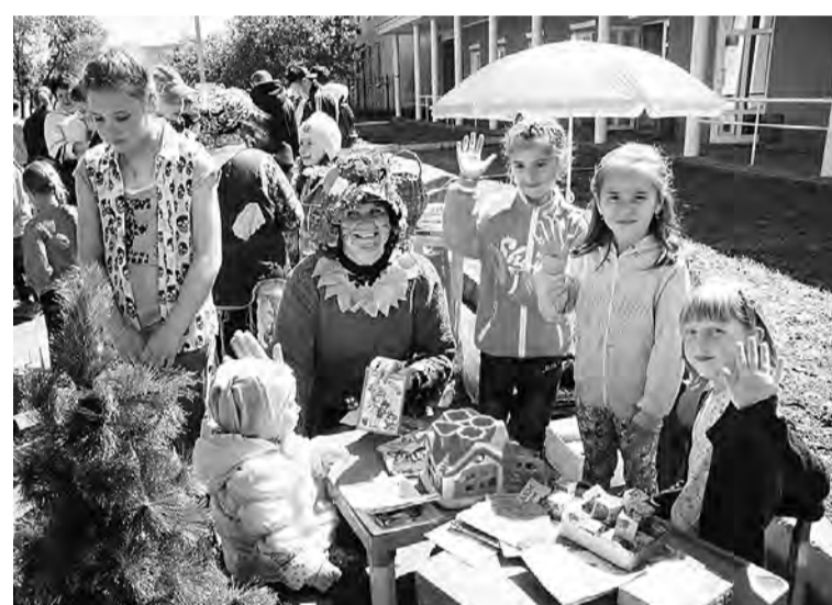
Одна из ярких игровых площадок - библиотечная.

Продолжением же активного июньского отдыха юных марьяновцев стали лагеря дневного пребывания, организованные при каждой средней школе.