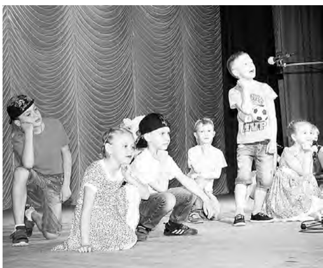
Фрагмент концертного выступления в РДК.