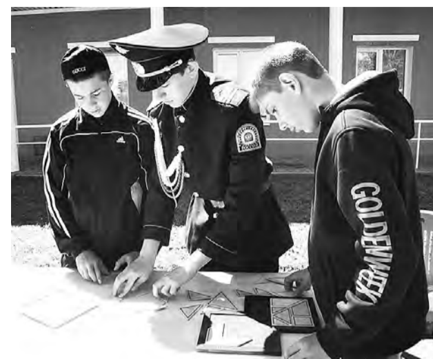
А мальчишек увлекли головоломки.