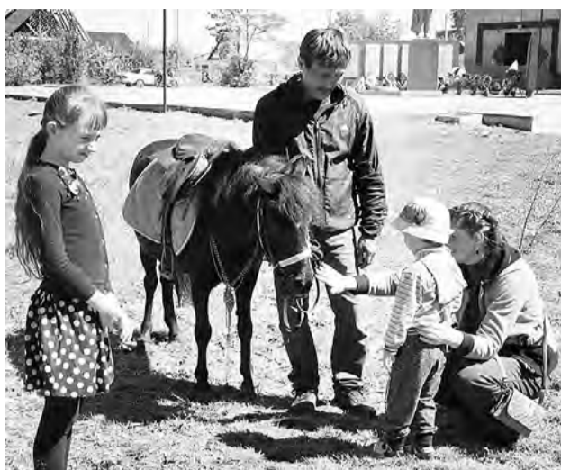
И пони здесь без дела не простаивал...