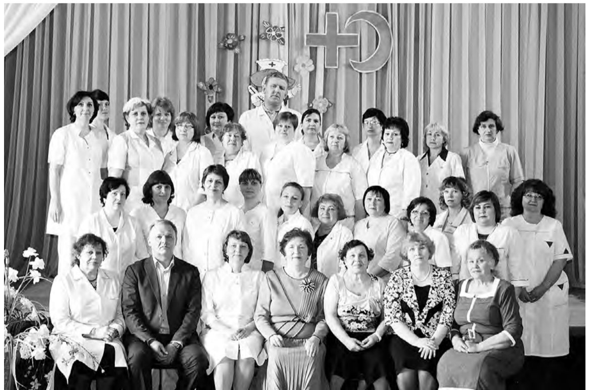
Коллектив медицинских работников Дома-интерната.

Преклонному возрасту свойственны многие психические и физиологические заболевания и рас-