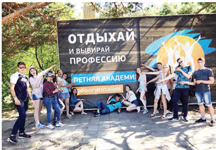
На отдыхе в профильной смене побывали и орловские учащиеся.

В процессе этого продуктивного события - ежедневное общение с представителями профессий «Формула успеха», проориентационные занятия с заполнением карьерного навигатора по методике: «Система 5 шагов», знакомство с омскими вузами, ролевая игра «Путешествие в будущее» - жизненный путь человека в будущем на 15 лет, а еще фестиваль красок «ХОЛИ», дискотека мыльных пузырей, танцевальные батлы, философский театр, вечерки у костра и отрядный «Огонек», где все делились своими впечатлениями за день. И как