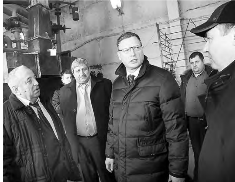
Губернатор Омской области Александр Бурков считает первоочередной задачей власти своевременно обеспечить подачу тепла.

Пожары традиционно происходили чаще всего в жилом секторе. Основные причины возникновения возгораний – неосторожное обращение с огнем. «С наступлением зимы возможен всплеск пожаров