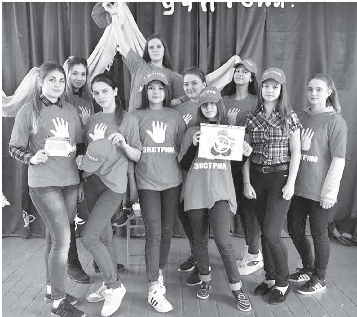
На счету волонтерского отряда из Москаленского поселения много хороших дел.