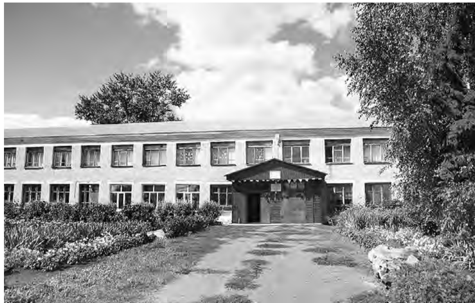
К своему очередному учебному году Орловская средняя школа заметно преобразилась.

Мы всегда гордимся тем, что в нашей школе до 50 процентов учителей - ее выпускники.