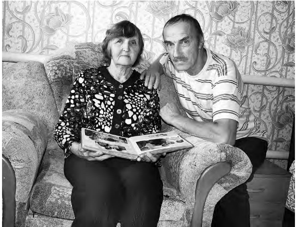
Любящие друг друга и счастливые, как и 45 лет назад.

- Мне иногда казалось, что ей доверяю больше, чем даже маме... До такой степени она всех нас знала, чувствовала... Сколько душевных бесед на классных часах с нами она проводила! К внеклассной работе