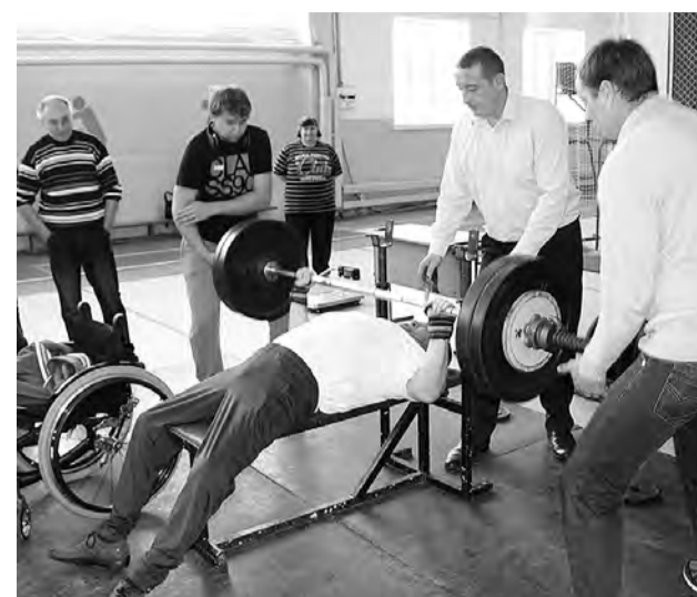
Пауэрлифтинг: кто сильнее?