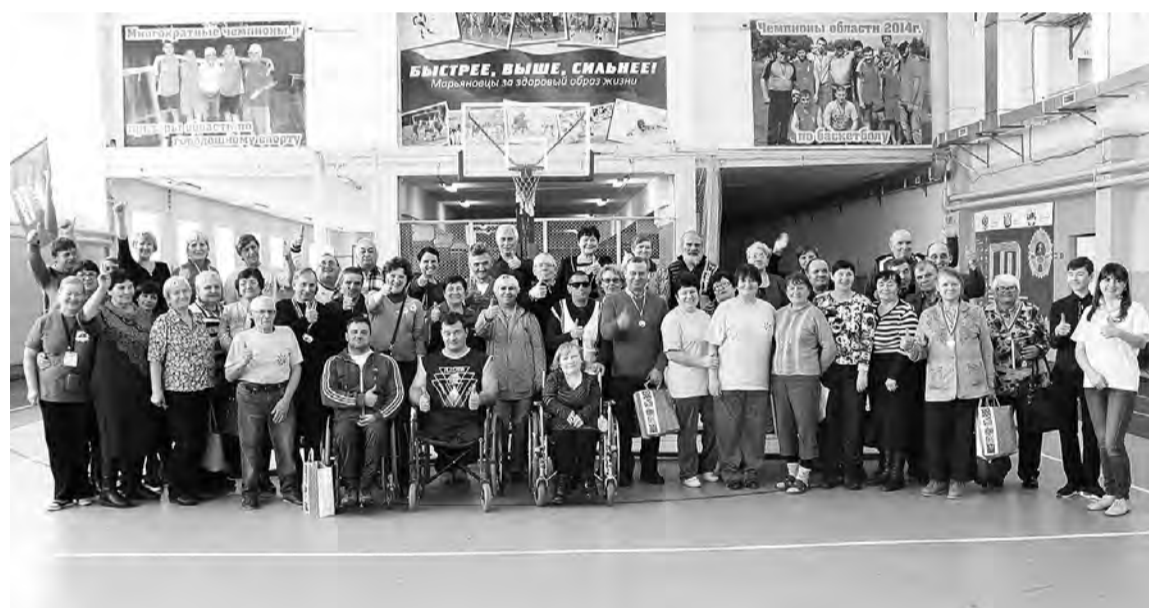
Победители и призеры фестиваля «Сила духа - наша сила».