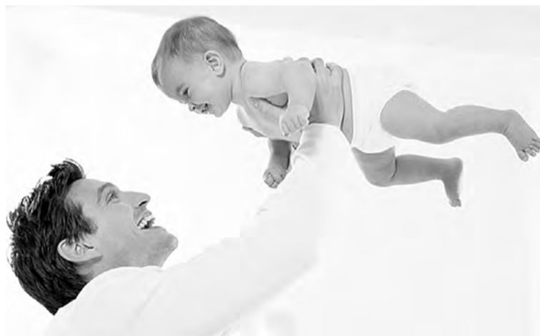
- Раскрытие талантов каждого ребенка - это наша с вами задача. В этом успех России, - сказал Президент.

«В этой отрасли в Прииртышье наблюдается существенный рост.