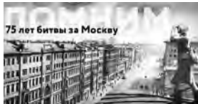
75 лет битвы за Москву

Мы продолжаем рассказ об истоках солдатского подвига и беззаветного служения Отечеству. В битве за Москву, где решалась судьба огромной страны, есть вклад и доблестных марьяновцев.