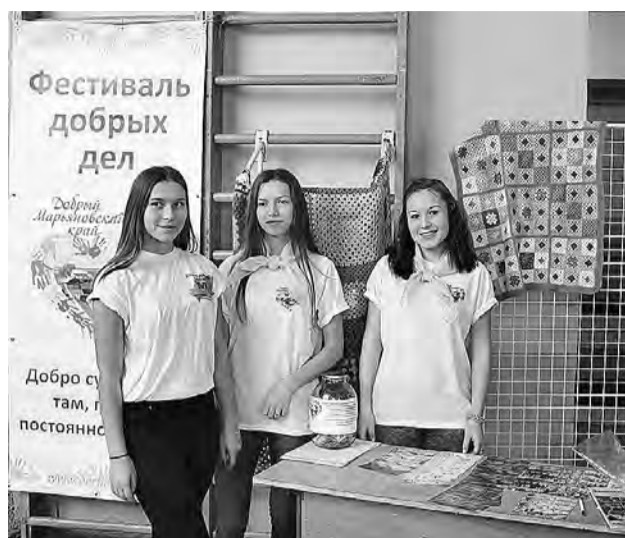
Волонтеры фестиваля добрых дел.