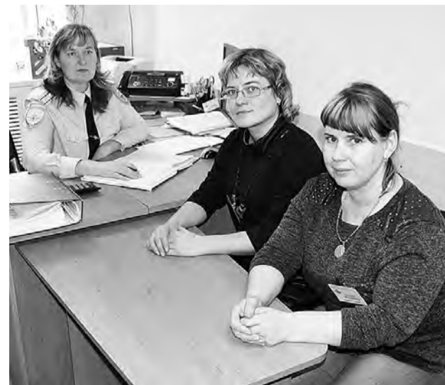
Отделение по вопросам миграции вошло в состав ОМВД по Марьяновскому району в прошлом году.