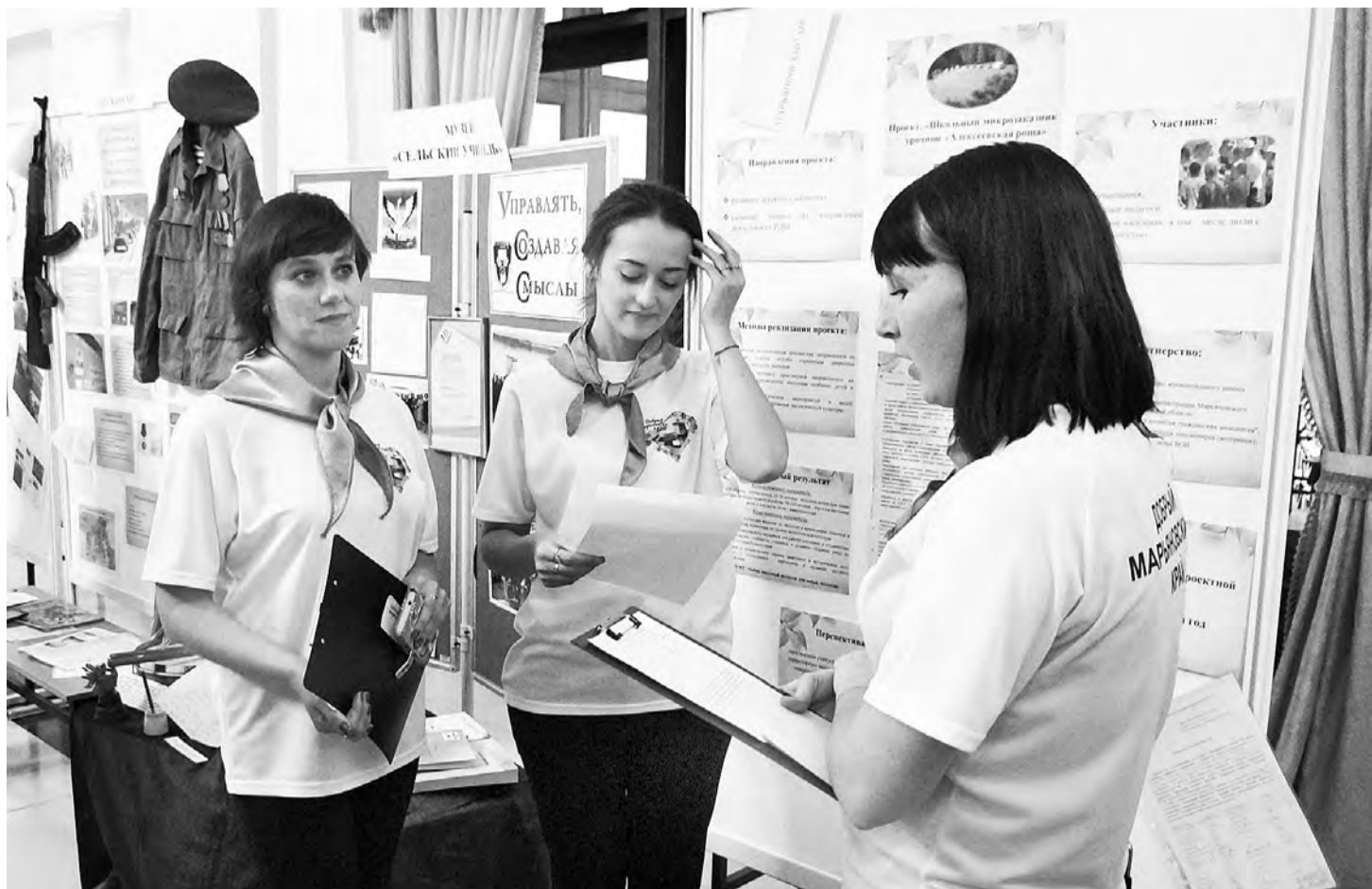
Презентация экологического проекта молодыми педагогами района на областном уровне.

По материалам ОМВД России по Марьяновскому району.