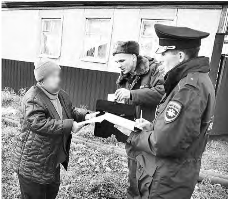
Фрагмент одного из профилактических рейдов.

По результатам работы раскрыто пять преступлений: угроза убийством и причинение вреда здоровью средней тяжести, сбыт суррогатной алкогольной продукции, умышленное уничтожение имущества, нарушение правил дорожного движения лицом, подвергнутым наказанию. Так, сотрудниками дорожно-патрульной службы был задержан 29-летний водитель ВАЗ-2106. За рулем автомобиля мужчина находился с явными признаками алкогольного опьянения. Ранее он уже был лишен права управления транспортными средствами за аналогичное