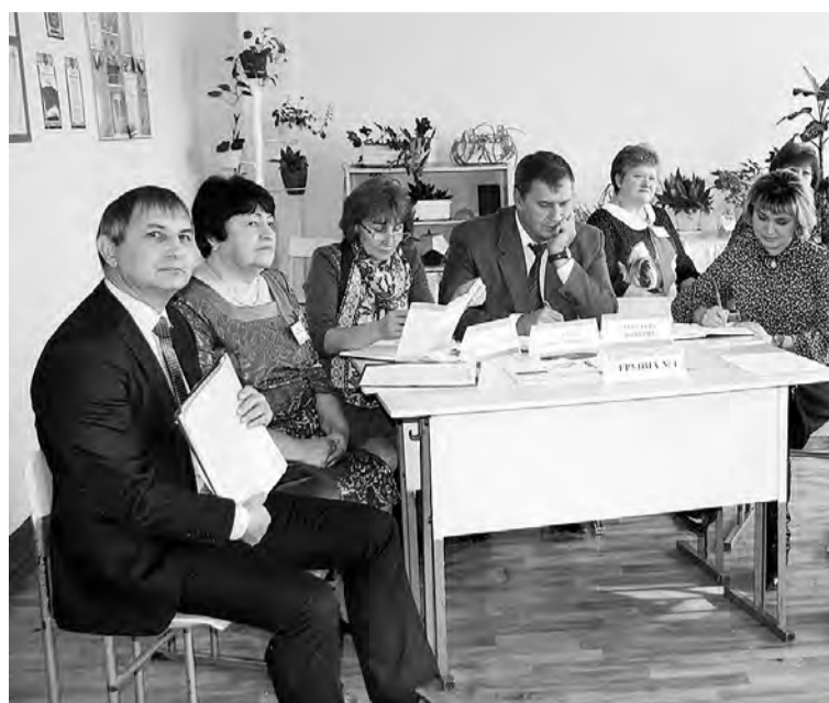
Фрагмент практической работы с участием и гостей, и представителей нашего района.