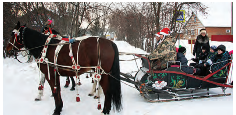
Катание на лошадях.