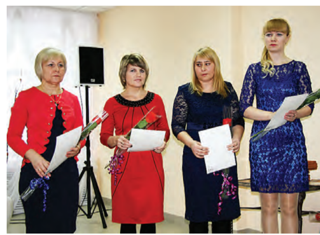
Участницы муниципального конкурса профессионального мастерства «Воспитатель года».