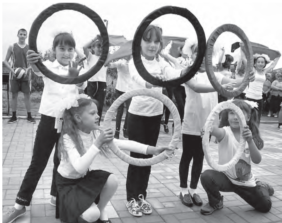
В благодарность за хороший подарок - яркая танцевальная композиция.