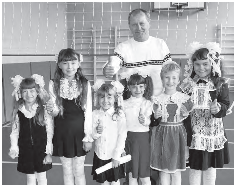
Новый спортзал для юных заринцев и их преподавателя физкультуры - в радость.