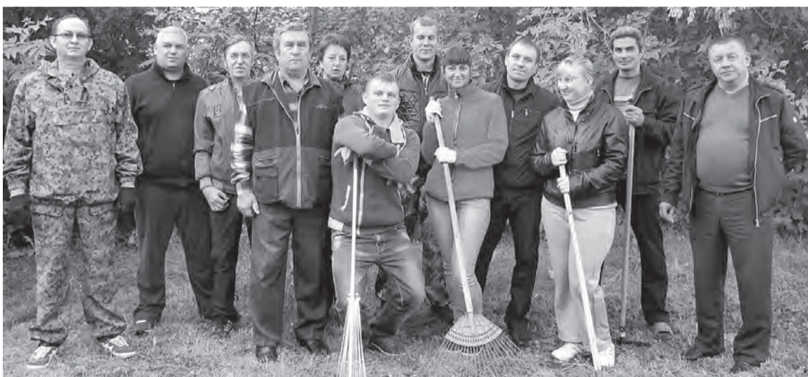
Участники экологической акции «Зеленая Россия».