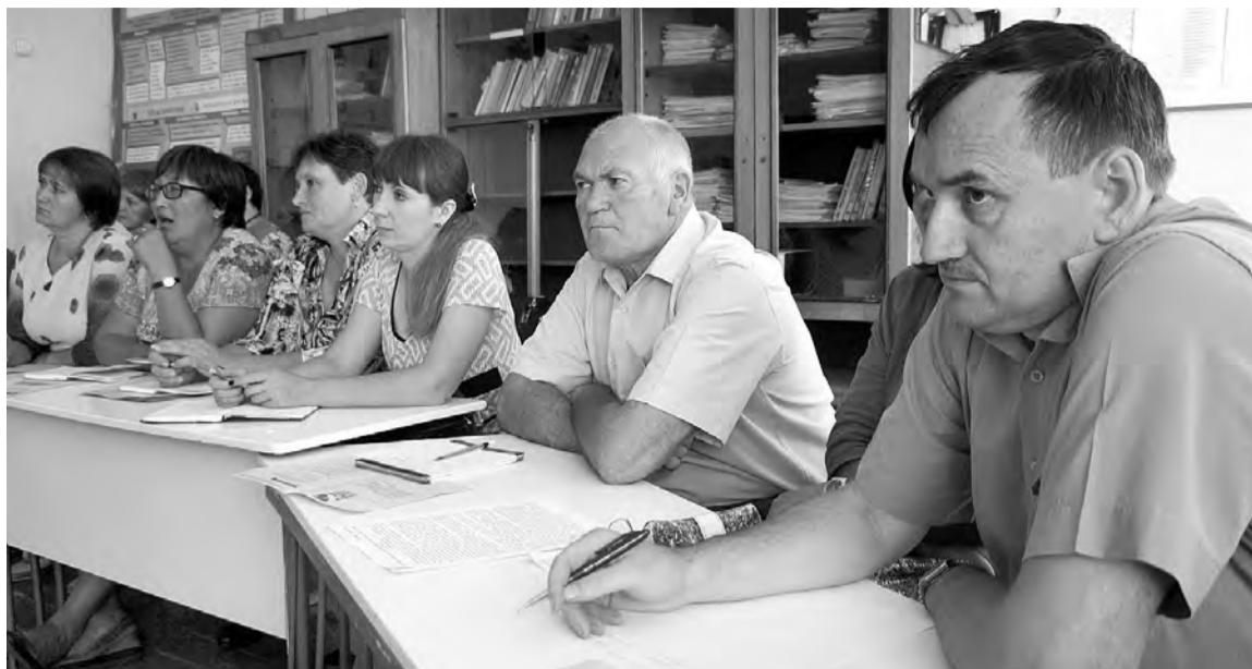
Фрагмент традиционной августовской встречи педагогов.