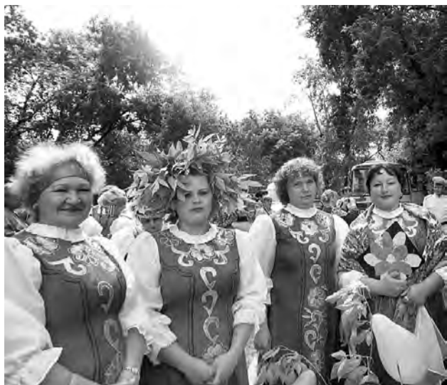
На праздник творческие делегации прибывали одна краше другой.