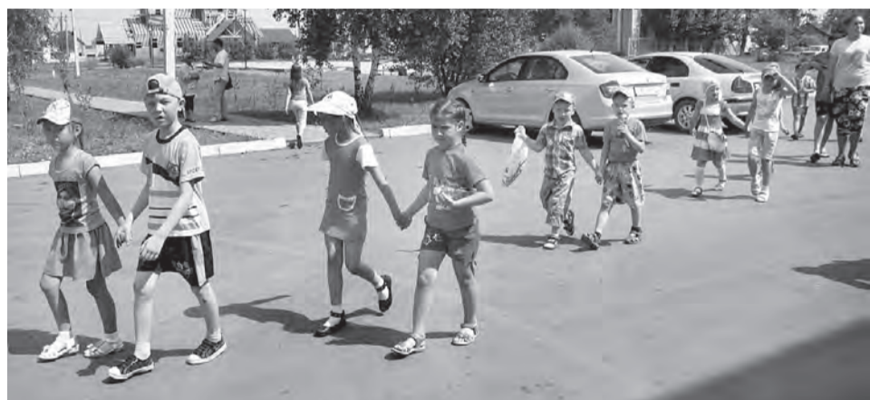
Из похода в «Аврору» возвращаются малыши из Марьяновской школы №2.