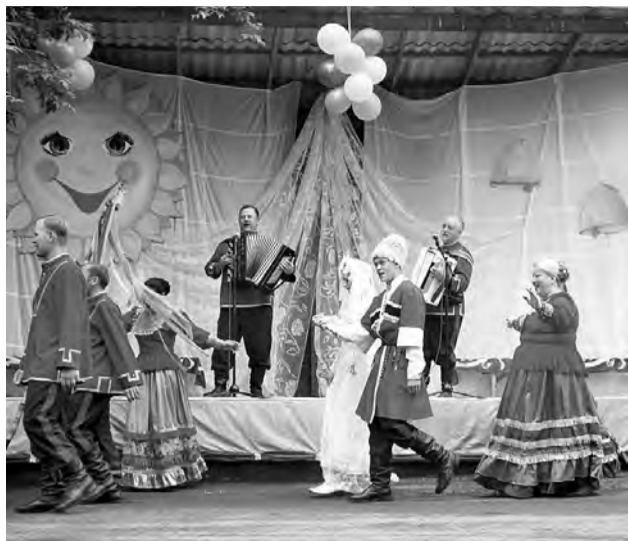
Театрализацию казачьей свадьбы продемонстрировали «Станичники».