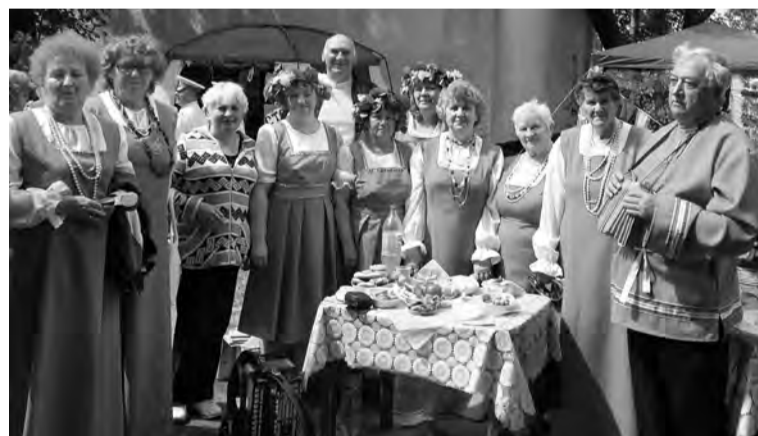
Гостеприимство по русскому обычаю.