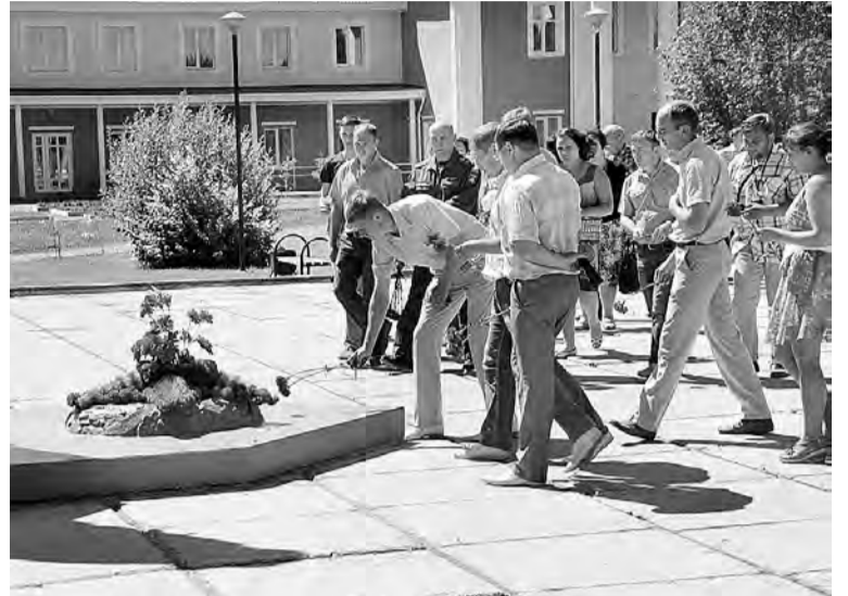
Возложение цветов марьяновцами 22 июня в память о погибших на полях сражений.