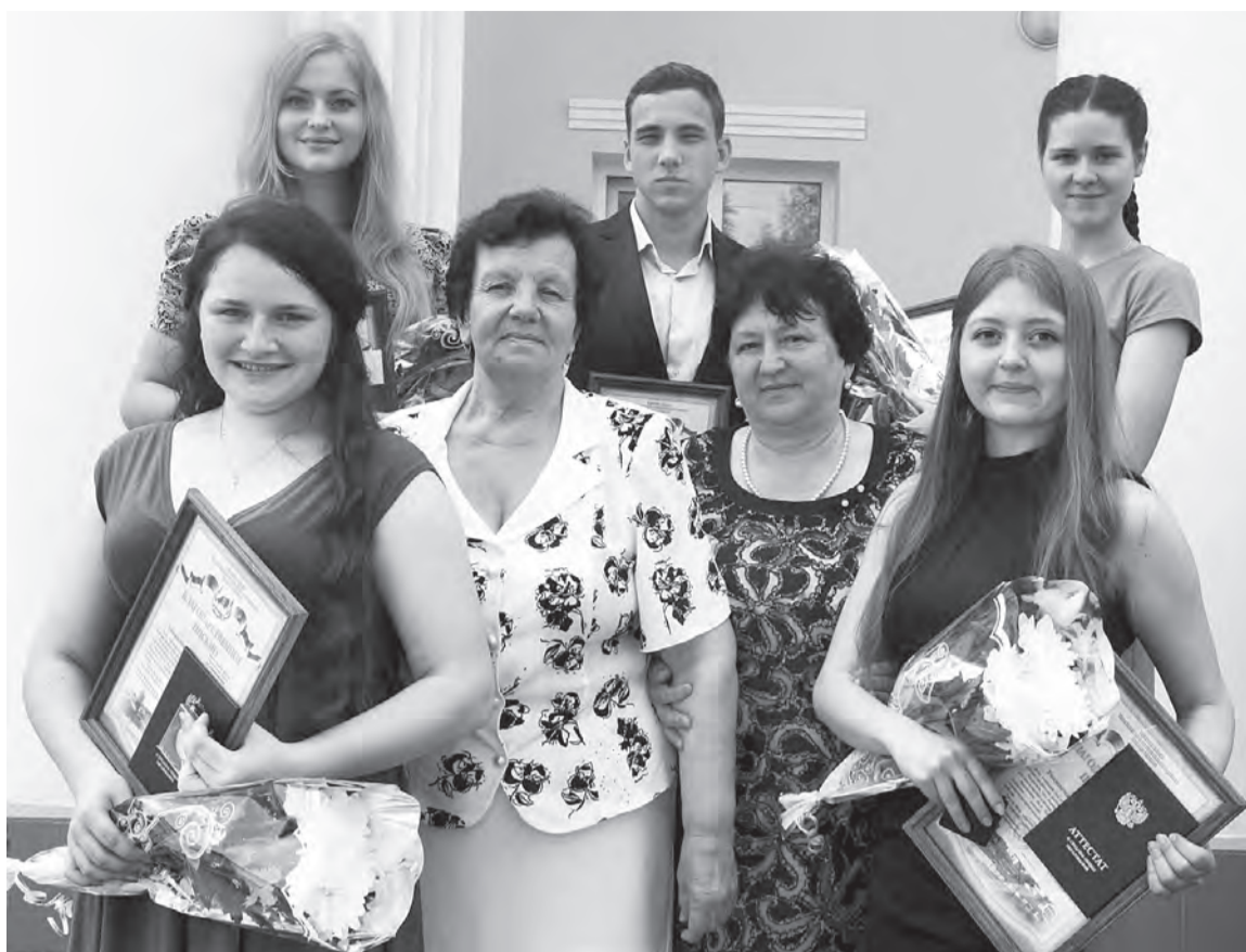
На отлично сработала Орловская средняя школа, выпустив в текущем году пять медалистов.

По оценке презентаций представленных социально ориентированных проектов выбраны наиболее достойные, которые получают поддержку в форме субсидий до конца июня 2015 года.