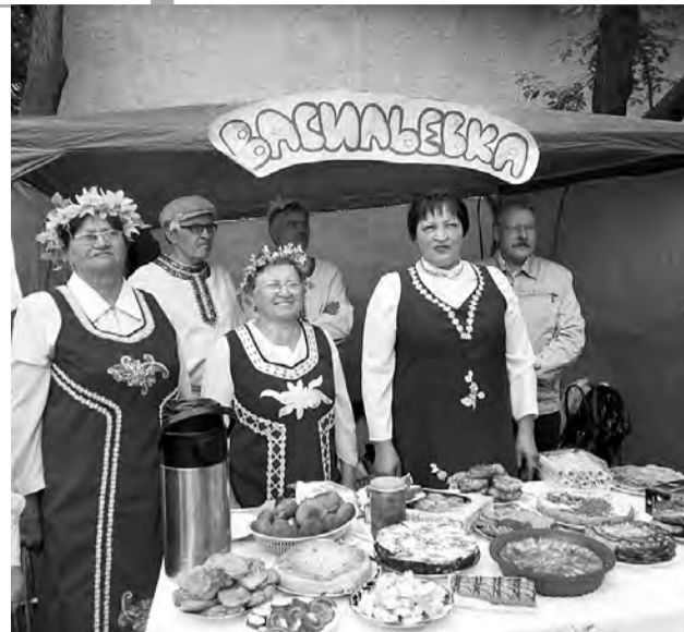
Изобилие угощений предложили все участники фестиваля.