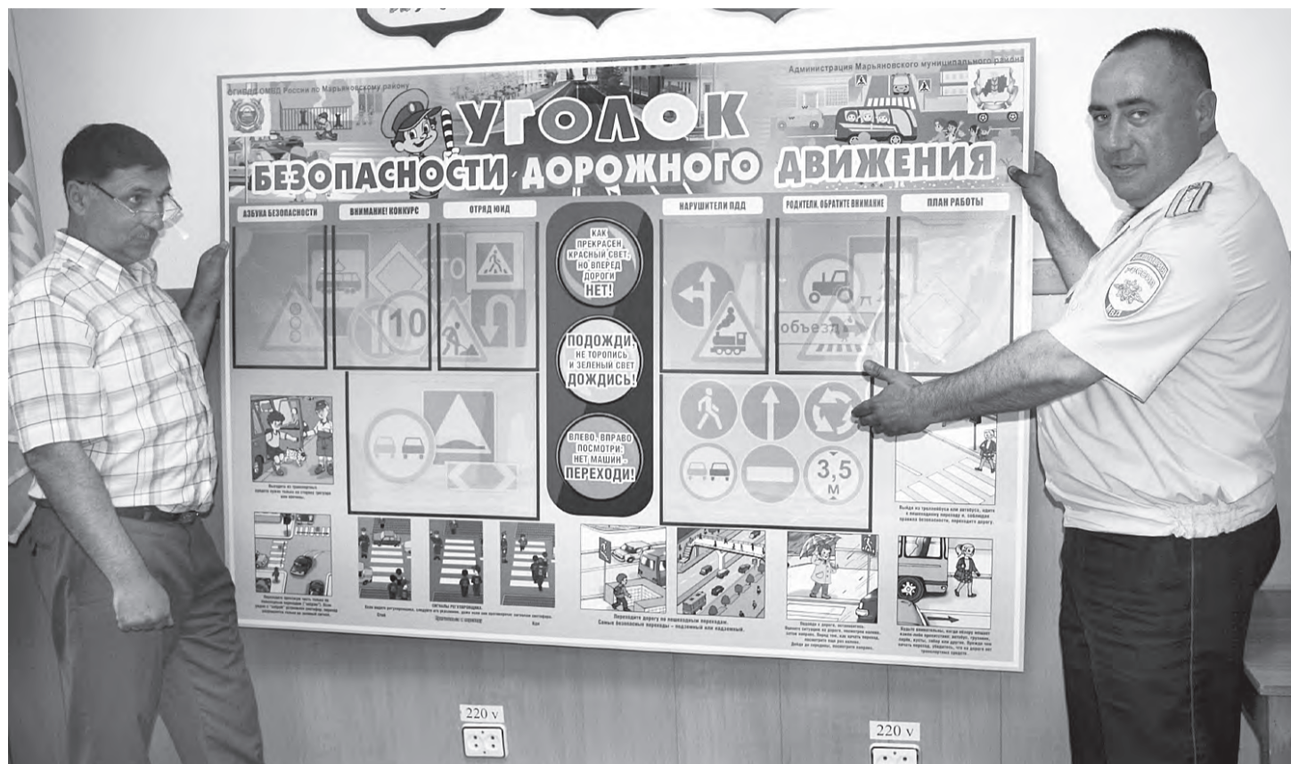
Такие информационные стенды поступят в каждую школу.