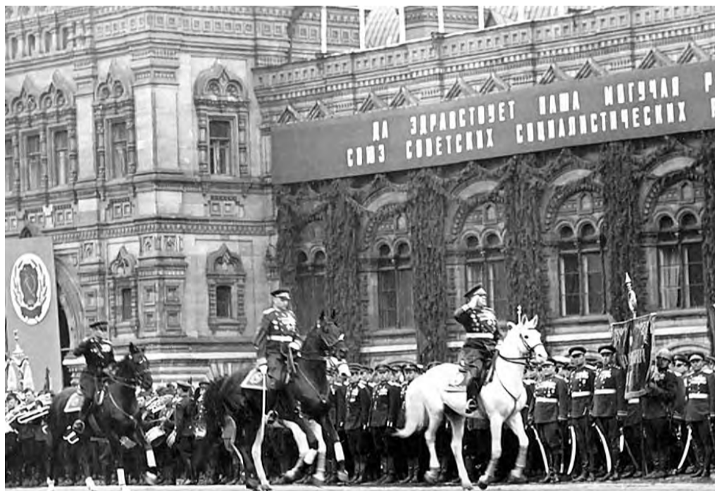
24 июня 1945 года.