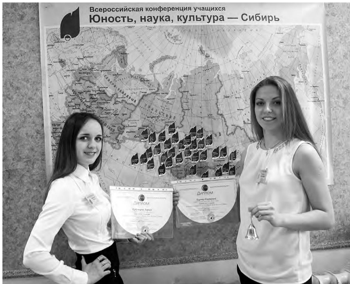
Такие награды - показатель качественных знаний.