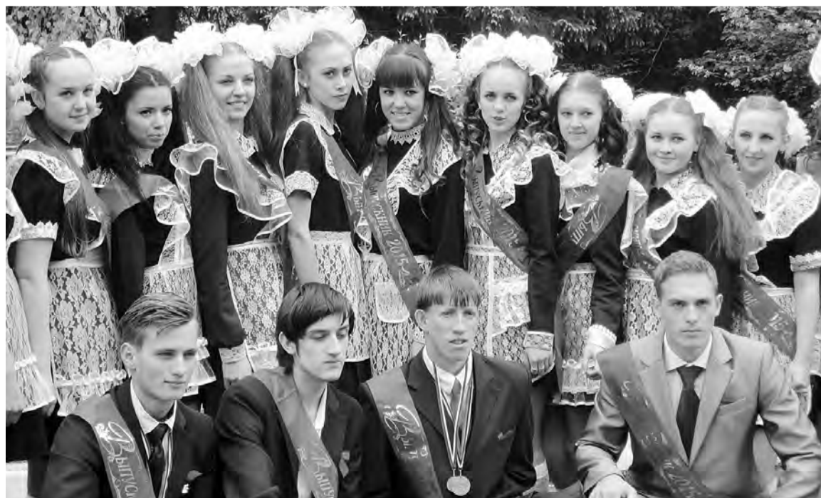
Выпускники нынешнего года Москаленской средней школы.