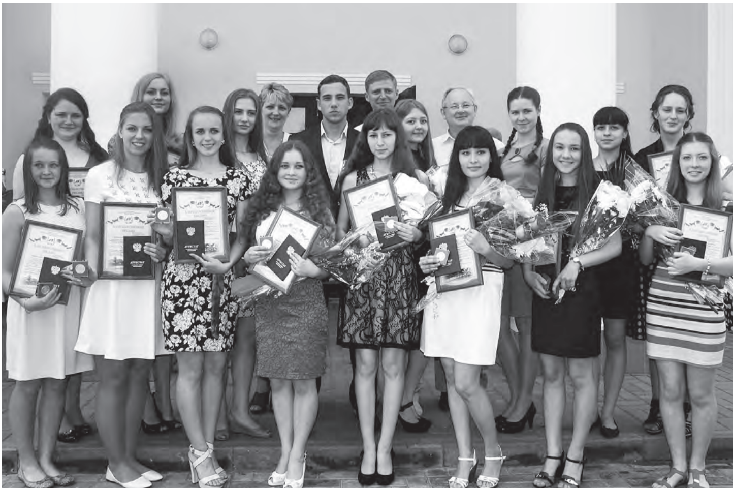
Выпускники-медалисты 2015 года с руководством района.