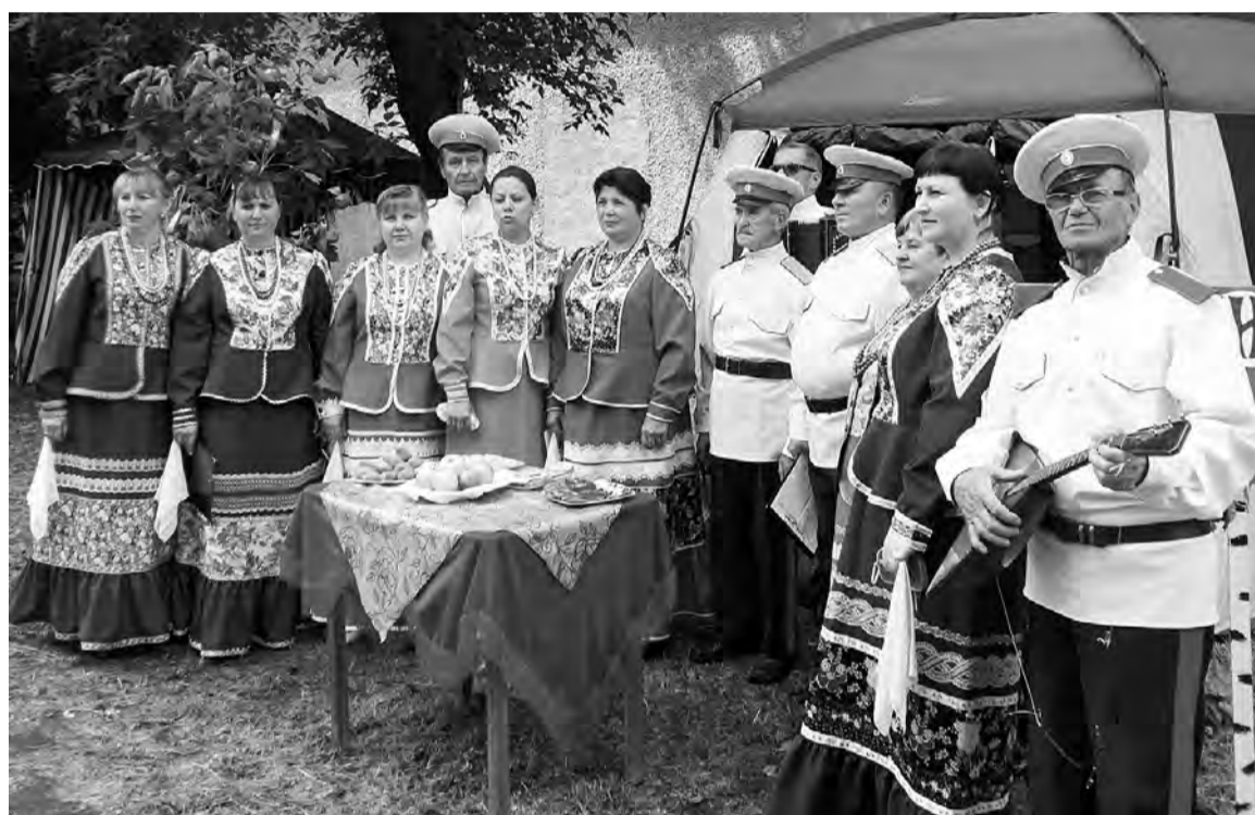
Большую творческую программу на «Благовесте» представили степнинские казаки.