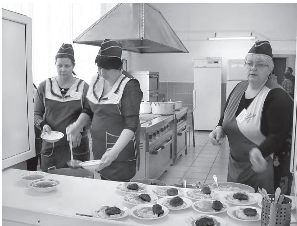
Комфортно работает сотрудникам столовой в Москаленской средней школе.