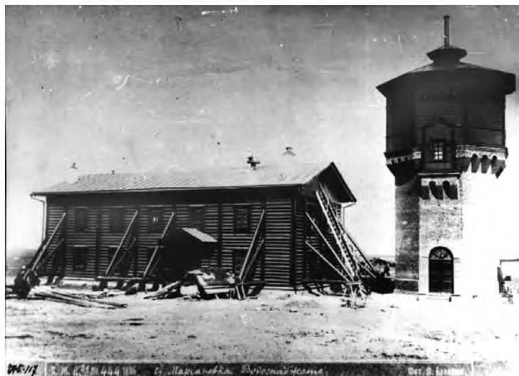
Система водоснабжения на станции Мариановка 1896 г.

Для нашей станции (она тогда еще не имела названия и значилась под номером) материалы начали завозить в 1893 году. Бревна, доски, брусья доставляли из-под Тары. Кирпичные заводы в Омске работали на полную мощность. Есть фотография, датированная 6 августа 1894 года, на ней изображена недостроенная нижняя часть водонапорной башни на соседней станции Кочубае-