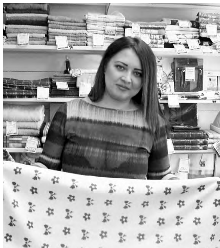
В магазине «Удача» Вам предложат большой выбор качественных текстильных изделий.