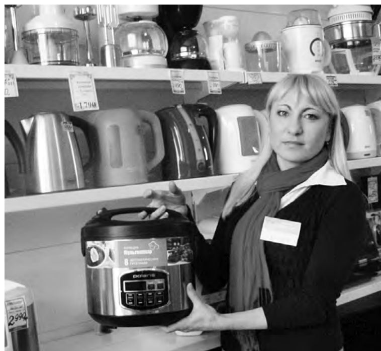
В магазине «Комфорт» широкий выбор бытовой техники.