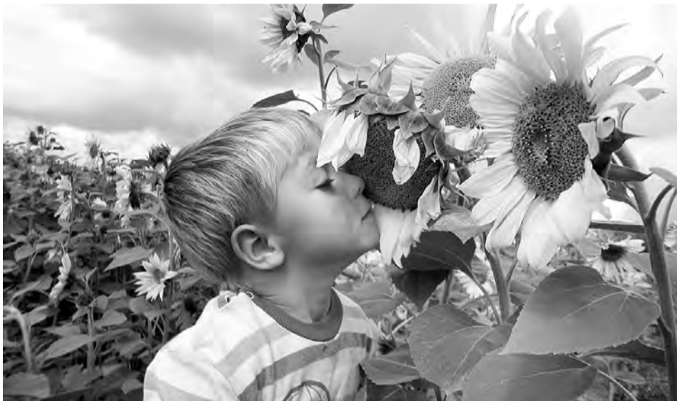
«Кусочек солнца». Фото Натальи Воропаевой (д. Голенки).