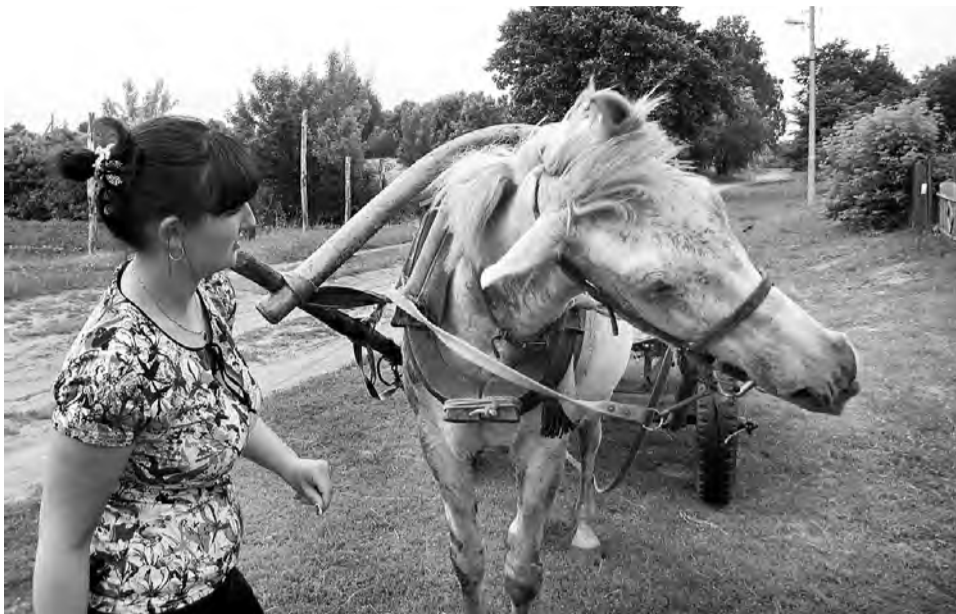
«И не уговаривай!».