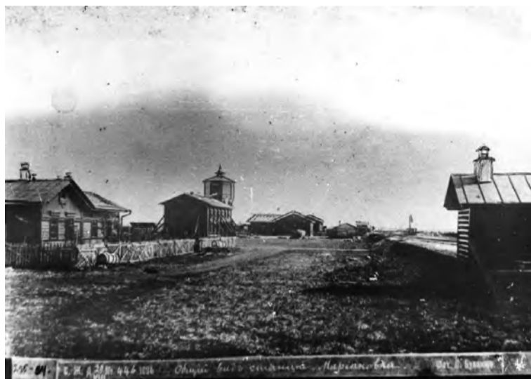
Общий вид марьяновской станции.

во (сейчас Москаленки), выложенная из кирпича. На другом фото (май 1896 г.) марьяновская башня готова. Ее окружают высокие (до крыши) столбы из неочищенных стволов берез – это строительные леса. Грузы наверх поднимались с помощью каната и блока. На переднем плане сами строители: обыкновенные русские мужики в сапогах, картузах, поддевках, бороды – лопатами. Эти цен-