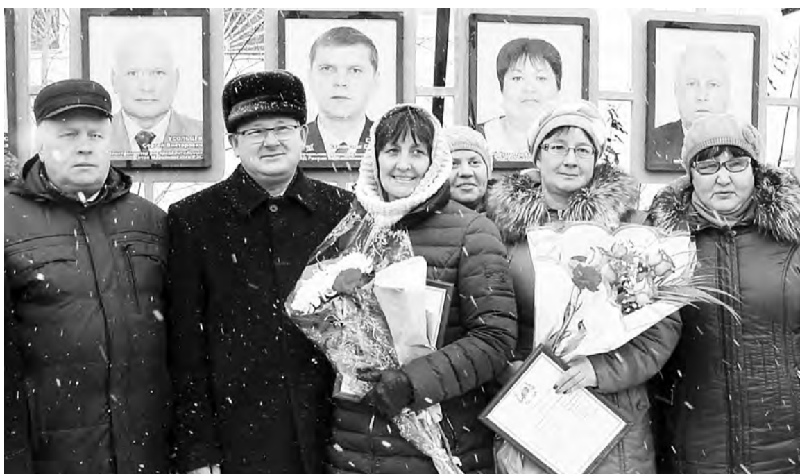
По традиции фото на память у Доски Почета.