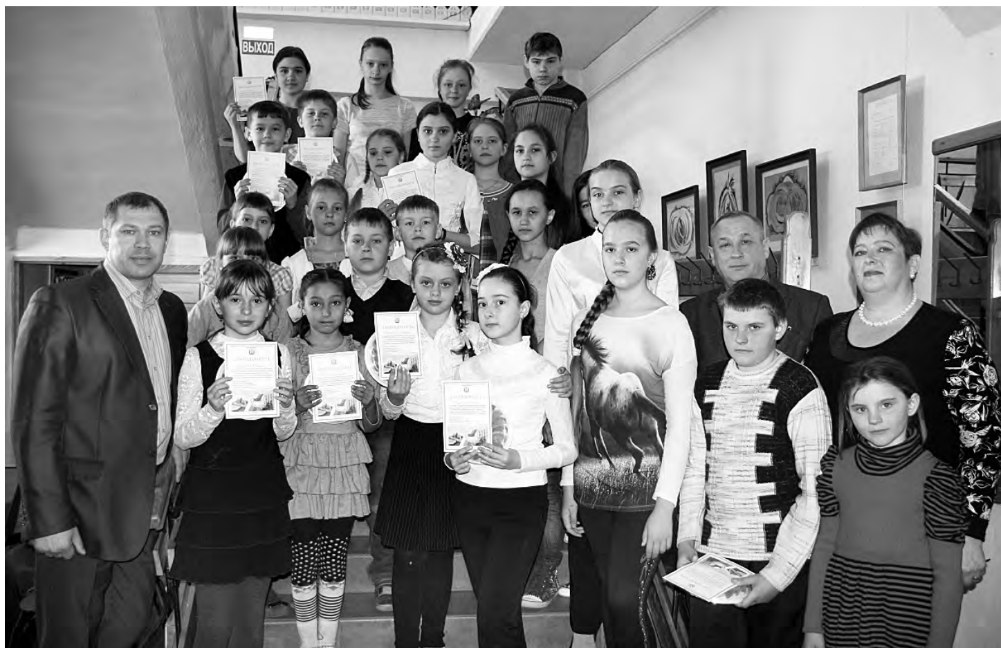
Юным художникам вручены благодарности за активное участие в областном конкурсе рисунков на тему ЖКХ.

Справки по телефонам: (3812) 31-47-79, 8-950-795-69-02, 8-923-671-04-40.