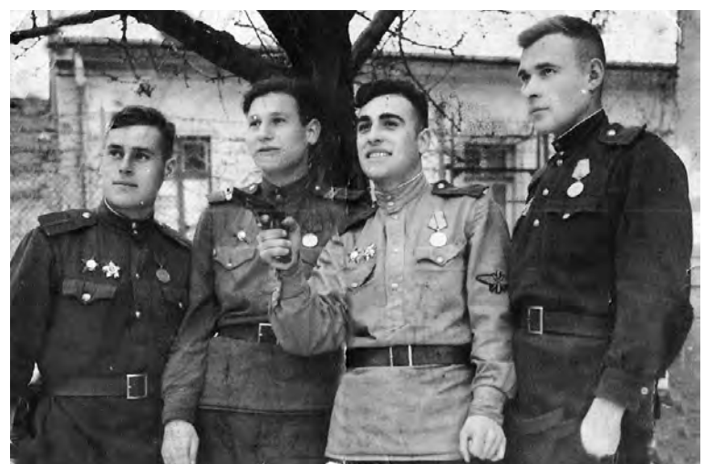
Он же (первый справа) в 1944 году.

рить с ним. Но вся наша семья им очень гордится. В семейном альбоме хранится много его фотографий. 9 мая 2015 года мы