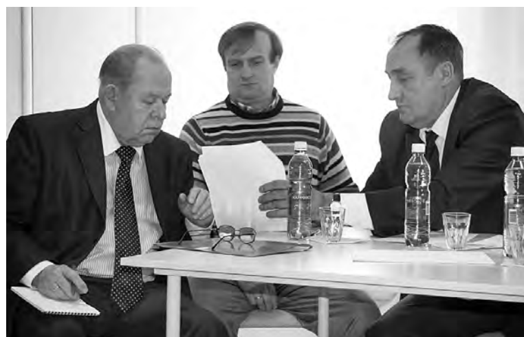
Совещаются члены президиума.