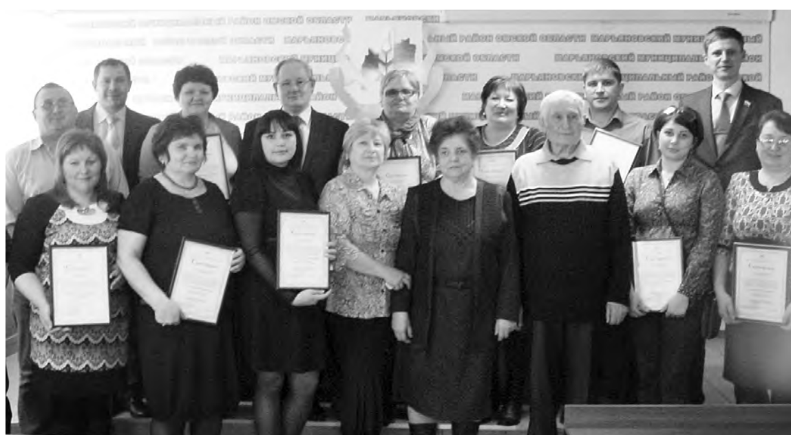
Их инициативы поддержаны Администрацией района.