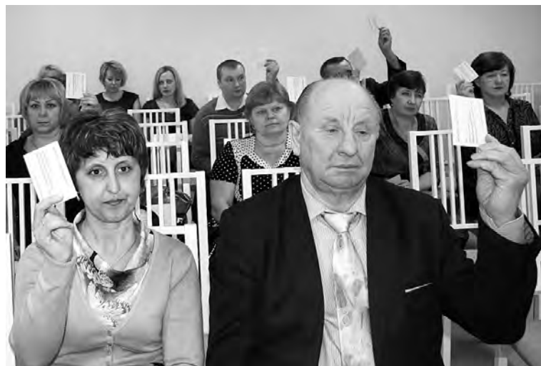
Голосуют делегаты конференции.