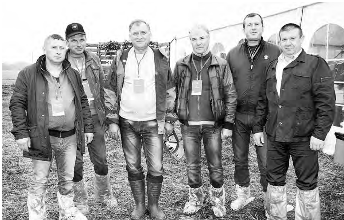
Представители Марьяновского района, участвовавшие в «Дне поля».