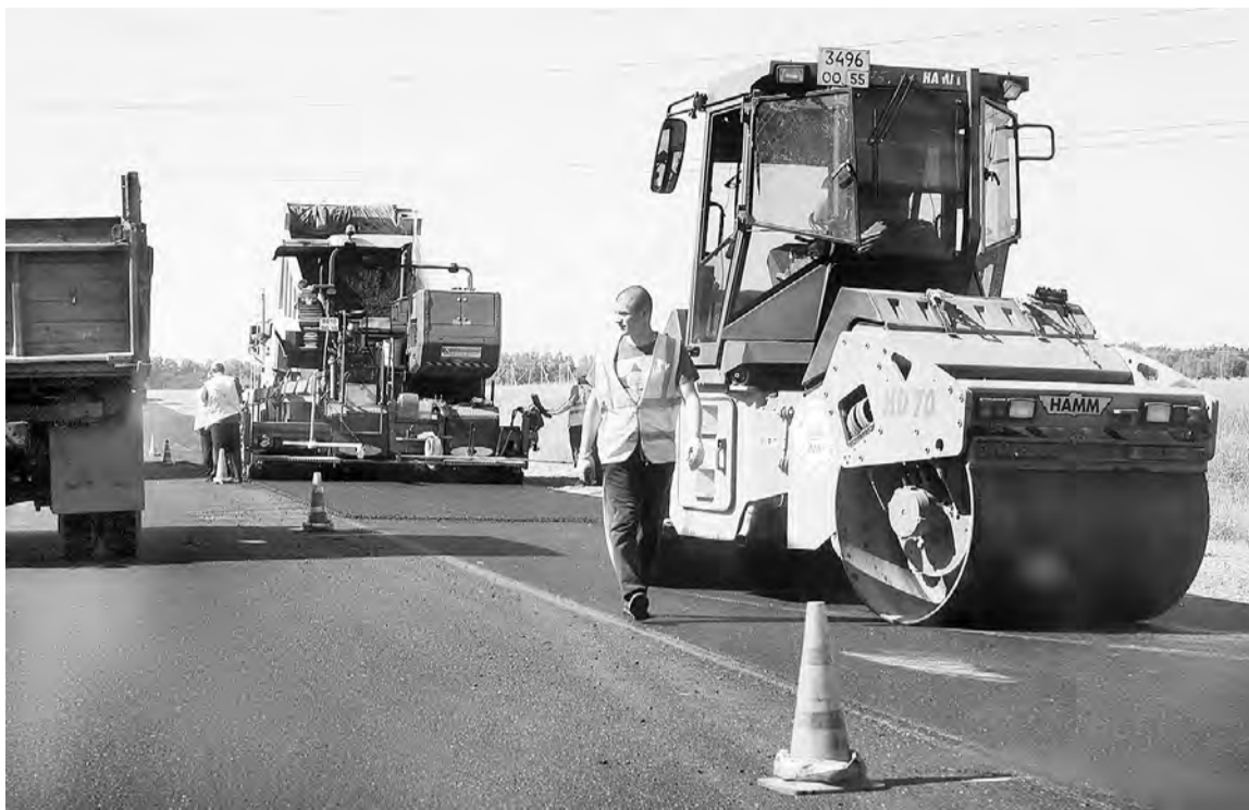
До 1,54 млрд. вырастут расходы на ремонт и реконструкцию сельских дорог в этом году.

Когда мы проезжаем по разбитой дороге, нам неважно, что где-то рядом дорога отремонтирована, неважно, сколько денег выделяется на ремонт. Важно, чтобы именно эта дорога, по которой мы передвигаемся, была в нормальном состоянии. И тем не менее, чтобы мнение о состоянии омских дорог было объективным, было бы неплохо знать несколько цифр. Например, общая протяженность