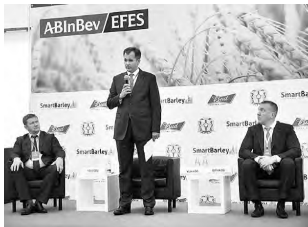
Участников мероприятия от имени главы региона приветствует вице-губернатор Дмитрий Ушаков.