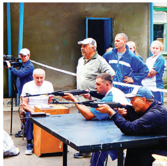
Пятое место по стрельбе у марьяновцев – тоже неплохое достижение.