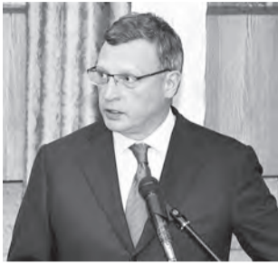
Александр БУРКОВ, врио Губернатора Омской области.

«Искренне убежден в том, что без помощи общественных организаций, активных неравнодушных граждан проблемы региона не решить. Состояние дорог в регионе – это вопрос безопасности граждан и экономического развития региона. Без развитой транспортной сети невозможно развитие сельских территорий. Сегодня в регионе не хватает специалистов, которые могли бы проконтролировать сотни километров дорог, которые строятся и ремонтируются. Поэтому необходимо наладить систему контроля за качеством ремонта дорог, соблюдением технологий их строительства и эксплуатации дорожного покрытия. На общественниках лежит немалая ответственность за качество дорог в регионе. Важно, что в проекте вместе с общественниками работают представители СибАДИ, которые являются экспертами дорожного строительства, знают все технологии проведения ремонта дорог.»