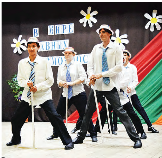
Танцевальная композиция от хореографического ансамбля «Медя».