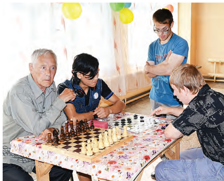
Нашлось время и проявить смекалку, сыграв в шахматы и шашки.