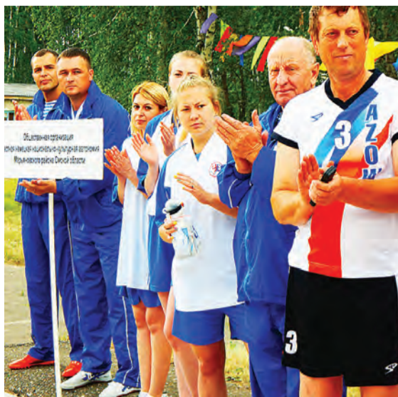
Победы в спорте и дружеское общение настраивали участников праздника на позитив.

Не откладывайте важные дела. Чем раньше вы за них возьметесь, тем лучше. Эта неделя дает шанс многое изменить, но для того, чтобы воспользоваться им, потребуются решительность и настойчивость. Нужно о многом подумать, принять решения.