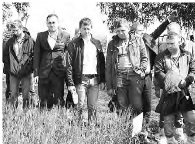
Практическая часть мероприятия - выход в поле.