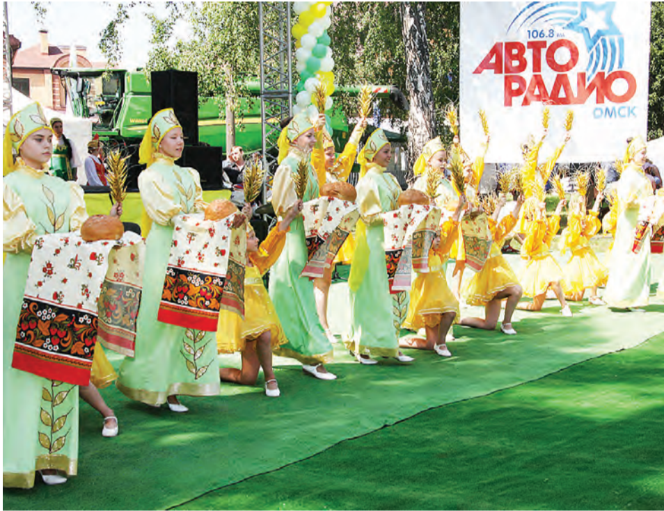
Хлеб-соль - в традициях русского гостеприимства.

№29 (10321) 27 июля 2018 г. • www.gazeta-avangard.ru • Издаётся с мая 1935 г.