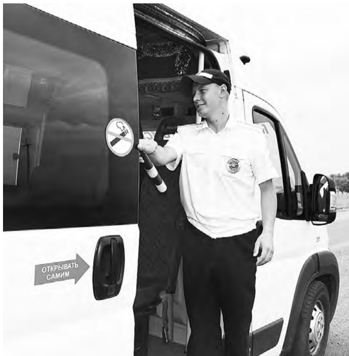
К сожалению не все водители маршруток требуют от пассажиров пристегивать ремни безопасности.