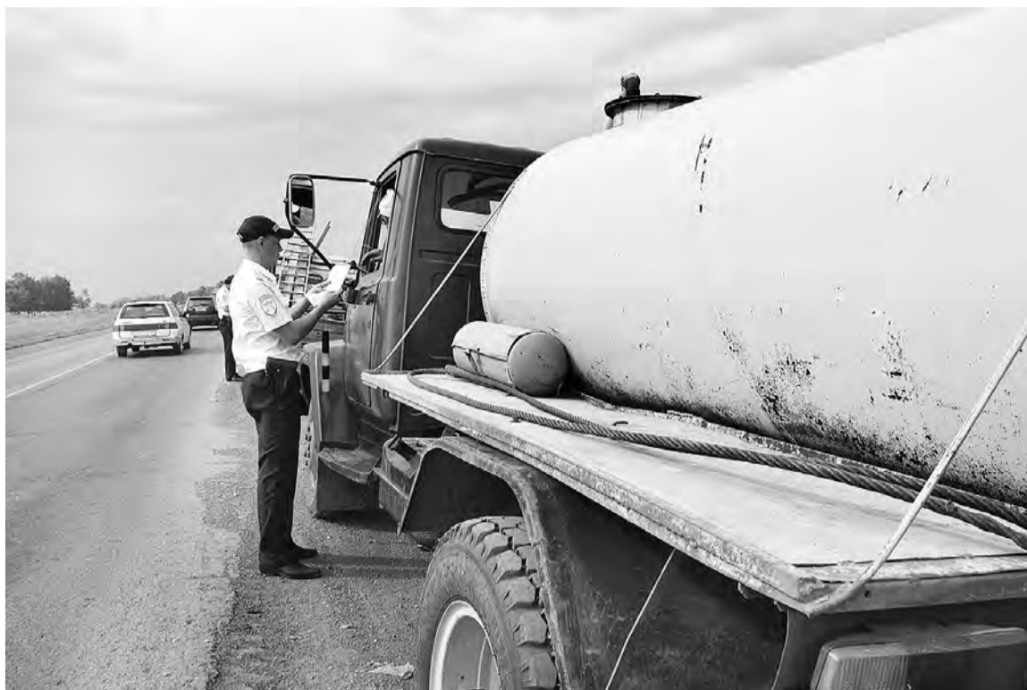
Особое внимание в ходе рейда уделялось ассенизаторским «бочкам».

Большинство нарушений, выявленных в ходе рейда, были связаны с отсутствием страхового полиса ОСАГО.