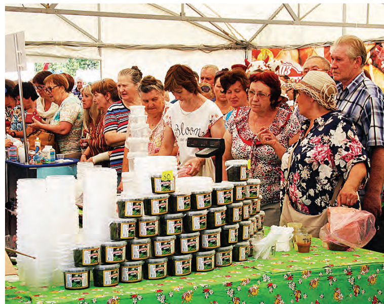
В продуктовых павильонах было многолюдно.