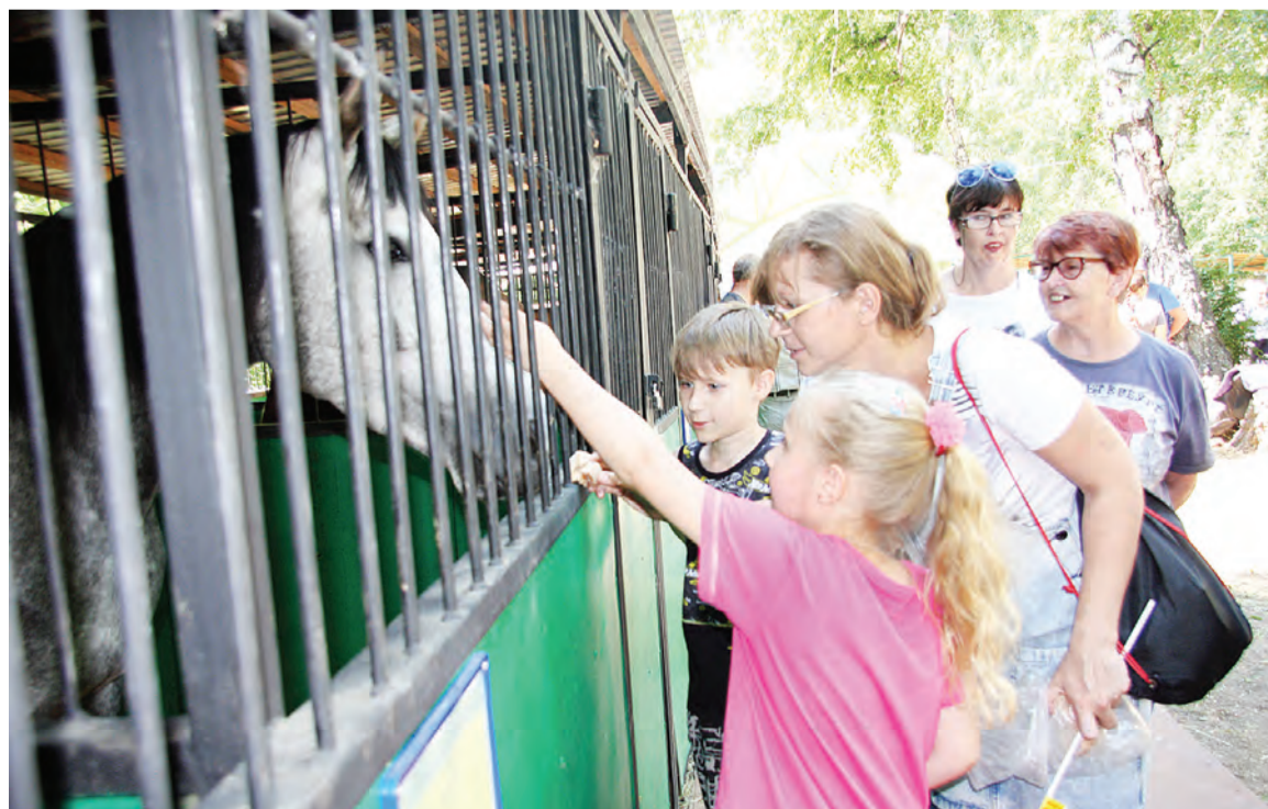
Общение с лошадами - для всех в радость.