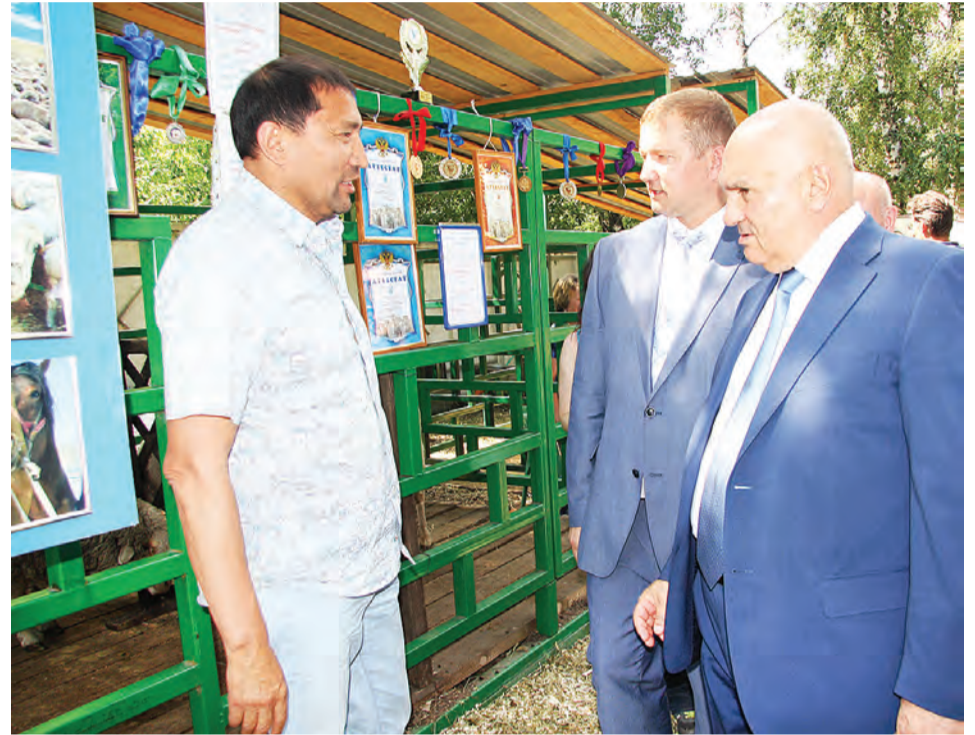
На животноводческой площадке ООО Племзавод «Овцевод».