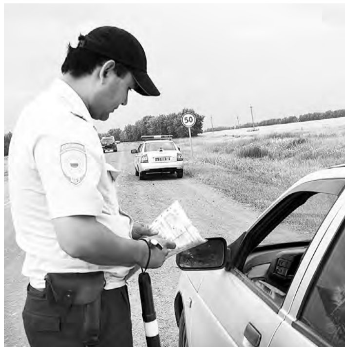
Большинство нарушений было связано с истечением срока действия полиса ОСАГО.