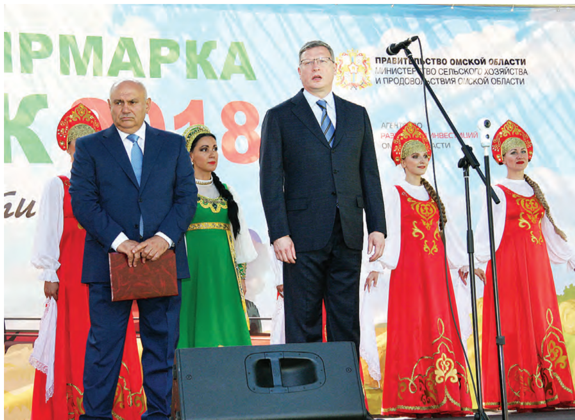
Фрагмент торжественного открытия выставки «АгроОмск-2018».