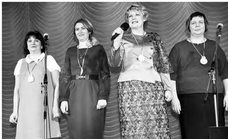
Участников конкурсов приветствуют специалисты комитета по образованию.

Еще больше снимков на нашем сайте gazeta-avangard.ru .