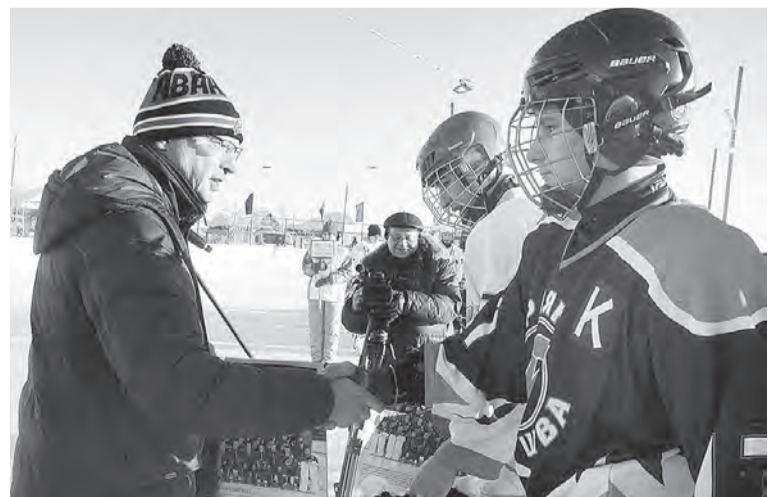
Александр Бурков признался, что раньше в хоккее не играл, но если надо будет — встанет на коньки.

«Ледовые битвы» у ребят продлились два дня. В итоге сильнейшими стали школьники команды «Горняк», одержавшие победы во всех встречах. Серебряными призе-