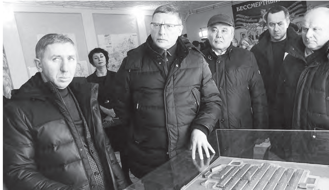
Предприятие рассчитывает воспользоваться налоговыми преференциями для инвесторов, участвующих в создании новых производств.

Глава региона посетил площадку строящегося нового комбикормового завода в Кормиловском районе.