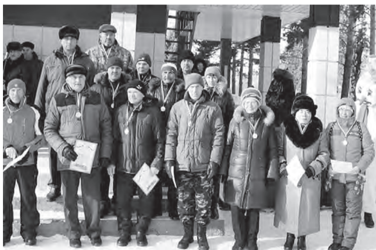
Награды ветеранам спорта Москаленского поселения.