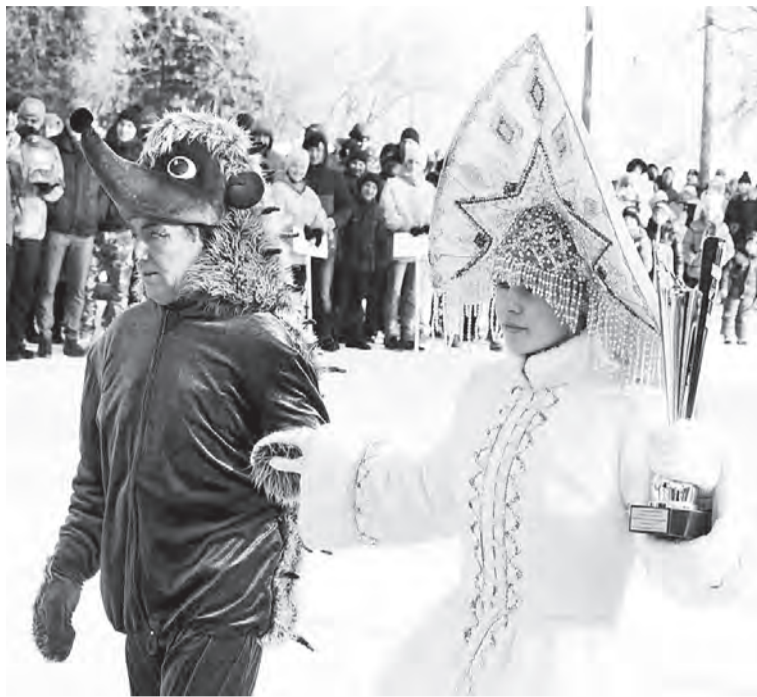
Главная героиня «Снежинки» с кубком для победителя.