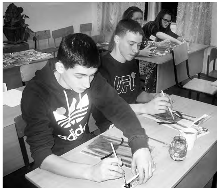
Мастер-класс «Художник? Легко!».