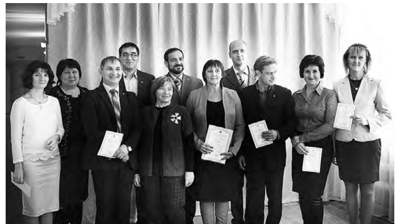
Педагоги-мастера удостоились сертификатов.

применения представленного опыта в своей работе, высказали мнение об эффективности такого «десанта» и предложили продолжить сотрудничество по освоению опыта мастеров.