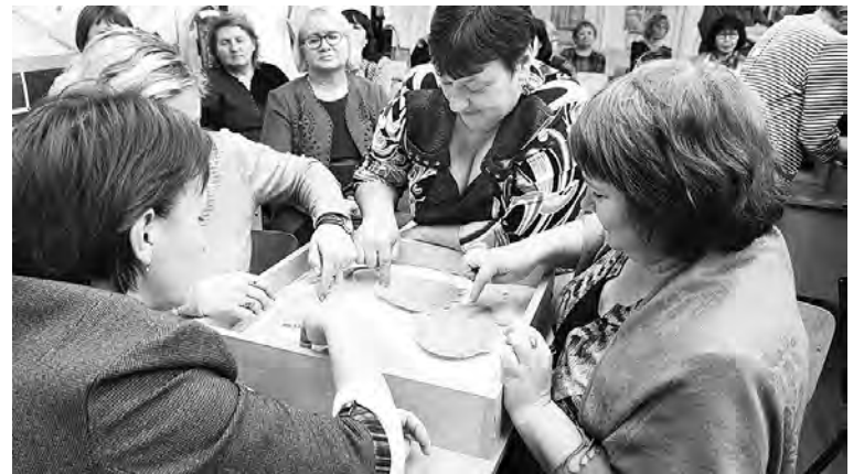
Фрагмент творческой работы.