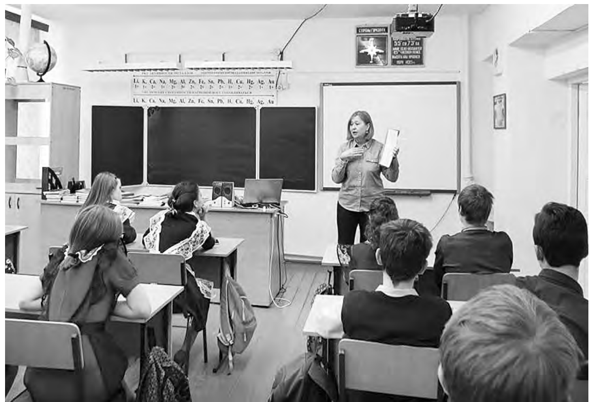
Экологическое занятие в Степнинской школе проводит специалист регионального детского экоцентра.

В целях распространения знаний о животном мире Омской области и популяризации природоохранных знаний среди молодежи будет организована онлайн группа «Вконтакте».