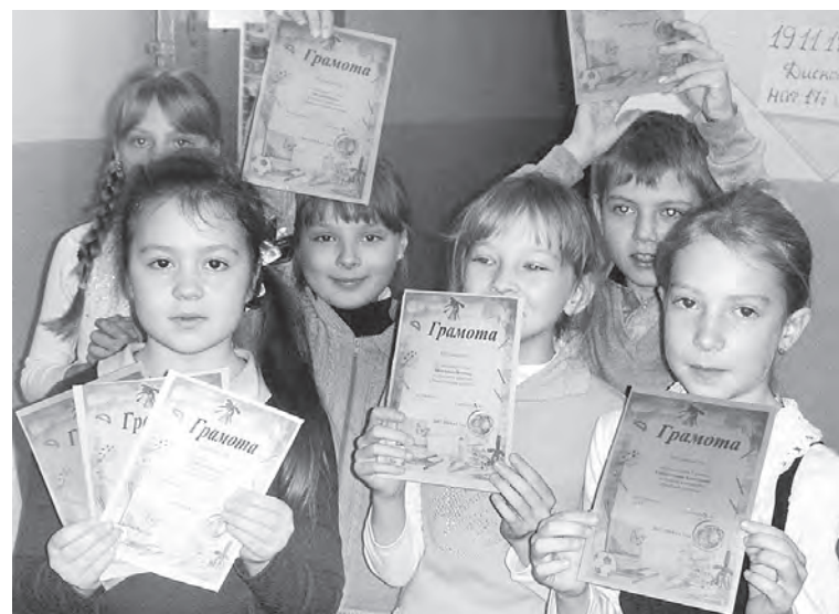
Самые активные ребята удостоились наград.