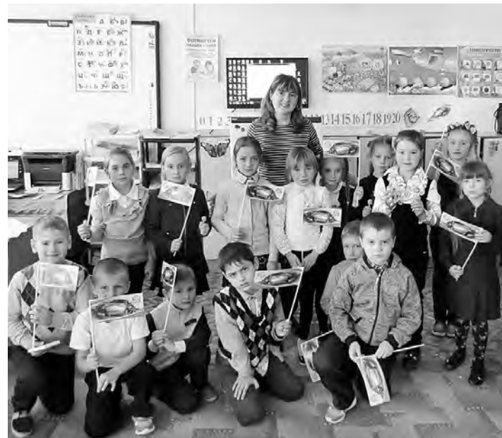
Занятие по правилам дорожного движения проведено для первоклассников Марьяновской СОШ №1.