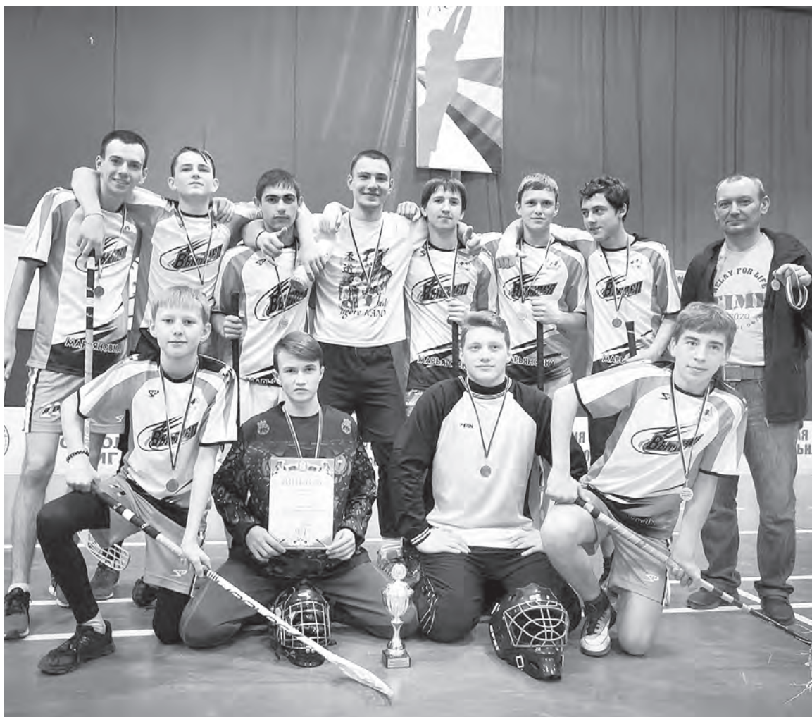
Команда по флорболу - бронзовый призер областного турнира.