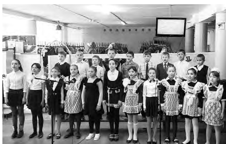
Одно из конкурсных выступлений.

Юнкоры Виктория КОРОБКИНА, Айжан АХМЕТОВА. Фото авторов.