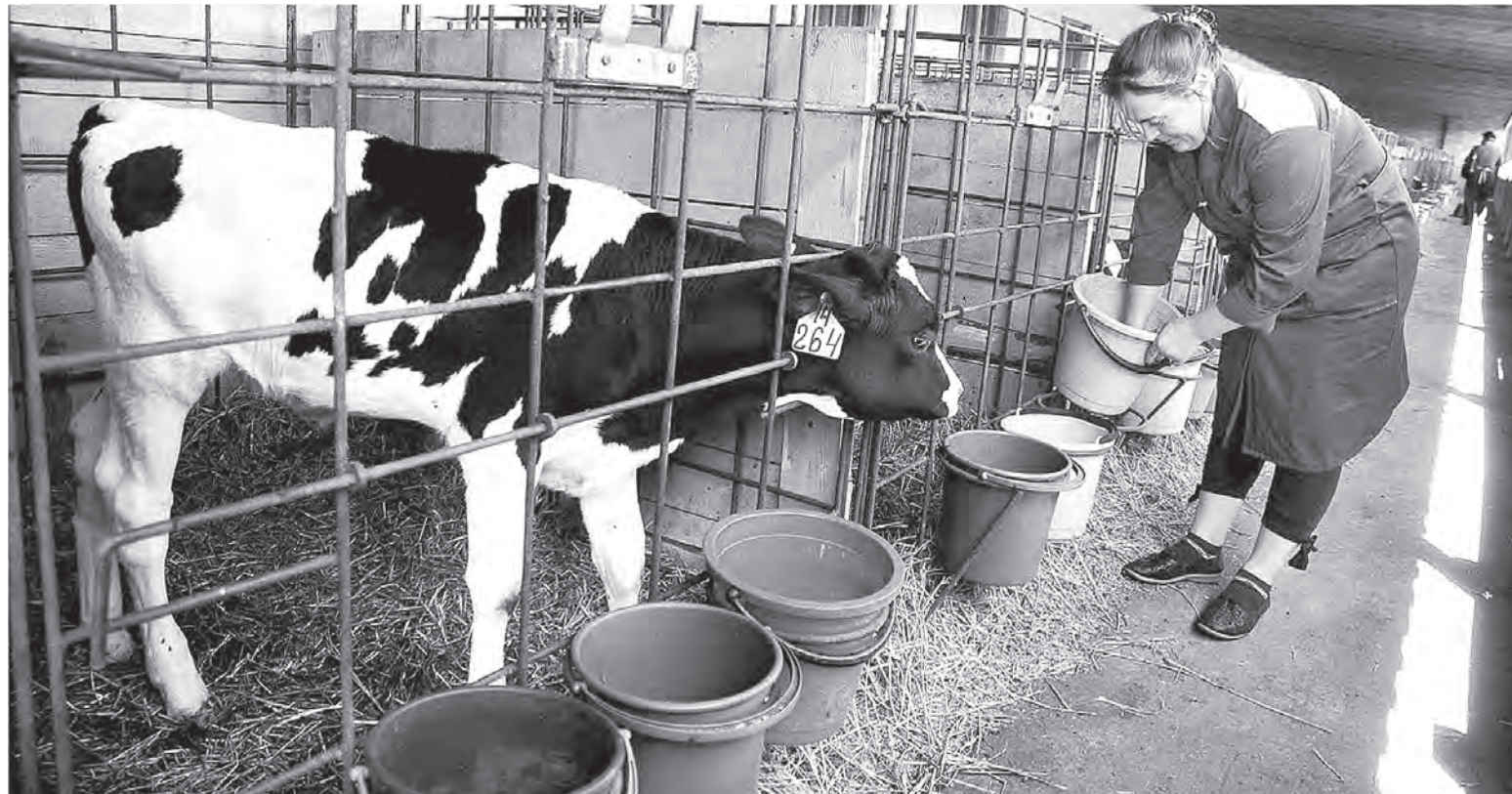
Скоро коров будут различать по номеру, а не по имени.

Со следующего года в России начнет вводиться система поголовной идентификации животных.