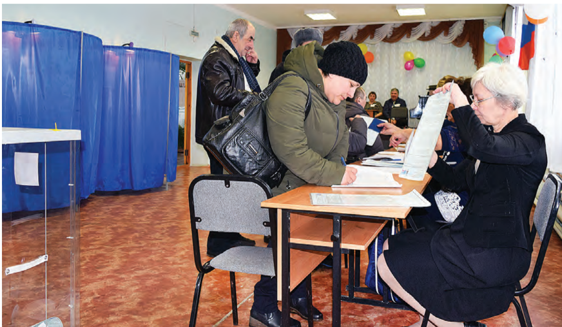
Утром особенно активными избирателями оказались марьяновцы среднего возраста и пенсионеры.