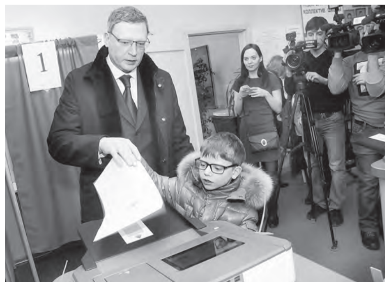
Александр Бурков побывал на избирательном участке со своей семьей.

Федеральная экспертная сеть «Клуб регионов».