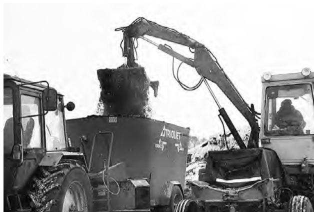
Для лучшего усвоения силос измельчается в кормосмесителе.