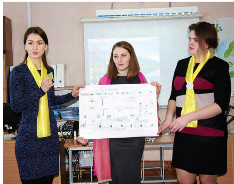
Участникам форума молодых педагогов была предоставлена возможность побывать на нескольких мастер-классах, проведенных их коллегами из разных районов.