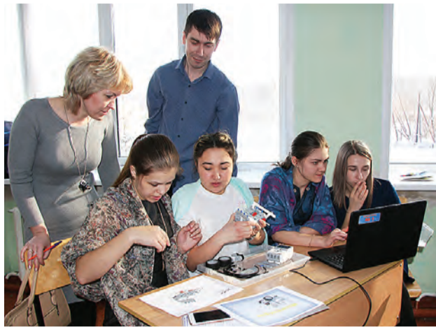
Интерес вызвал мастер-класс по роботоконструированию.