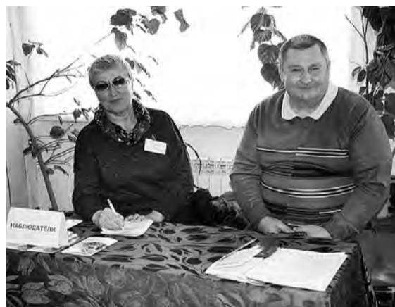
За процессом голосования в п. Марьяновский активно следили наблюдатели.