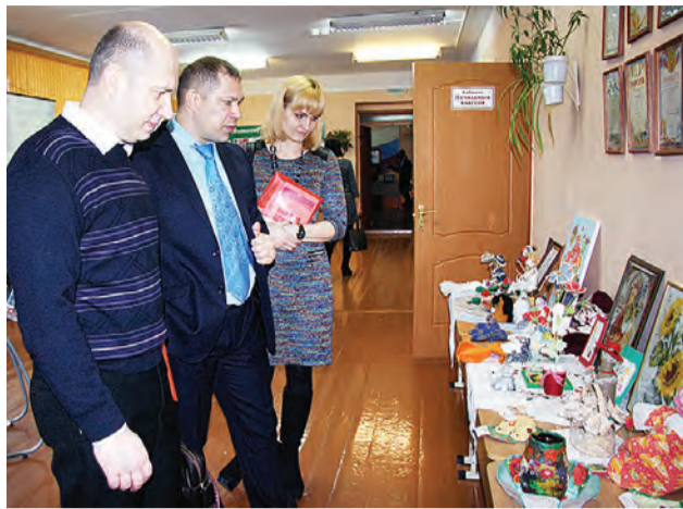
Творческие шедевры ребят восхищали всех гостей.