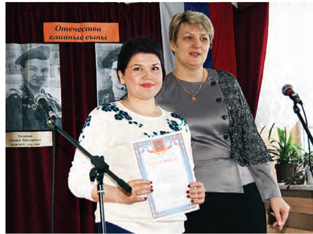
Самые активные были поощрены руководством комитета по образованию.