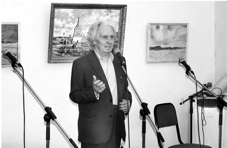
Поздравить местных авторов приехал известный омский поэт Владимир Балачан.