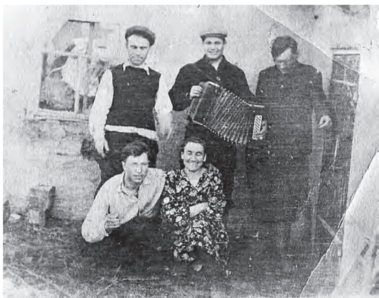
Встреча с односельчанами после службы в армии.

Подготовила Елена ДРАЙЗЕР.