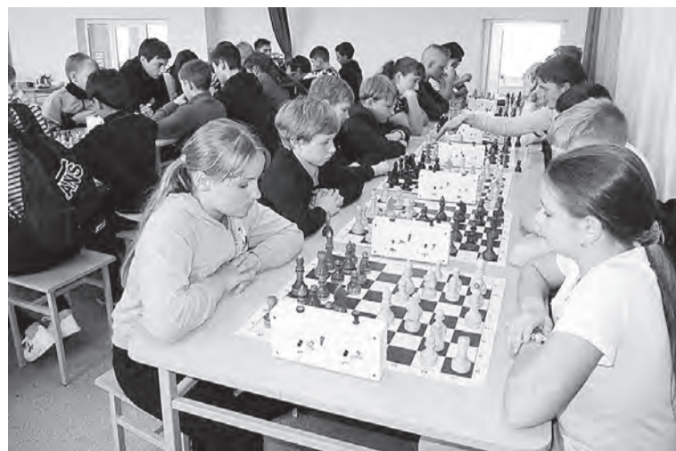
На турнире юных шахматистов в Конезаводской средней школе.