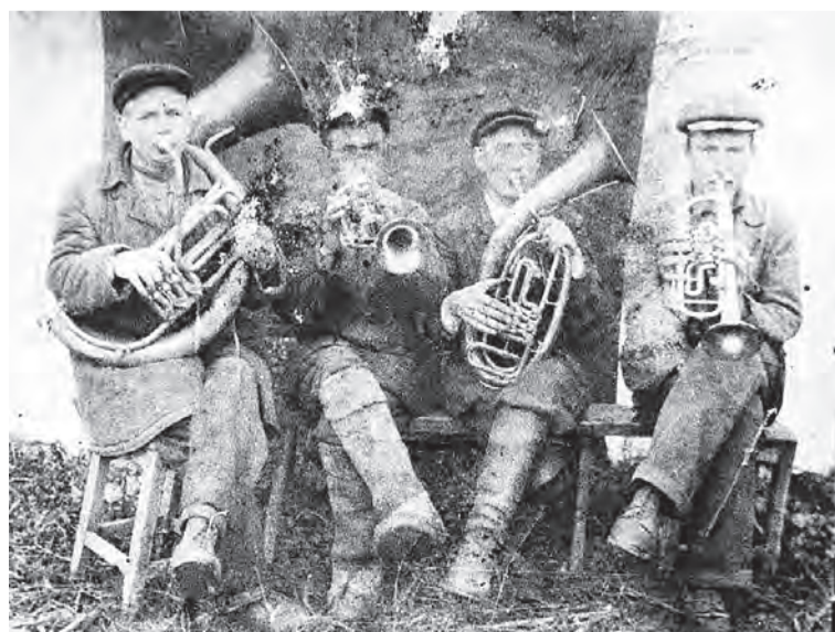
Духовой оркестр играл на всех свадьбах и похоронах в деревне Грибановка.