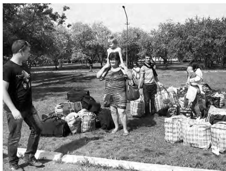
В день приезда беженцев в детский оздоровительный лагерь имени Пономаренко.

Для 20 переселенцев школьного возраста, хоть и временно в нашем районе, прозвенел 1 сентября учебный звонок. Они сели за парты в Марьяновской средней школе №2, в которую осуществляется их подвоз из детского оздоровительного лагеря.