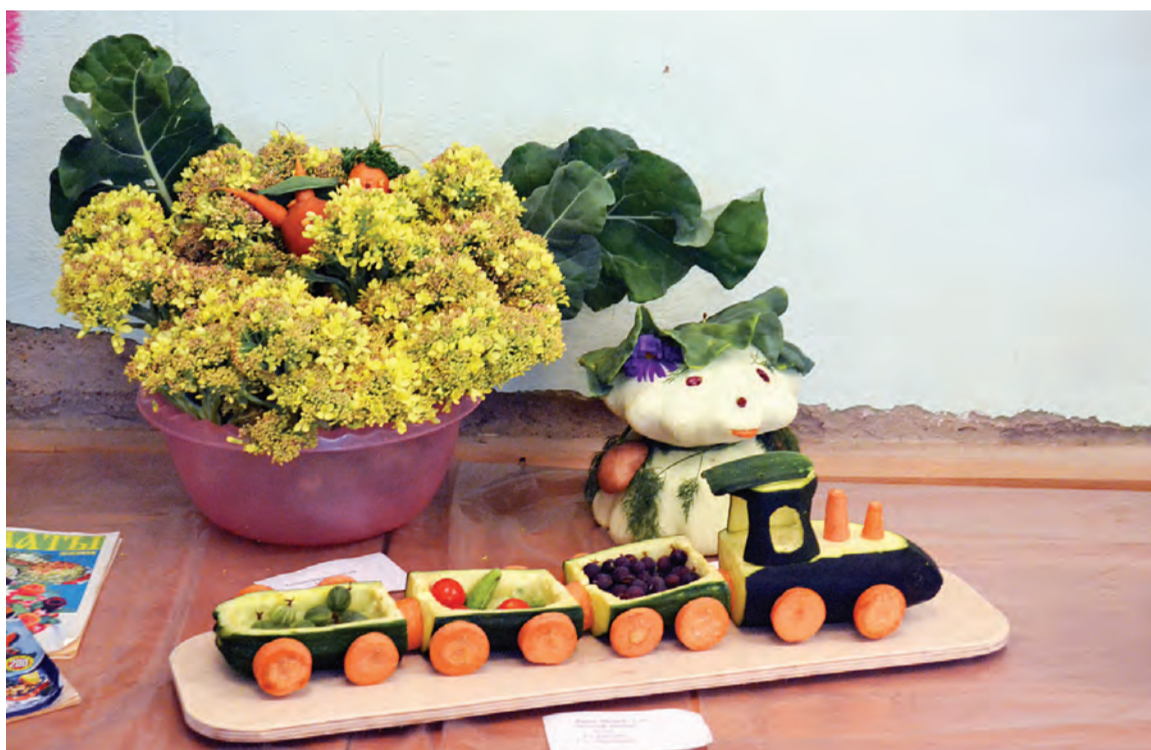
и оригинальные овощные композиции.