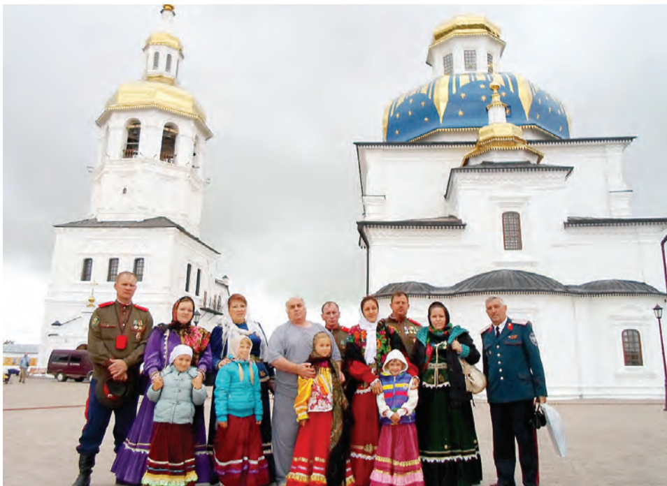
Ансамбль «Станичники» - в Tobolske.