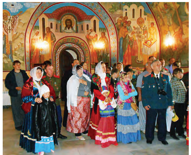
На службе в храме.

– Это была очень интересная поездка и в творческом общении. Мы плодотворно поработали с местным песенным казачьим коллективом, а в Tobolske это движение еще достаточно молодое и таких ярких, позитивных наработок, как в Омске, там пока не имеется. Безусловно, обогатились и культурно, и духовно. Жили в Tobolskom Кремле в монастырских кельях, там проживает очень много паломников отовсюду. Посетили большое количество красивейших храмов, поучаствовали в службах. Побывали на месте последнего боя Ермака и на мемориальном Завальном кладбище, название которого связано с его месторасположением за земляным валом – оборонительным сооружением, защищавшим город с северной стороны. Здесь покоятся такие известные люди, как писатель-сказочник Ершов, поэт Давыдов, отец и сестры великого ученого Менделеева, декабристы Кюхельбекер, Муравьев, Барятинский и другие.