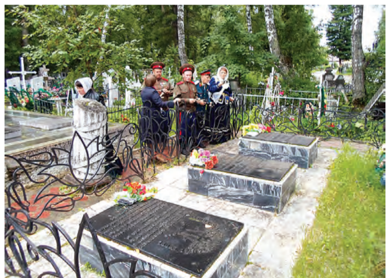
Здесь покоятся известные в России люди.