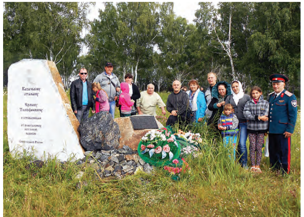
В память о Ермаке.