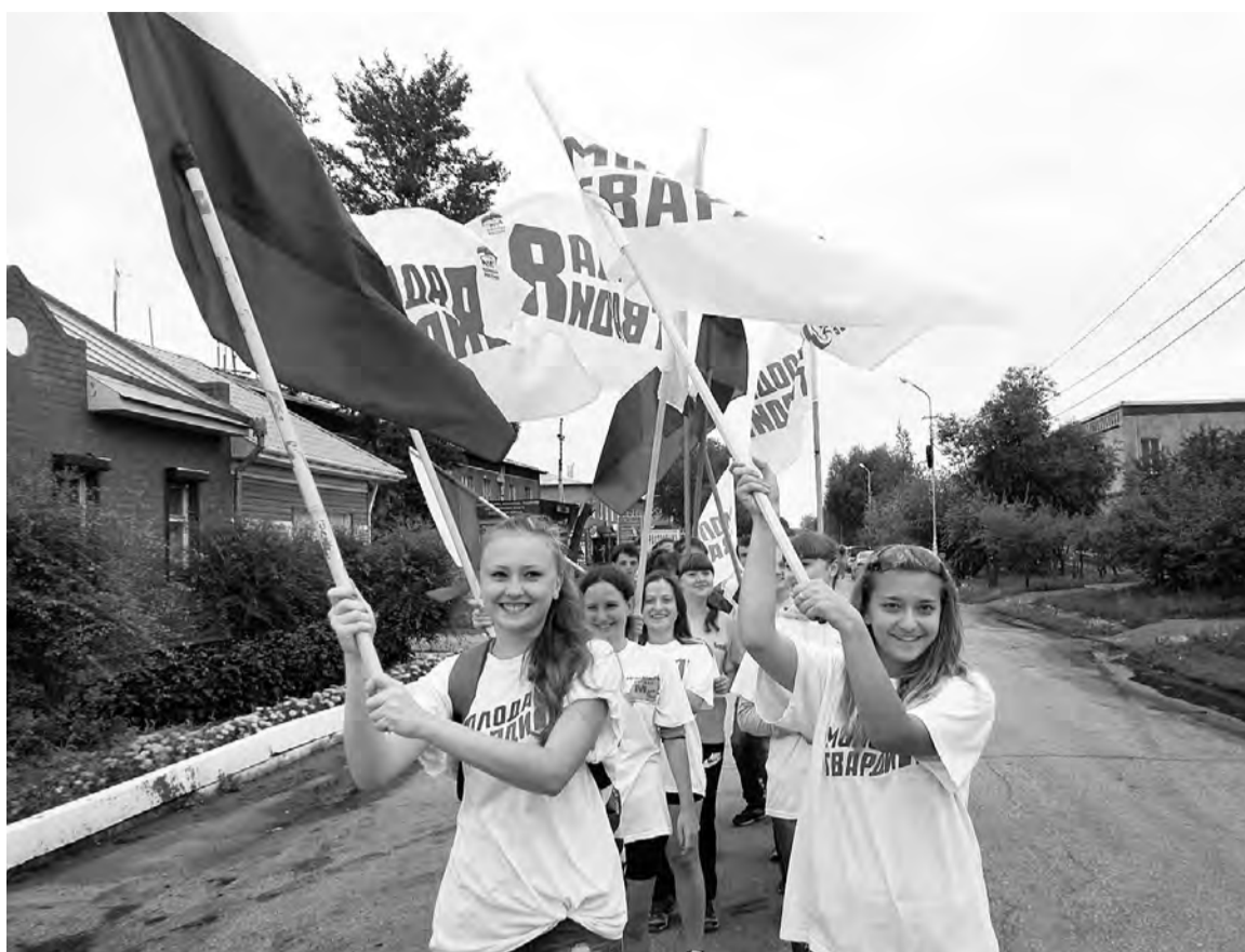
Торжественным шествием отмечен в Марьяновке День государственного флага.