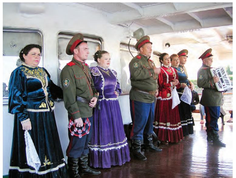
Концерты давались прямо на палубе теплохода.