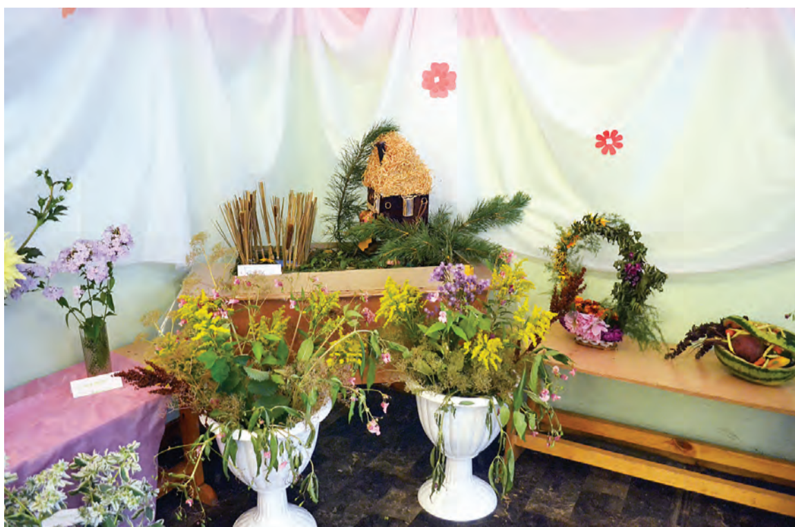
Посетителей привлекали и яркие цветочные,